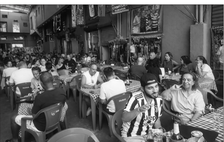
O elegante cenário da Aldeia Portuguesa do CADEG, sempre prestigiado pela comunidade portuguesa e luso-brasileira, em momentos de cultura, convivência e celebração.