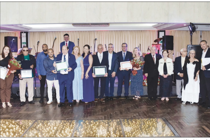
Um momento de emoção e reconhecimento: a entrega dos títulos de sócio honorário do CPN, eternizado nesta noite de gala.