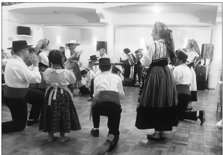
Quarenta anos de história, cultura e alegria! O Rancho Folclórico Juvenil da Casa do Minho encantou a todos durante a festa de comemoração de sua trajetória, mostrando que a tradição e o talento das novas gerações continuam vivos e brilhantes