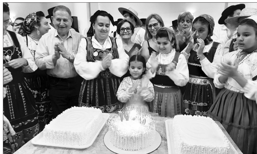
Imagem marcante dos componentes do Rancho Folclórico Juvenil da Casa do Minho reunidos diante do bolo comemorativo, celebrando com alegria e orgulho os 40 anos de fundação do grupo, símbolo da preservação das tradições e da cultura minhota entre as novas gerações.