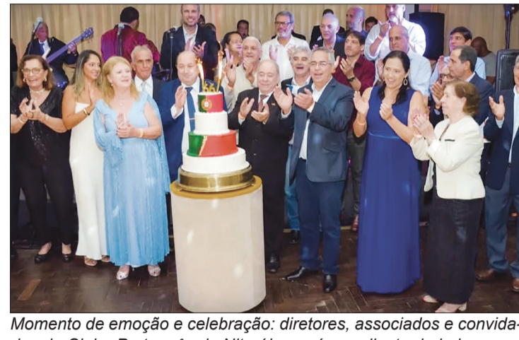
Momento de emoção e celebração: diretores, associados e convidados do Clube Português de Niterói se reúnem diante do bolo comemorativo, celebrando 66 anos de história, amizade e tradição.

A celebração dos 66 anos reforçou não apenas a tradição do CPN, mas também o espírito de união e amizade que permeia a instituição, deixando lembranças inesquecíveis para todos que participaram da noite.