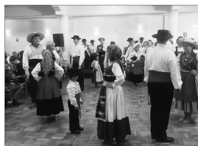
No domingo, o Rancho Folclórico Juvenil da Casa do Minho celebrou 40 anos de história, música e tradição, enchendo o Rio de Janeiro de alegria e orgulho minhoto. Uma festa que honra nossas raízes e inspira as futuras gerações!

O domingo terminou com sentimentos de orgulho, alegria e união. Foi uma celebração que provou que, mesmo após 40 anos, o Rancho Folclórico Juvenil da Casa do Minho continua a cantar, unir e inspirar gerações, mantendo viva a chama da cultura portuguesa no coração da comunidade.