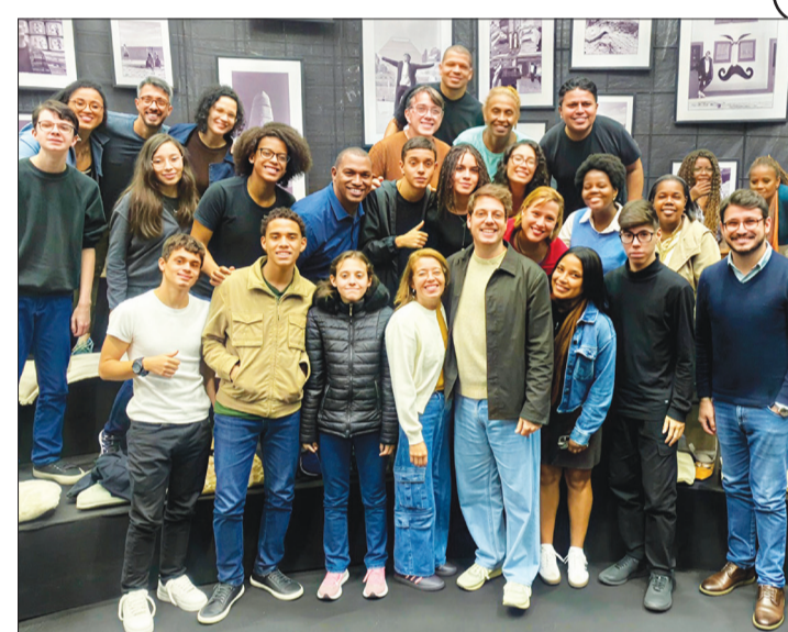
Ao final da gravação, uma foto com o apresentador. Um dia que ficará marcado na memória dos alunos.