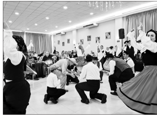
Simplesmente encantadora e magistral a apresentação do Grupo Folclórico Guerra Junqueiro da Casa de Trás-os-Montes e Alto Douro, levando ao público toda a beleza, tradição e emoção da cultura portuguesa.

O tradicional encontro proporcionou ao público um verdadeiro sabor de Portugal com um cardápio especial preparado para os presentes. Entre as delícias do dia estiveram a saborosa sardinha portuguesa na brasa, churrasco completo, caldo verde, acompanhamentos variados e muitas outras opções típicas da culinária lusitana.