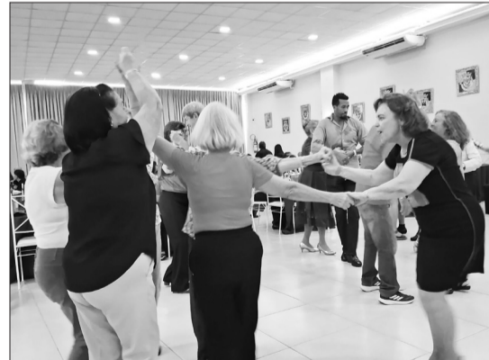
É gratificante ver a comunidade portuguesa reunida, deixando de lado a rotina para celebrar a amizade e a alegria, ao som do animado conjunto Amigos do Alto Minho