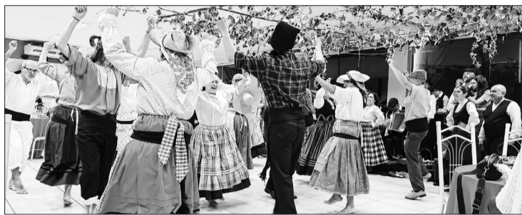
O Rancho Folclórico Fausto Neves deu um verdadeiro show durante a festa das Vindimas, encantando o público com muita alegria, tradição e animação