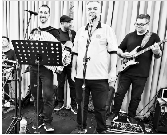
O conjunto Amigos do Alto Minho, mais uma vez, botou pra valer, garantindo animação, boa música e muita alegria durante o Almoço Transmontano