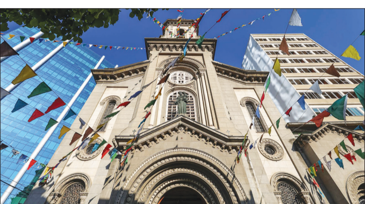
A Paróquia de Santo Antônio dos Pobres, no Centro, acolheu a celebração em ação de graças pelo aniversário da R.B.S.P. Caixa de Socorros D. Pedro V.