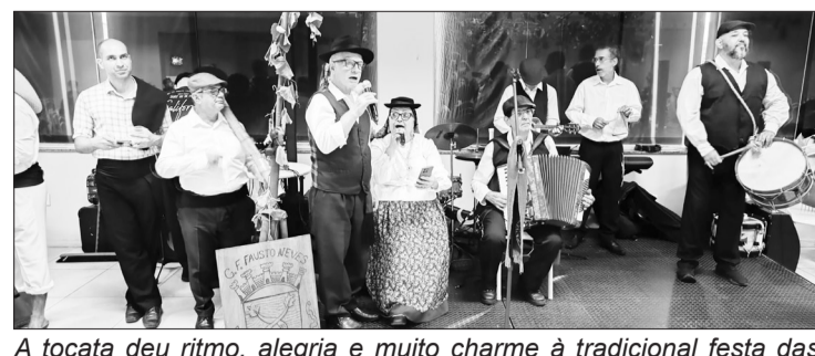
A tocata deu ritmo, alegria e muito charme à tradicional festa das Vindimas da Casa de Espinho, animando o público com o melhor da música portuguesa