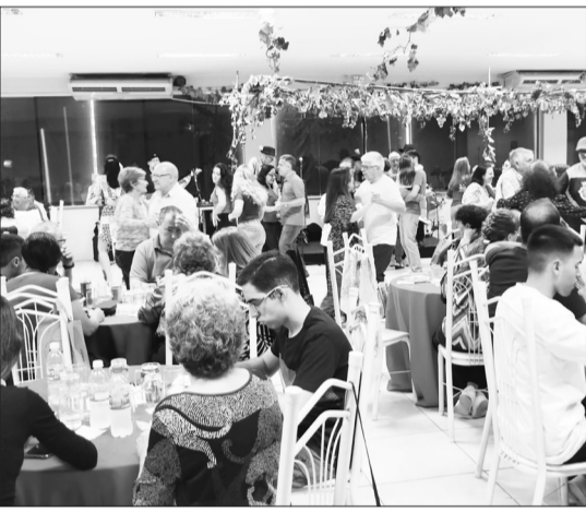
Panorâmica do tradicional almoço das Vindimas na Casa de Espinho, que reuniu amigos e associados em uma tarde maravilhosa de alegria, música e cultura portuguesa.