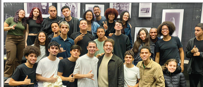
Os alunos e a equipe do Colégio Sagres posam com o apresentador Fábio Porchat.