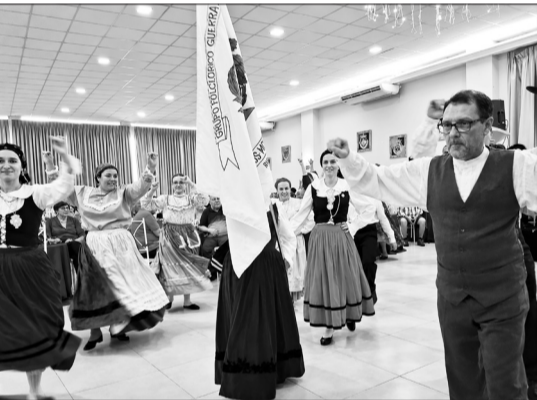
A magia e o encanto do Grupo Folclórico Guerra Junqueiro em mais uma magnífica apresentação, levando ao público toda a beleza, tradição e alegria da cultura portuguesa

A Casa de Trás-os-Montes e Alto Douro promoveu mais um animado Domingo com Almoço Transmontano, reunindo associados, amigos e amantes da cultura portuguesa em uma grande confraternização marcada pela boa gastronomia, música e tradição.