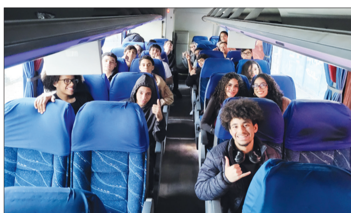
A caminho dos Estúdios Globo.

O episódio gravado tem previsão de exibição no mês de outubro.