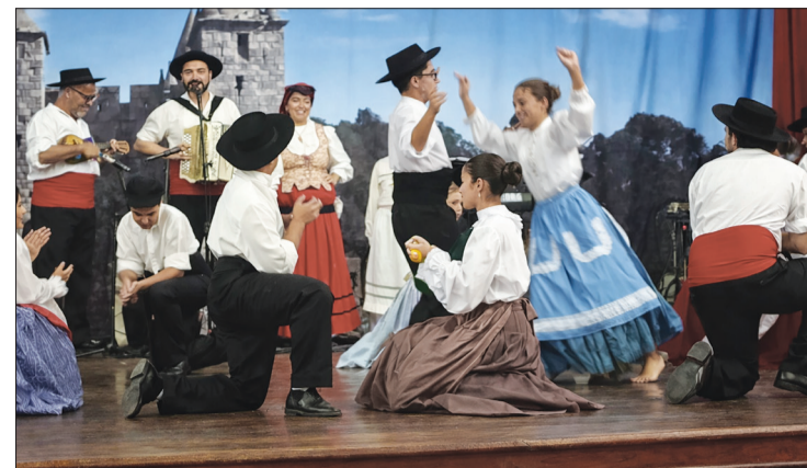
Os jovens do Rancho Folclórico Infante juvenil Danças e Cantares das Terras da Feira protagonizaram um lindo espetáculo de folclore, recebendo os parabéns da direção, que se mostrou muitíssimo orgulhosa