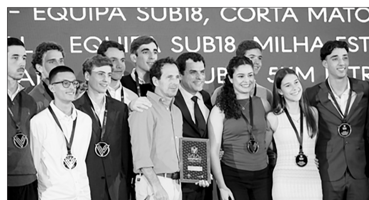
Durante o evento, atletas e clubes do concelho foram distinguidos pelo seu desempenho em 2025, com a atribuição de prémios.