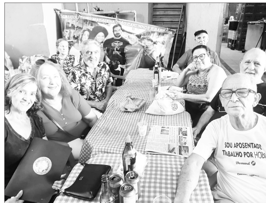
A comunidade portuguesa e luso-brasileira marca presença e prestigia a charmosa aldeia portuguesa do CADEG e a Tasca do Mercado, num ambiente de muita convivência, cultura e sabores inesquecíveis.