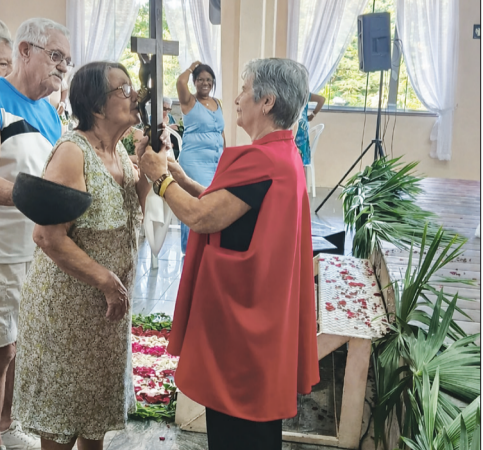
Ao final do ato religioso, vive-se o tradicional momento da Beija-Cruz, ação presente no Clube Camponeses de Portugal, em um gesto de fé, respeito e devoção.

pico português que encantou os convidados. O cardápio trouxe sabores tradicionais e reconfortantes, como rojões à minhota, bifes de caçarola à portuguesa, arroz de bacalhau, pataniscas de bacalhau, frango no forno e feijão à lavrador, um verdadeiro convite à memória afetiva e à cultura gastronômica lusitana. E como não poderia faltar, a festa seguiu com muita alegria, música e dança. O público foi brindado com apresentações do Rancho Folclórico Camponeses de Portugal e do Rancho Folclórico Fausto Neves da Casa de Espinho, que levaram ao palco a riqueza do folclore português, enchendo o ambiente de cor, tradição e entusiasmo. Mais do que um evento, o Domingo de Ramos no Clube Social Camponeses de Portugal foi uma celebração de fé, identidade e comunidade, um encontro que reforça laços, resgata tradições e mantém viva a essência da cultura portuguesa, mesmo longe de sua terra de origem.