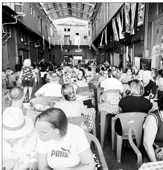
Um belo registro do público degustando e saboreando a deliciosa gastronomia do restaurante Tasca do Mercado, em clima de alegria e convivência. Venha você também desfrutar dessas iguarias e viver essa experiência única!