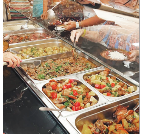
Que deliciosa! Que gastronomia! Sucesso absoluto entre o público presente. Parabéns aos masterchefs que prepararam essas verdadeiras iguarias!