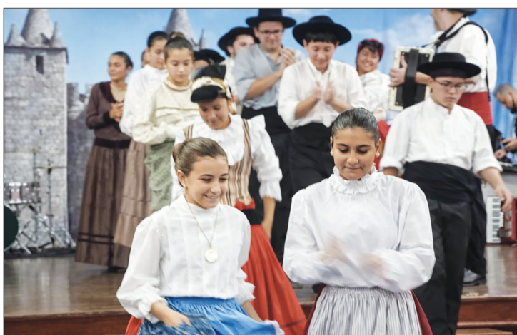
As lindas princesas do Rancho Folclórico Infante juvenil Danças e Cantares das Terras da Feira encerraram a sua apresentação, seguidas pelos restantes componentes, ao descerem do palco na Vila da Feira.

O buffet à vontade foi um espetáculo à parte, com a irresistível sardinha portuque-