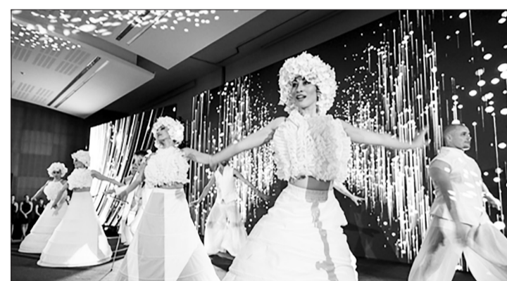
Momentos de música e dança que encantaram e animaram todo o público