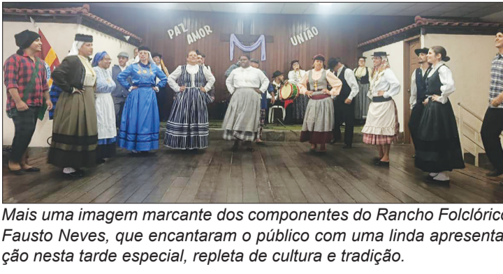
Mais uma imagem marcante dos componentes do Rancho Folclórico Fausto Neves, que encantaram o público com uma linda apresentação nesta tarde especial, repleta de cultura e tradição.