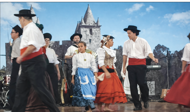
Início do Show R.F.I.J. Danças e Cantares das Terras da Feira encantam e emocionam o público em uma apresentação vibrante de tradição e cultura