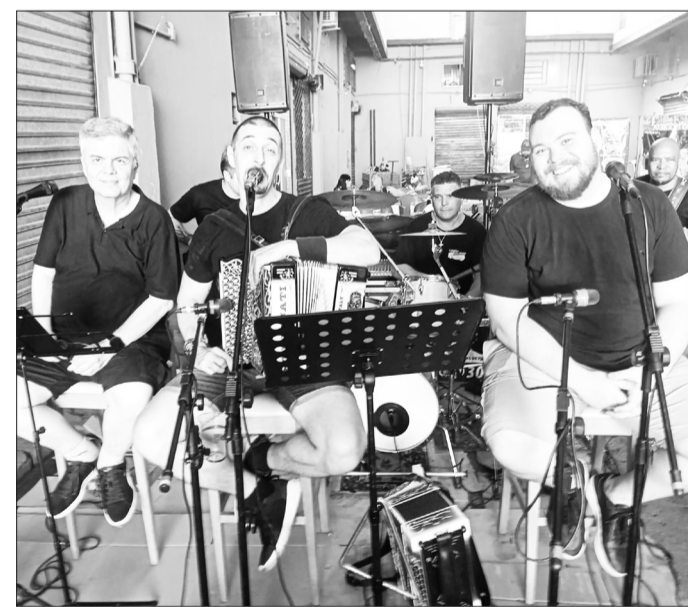
Quem está mandando ver no restaurante Tasca do Mercado, no polo gastronômico do CADEG, é o animado conjunto Amigos do Alto Minho, garantindo música boa e muita alegria para o público.

Venha você também viver essa experiência única porque aqui, cada sábado é uma verdadeira celebração da cultura e da amizade!