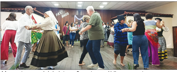
Momento especial de interação entre o público presente e os componentes dos ranchos folclóricos, dançando o tradicional vira-livre, em uma celebração cheia de alegria e tradição.