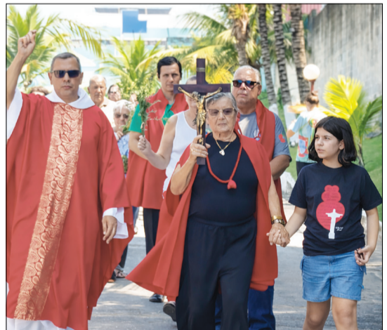
Uma imagem marcante e cheia de vida, vivida na procissão de Domingo de Ramos: a entrada de Jesus Cristo em Jerusalém, sendo acolhido com fé e devoção pelo povo.

de Jesus em Jerusalém, um gesto simples, mas carregado de significado, que mantém viva a tradição da fé católica entre gerações. A programação seguiu com a Bênção Pascal e o tradicional Beija Cruz, momentos de devoção que emocionaram os presentes e reforçaram o espírito de comunhão, respeito e esperança que marca este período tão especial. Após as celebrações religiosas, a confraternização continuou à mesa, com um almoço tí-