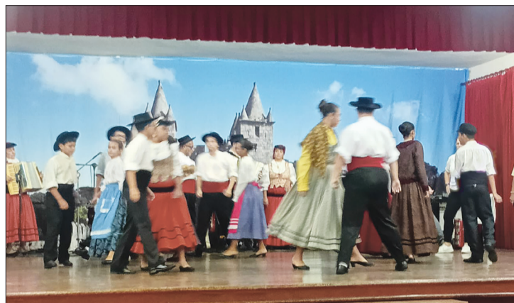
Os integrantes do R.F.I.J. Danças e Cantares das Terras da Feira deram a alma e o coração, emocionando o público em mais uma linda e inesquecível apresentação.