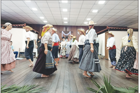
Com seus belíssimos trajes, o Rancho Folclórico Camponeses de Portugal abrilhantou mais uma tarde festiva no clube, encantando o público com sua cultura e tradição.