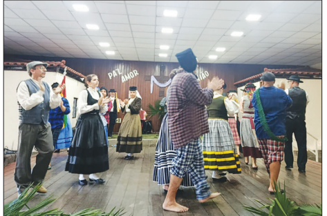
Brilhante participação do Rancho Folclórico Fausto Neves, da Casa de Espinho, que encantou o público no Domingo de Ramos, no Clube Camponeses de Portugal