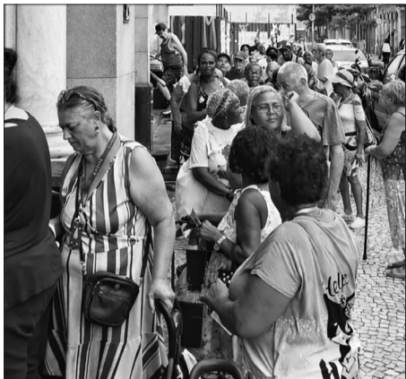
Sem sombra de dúvida, um trabalho de benemerência imensurável realizado pela Irmandade: na imagem, assistidos aguardam com esperança e dignidade a distribuição de suas cestas básicas, fruto de uma ação solidária que transforma vidas.