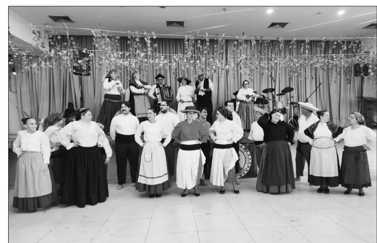
Abertura das vindimas na Casa de Viseu em destaque, com a participação dos componentes do Rancho Folclórico viseense, que deram cor, tradição e animação a este momento

Mais do que uma celebração, a tarde foi um re-