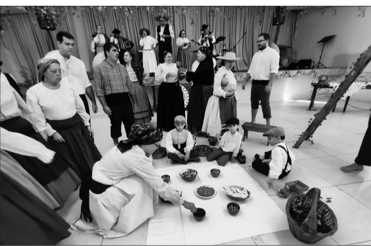
Já realizadas as vindimas, os componentes do Rancho Folclórico da Casa de Viseu reúnem-se no momento da tradicional merenda, celebrando o convívio, a partilha e a preservação das tradições.