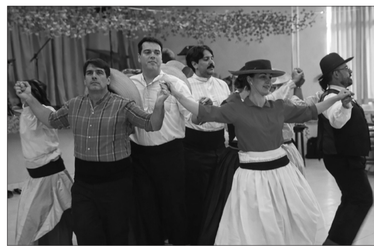
Magnífica apresentação do Rancho Folclórico da Casa de Viseu. Um verdadeiro espetáculo! Parabéns a todos os integrantes do Rancho Folclórico da Casa de Viseu pela linda apresentação.