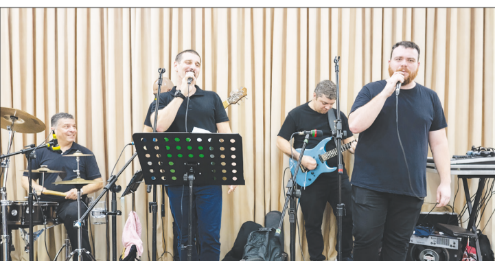
O conjunto Amigos do Alto Minho cresce a cada dia, ganhando cada vez mais ritmo e qualidade. Parabéns a todos os integrantes pelo excelente trabalho e dedicação!