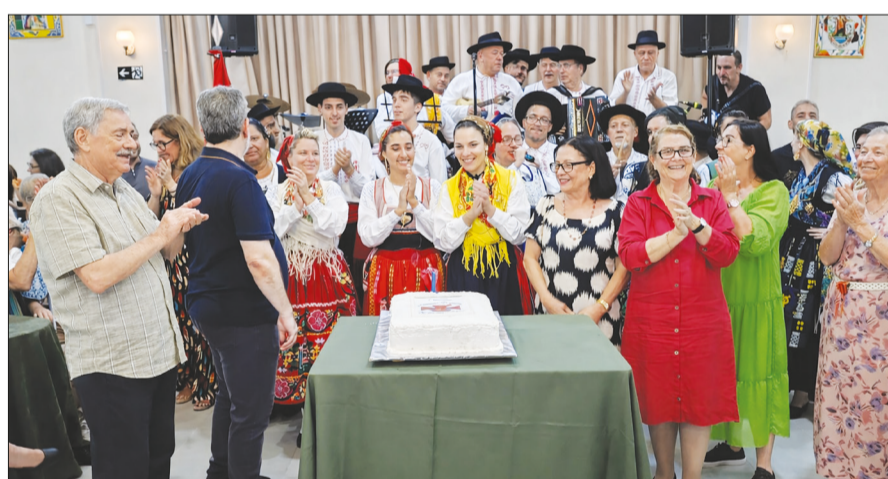
Diante do bolo comemorativo, podemos ver os componentes do Grupo Folclórico Serões das Aldeias, juntamente com convidados, celebrando o 2º aniversário de fundação da Associação

O evento reuniu amigos, familiares e apreciadores da cultura lusa em um ambiente acolhedor e festivo, marcado por momentos de confraternização e alegria. O cardápio foi um verdadeiro destaque à parte, com deliciosas sardinhas portuguesas, churrasco, saladas, caldo e variados acompa-