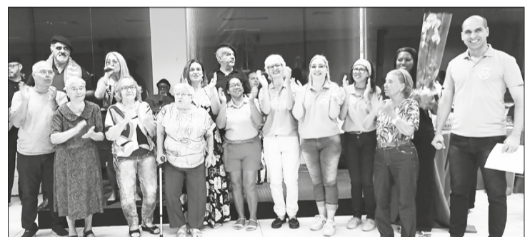
Homenagem especial aos aniversariantes do mês de abril, celebrada com carinho e alegria durante o Almoço Dançante, em um momento de confraternização e boas energias