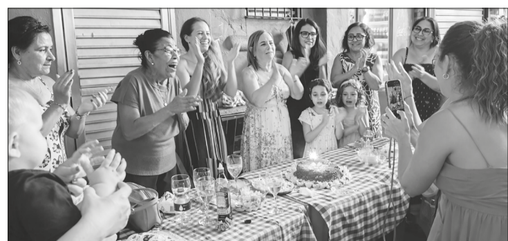
No coração do CADEG, os restaurantes Tasca do Mercado e Cantinho das Concertinas tornam-se muito mais do que simples espaços são verdadeiros cenários de encontros, onde amigos e familiares se reúnem para celebrar a vida. Entre risos, abraços e brindes, cada aniversário ganha um toque especial, transformando-se numa linda e inesquecível confraternização