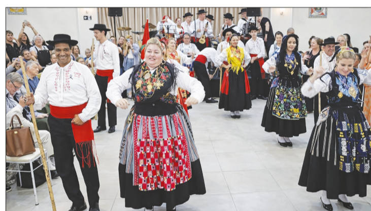
Componentes do Grupo Folclórico Serões das Aldeias brilhando neste dia festivo no Solar Transmontano

nhamentos, agradando a todos e reforçando o clima de celebração.