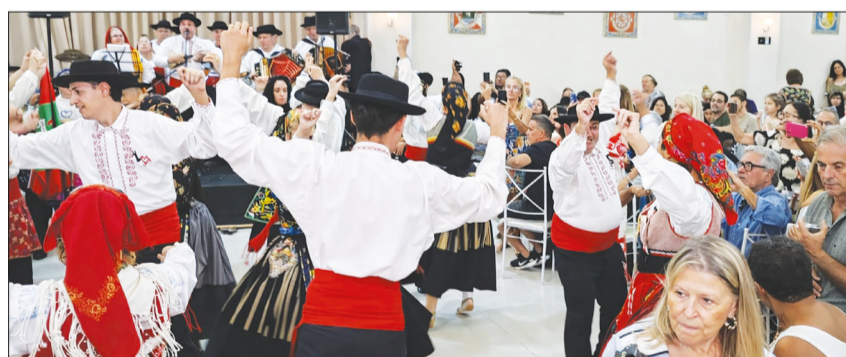
O público presente vibrou com mais uma magnífica apresentação do Grupo Folclórico Serões das Aldeias neste dia de comemorações

união, pela valorização da cultura portuguesa e pelo espírito comunitário que define o Serões das Aldeias. Um evento digno de aplausos, que reforça a importância de manter vivas as tradições e fortalecer os laços entre gerações. Parabéns a todos os envolvidos por essa linda celebração!