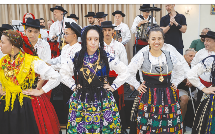
A tocata, como sempre, dando ritmo à apresentação dos componentes do Grupo Folclórico Serões das Aldeias.