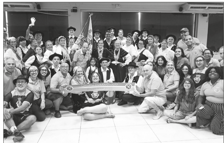
Momento de integração e partilha entre os integrantes do G.F. Armando Leça, da Casa do Porto, e do G.F. Fausto Neves, da Casa de Espinho, celebrando a união e o espírito do folclore português