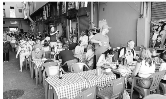
Panorâmica de mais um sábado movimentado nos restaurantes Tasca do Marquês e no Cantinho das Concertinas, no CADEG, marcado por grande animação, convívio e muita boa disposição entre amigos e visitantes.

Visual do bonito e aconchegante restaurante Cantinho das Concertinas, um espaço acolhedor que se destaca pelo ambiente familiar, pela boa disposição e pela tradição, tornando-se um verdadeiro ponto de encontro no CADEG