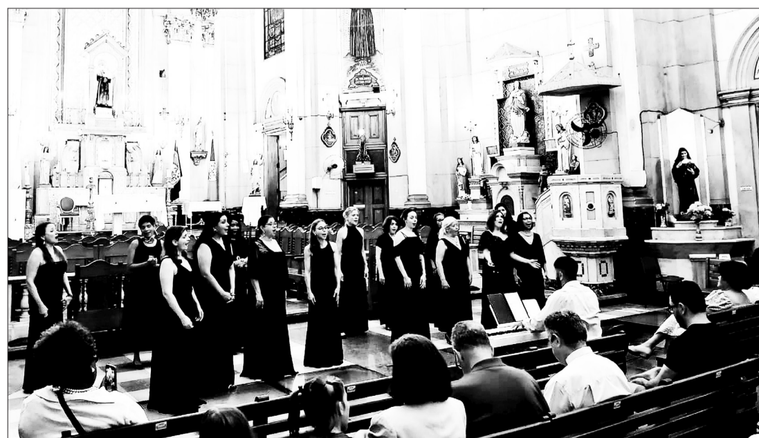
O público presente ficou encantado com a linda apresentação do Coro Lírico Feminino da ACC