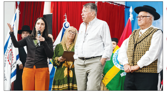
Dra. Ana Rita Ferreira, Cônsul-Adjunta de Portugal, durante o seu discurso no Festival de Folclore 2026.

No palco, a moçada arrebatou. Com muita energia, emoção e entusiasmo, os participantes deram um verdadeiro show, envolvendo o público do início ao fim e transformando o festival numa grande celebração da cultura portuguesa. O ambiente de alegria e integração foi um dos pontos altos do evento, fortalecendo os laços entre as