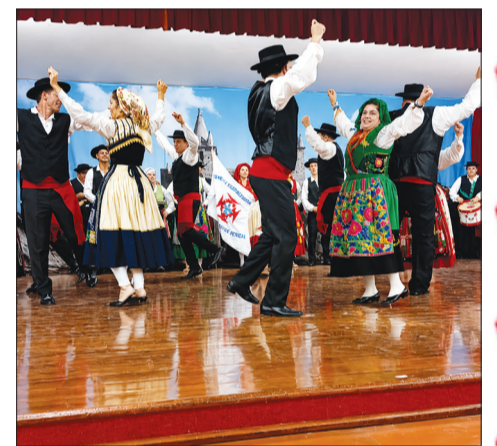
Mais uma apresentação espetacular no Festival de Folclore Português com a participação do R.F. Luís de Camões, do Clube Português de Niterói