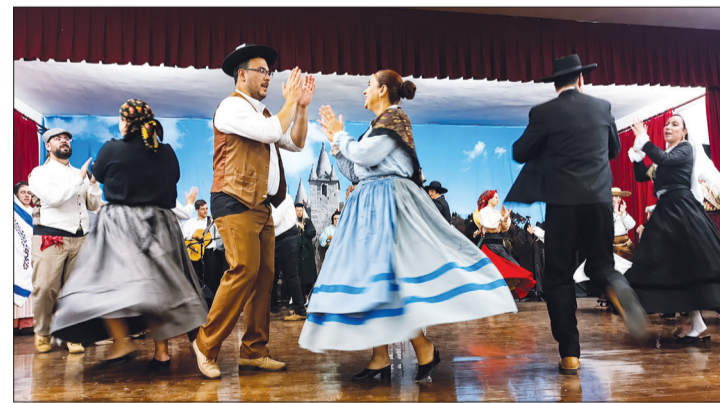
Mais um lindo espetáculo marcou o Festival de Folclore Português com a participação do R. F. da Casa de Viseu, que encantou o público com tradição e alegria.