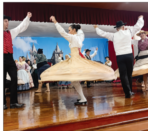
Quem também brilhou no Festival de Folclore Português foi o Rancho Folclórico Camponeses de Portugal, com autenticidade, estilo e muita emoção.