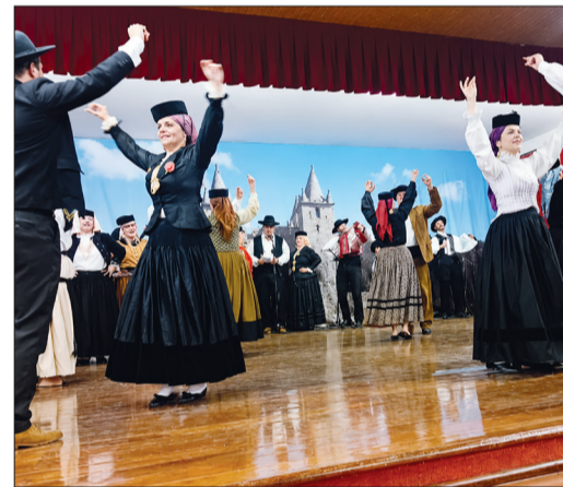
Quem também marcou presença nesta tarde de folclore foi o Rancho Folclórico do Arouca Barra Clube, levando ao palco toda a beleza, alegria e riqueza cultural.