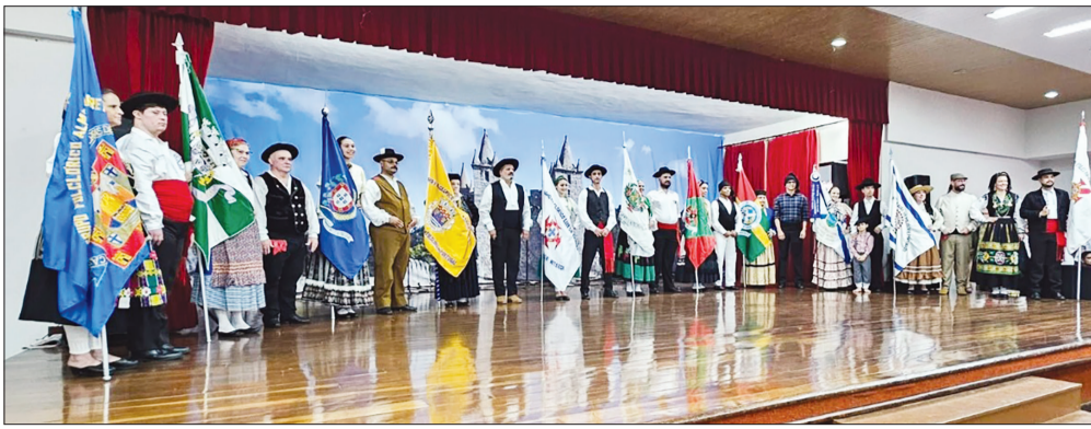
Tradição, cultura e alegria marcaram a abertura do Festival de Folclore 2026, com os ranchos e grupos folclóricos participantes reunidos no palco da Casa da Vila da Feira, celebrando as raízes e a riqueza das tradições populares.

O Festival de Folclore Português 2026 foi marcado por uma tarde inesquecível de cultura, emoção e confraternização. Realizado no dia 7 de junho, na Casa da Vila da Feira e Terras de Santa Maria, na Tijuca, o evento reuniu um