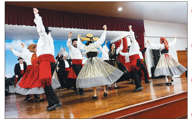
Encerrando o Festival de Folclore Português com chave de ouro, o R. F. Maria da Fonte, da Casa do Minho, em mas um lindo show