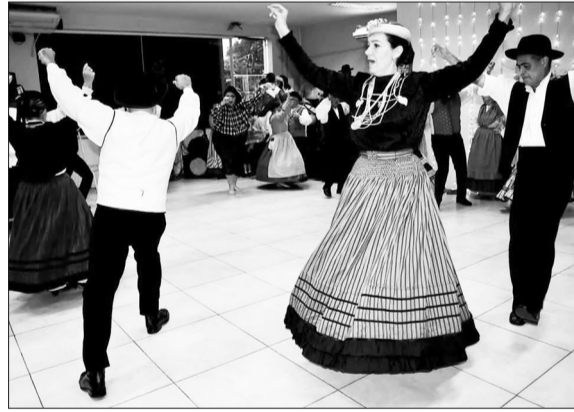
Belíssima apresentação dos G.F. Camponeses de Portugal é realmente especial e como sempre dando show