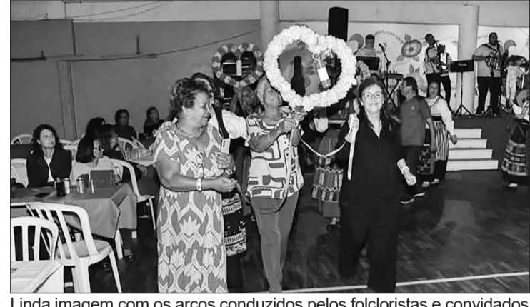
Linda imagem com os arcos conduzidos pelos folcloristas e convidados

mendado por alguns agentes de turismo do Rio de Janeiro. Imperdível! Nas amplas instalações da Casa do Minho o visitante logo se sente à vontade optando entre o salão, naquela noite repleto, a beber um dos três tipos de vinho e a saborear as sardinhas portuguesas na brasa, ou um delicioso petisco, acompanhado de broa de milho. Presentes na Quinta de Santoinho estavam o conjunto Amigos do Alto Minho que garantiram a animação