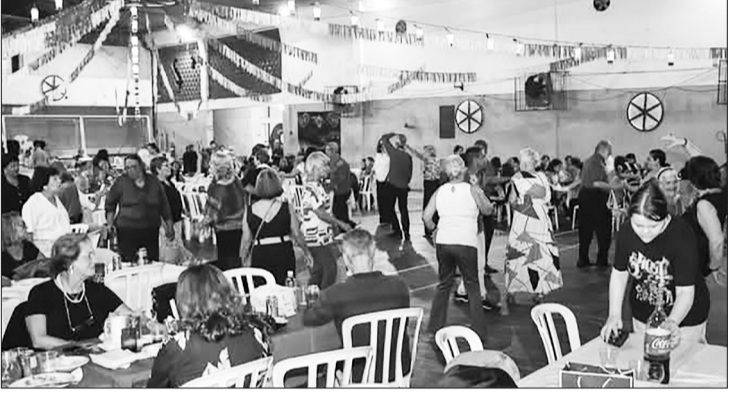
Panorâmica do ginásio, lotado, na Quinta de Santoinho onde a atenção é sempre dirigida ao público