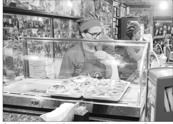
Os deliciosos pastéis de Belém, você também encontra no Restaurante Cantinho das Concertinas