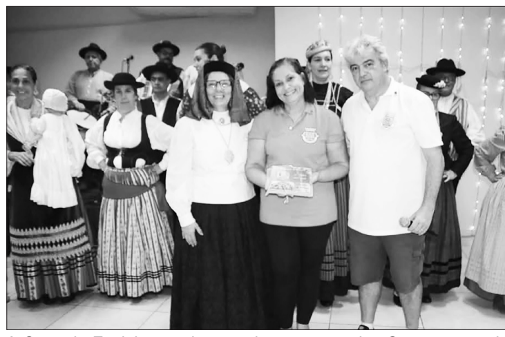
A Casa de Espinho recebe uma homenagem dos Camponeses de Portugal no almoço festivo