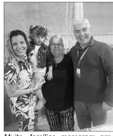
Muita, famílias marcaram presenças no tradicional a Arraial Minhoto

com vasto repertório. O rancho folclórico Minhoto acompanhado pela tocata da Casa fez um "aquecimento" junto ao público com os seus sanfoneiros de bombo, ferrinho, etc. Não faltaram os já conhecidos bonecos, também muito tradicionais, mostrando a alegria das danças e cantares de Viana do Castelo e do Minho em geral tomam conta do ambiente. Com a exibição no sábado do rancho Minhoto, como podemos ver, o que não falta à Quinta de Santoinho é muito calor das nossas tradições!.