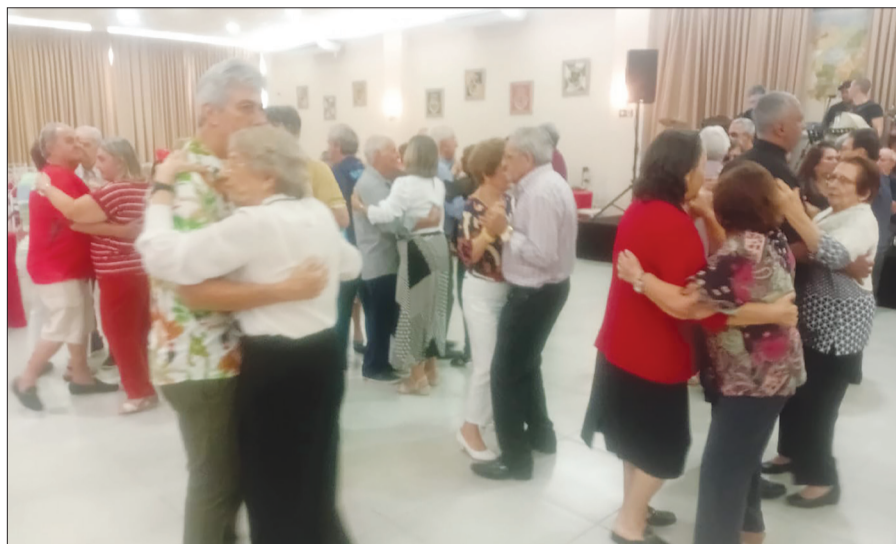
Os casais enamorados bailando no salão da Casa de Trás-os-Montes, mostrando os seus dotes de dançarinos