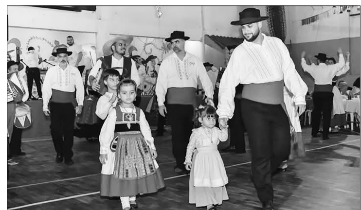
Bonitos componentes mirim do Rancho Maria da Fonte da Casa do Minho foi a atração da Noite