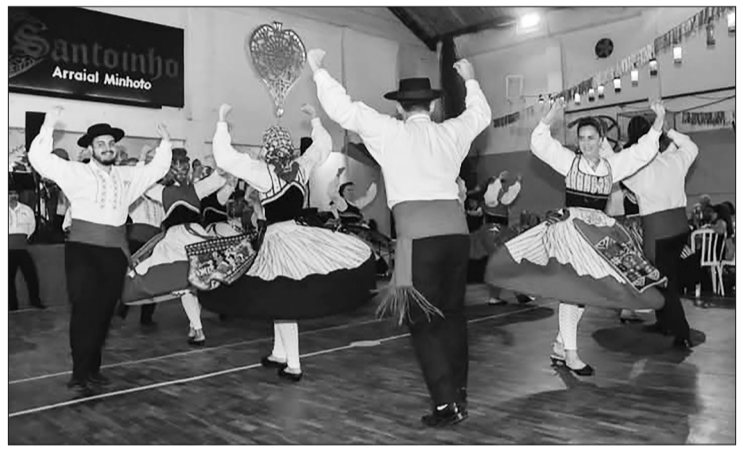
Magistral espetáculo do rancho folclórico da casa do Minho no Arraial Minhoto

com vasto repertório. O rancho folclórico Minhoto acompanhado pela tocata da Casa fez um "aquecimento" junto ao público com os seus sanfoneiros de bombo, ferrinho, etc. Não faltaram os já conhecidos bonecos, também muito tradicionais, mostrando a alegria das danças e cantares de Viana do Castelo e do Minho em geral tomam conta do ambiente. Com a exibição no sábado do rancho Minhoto, como podemos ver, o que não falta à Quinta de Santoinho é muito calor das nossas tradições!.