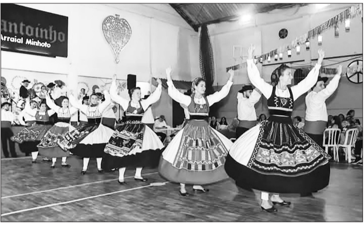
Bonito Rancho Folclórico Maria da Fonte Casa do Minho foi a atração da Noite