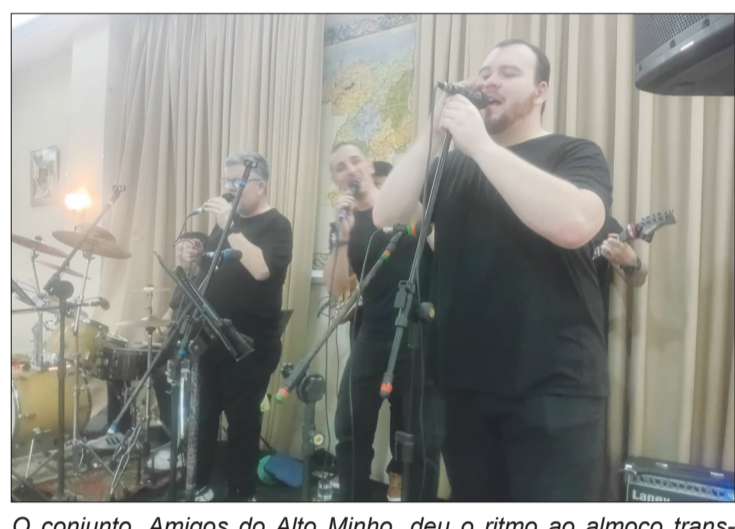
O conjunto, Amigos do Alto Minho, deu o ritmo ao almoço transmontano, evento sempre aguardado por aqueles que apreciam uma Casa Regional