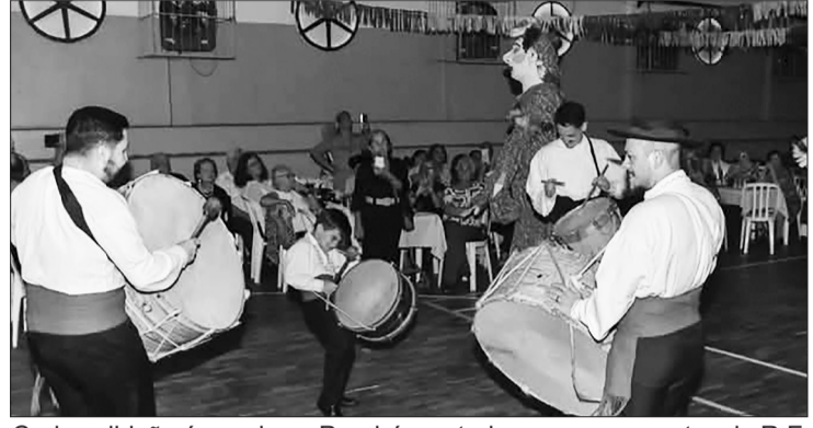
Cada exibição é um show. Parabéns a todos os componentes do R.F. Maria da Fonte

Um arraial tipicamente português, a Quinta de Santoinho, aconteceu mais uma vez no último sábado, na Casa do Minho. Em reprodução do que acontece em Portugal por ocasião da colheita da uva, em agradecimento ao padroeiro, na região do Minho. A animação se repete na Casa da rua Cosme Velho, todo primeiro sábado de cada mês. Com o estacionamento lotado e muitos turistas, a Quinta de Santoinho já é um programa reco-