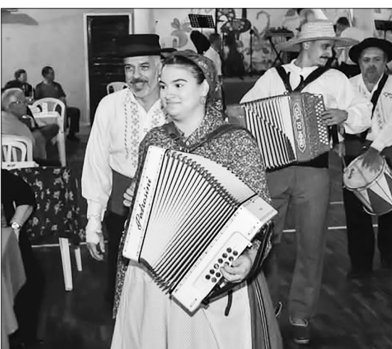
Tocata, o coração que pulsa o Rancho Folclórico Maria da Fonte, já apresentando os músicos que continuarão o trabalho de divulgar o folclore minhoto