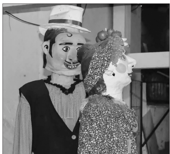
A entrada triunfal dos Bonecos e Gingatones, no Arraial Minhoto é sempre uma atração à parte