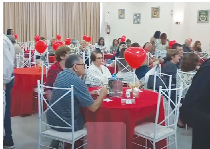
Panorâmica do almoço festivo dos namorados, na Casa de Trás-os-Montes e Alto Douro