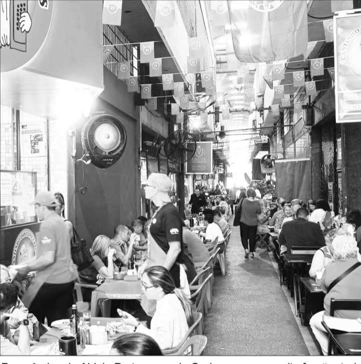
Panorâmica da Aldeia Portuguesa do Cadeg, sempre muito freqüentada pela comunidade portuguesa e luso brasileira e convidados

5 Mandatos como Vereadora do Rio Presidente PSDB-RJ Presidente de Honra do Memorial às Vítimas do Holocausto