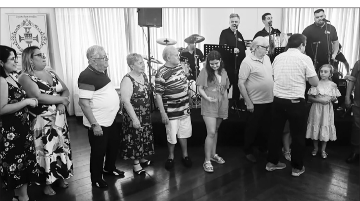
Durante a confraternização, a diretoria da Casa dos Açores homenageou os aniversariantes presente

O almoço de confraternização marcou a atividade de fim de ano da Casa dos Açores do Rio de Janeiro, com muita alegria e celebração. No cardápio, churrasco na brasa com carnes nobres, frango, porco, linguíça, sardinha e uma deliciosa variedade de acompanhamentos. A música ficou por conta do Conjunto Amigos do Alto Minho, animando todos