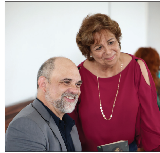
Lançamento do livro "D. Pedro II", de Paulo Rezzutti, no IHGB