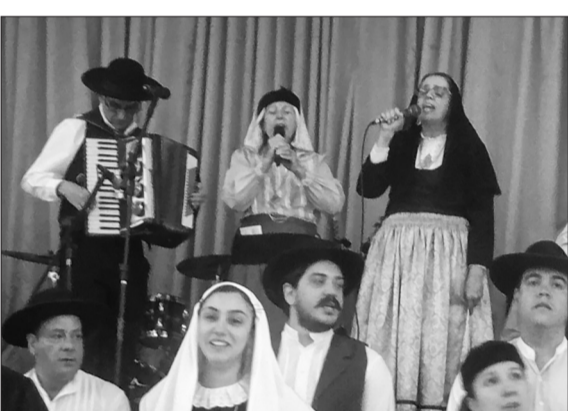
A tocata do Rancho da Casa de Viseu sempre se destaca em suas apresentações