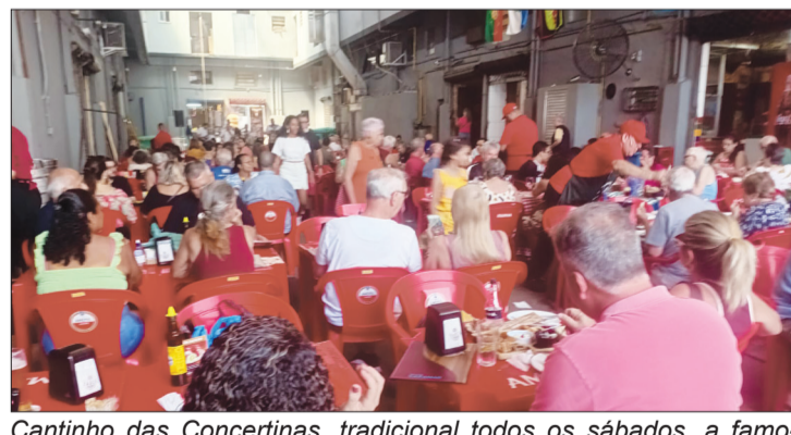
Cantinho das Concertinas, tradicional todos os sábados, a famosa aldeia portuguesa do CADEG, sempre muito movimentada com clientes e amigos