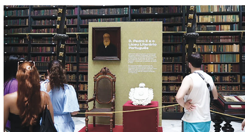
Quadro e cadeira do Imperador na Exposição "D. Pedro II, o Real Gabinete e o Liceu Literário Português"