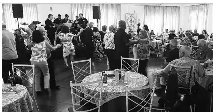
Panorâmica da festa de encerramento das atividades da Casa dos Açores, com a casa completamente lotada de associados e amigos