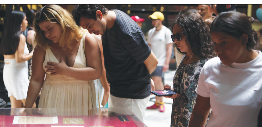
Público observa objetos que contam a história do último Imperador do Brasil