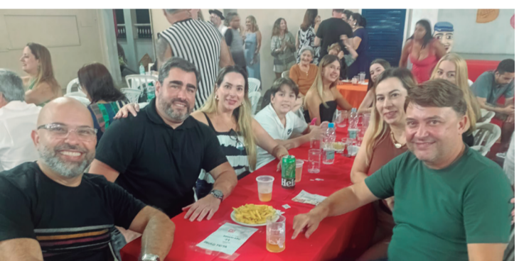
Gente boa, jovem, simpática e sorridente prestigiando o aniversário de 71 anos do Rancho Folclórico Maria da Fonte na Casa do Minho