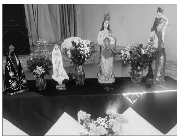
Lindo ver a imagem de Nossa Senhora da Conceição e de outros santos sendo louvados na Casa de Viseu

A Festa da Padroeira da Casa do Distrito de Viseu, Nossa Senhora da Conceição, foi realizada no domingo passado e foi mais uma linda celebração no Solar Visiense. Como é tradição todos os anos, aconteceu um almoço festivo em homenagem à padroeira, reunindo associados e amigos para degustarem um delicioso churrasco especial, acompa-