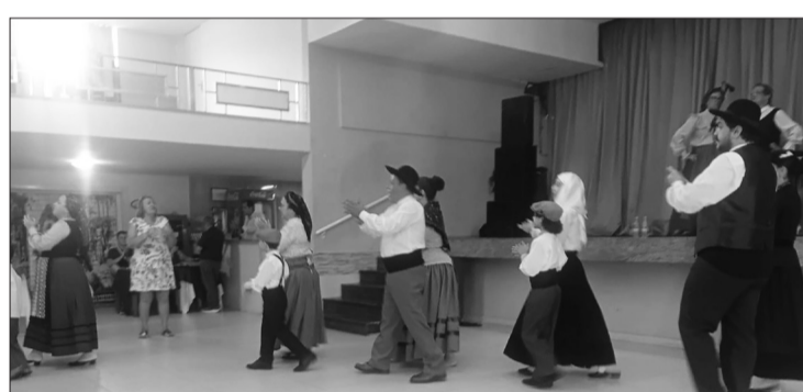
Rancho Folclórico da Casa de Viseu. Que espetáculo maravilhoso! Parabéns, moçada, pela apresentação cheia de energia, talento e tradição!