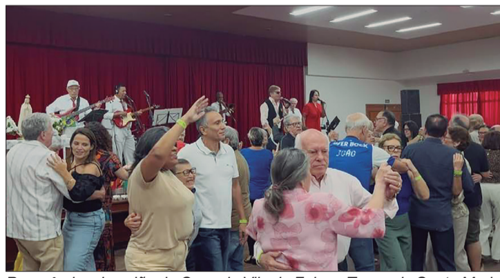
Panorâmica do salão da Casa da Vila da Feira e Terras de Santa Maria, totalmente lotado de repleto de "pés-de-valsas"