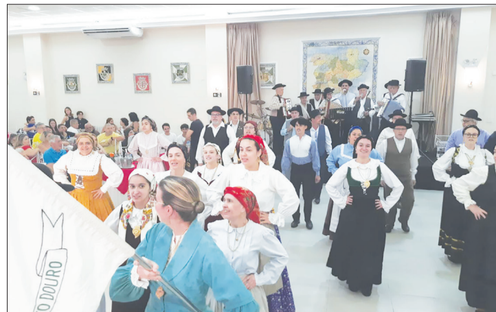
Entrada do magistral Rancho Folclórico Guerra Junqueiro, para mais uma bellissima a apresentação

Dando seqüência à sua programação mensal, a Casa de Trás-os-Montes realizou mais um convívio social, com o seu almoço dos em homenagem aos Aniversariantes do Mês. Um cardápio sempre de primeira, com sardinha portuguesa na brasa, acompanhamentos e saladas diversas. Dando ritmo à festa,