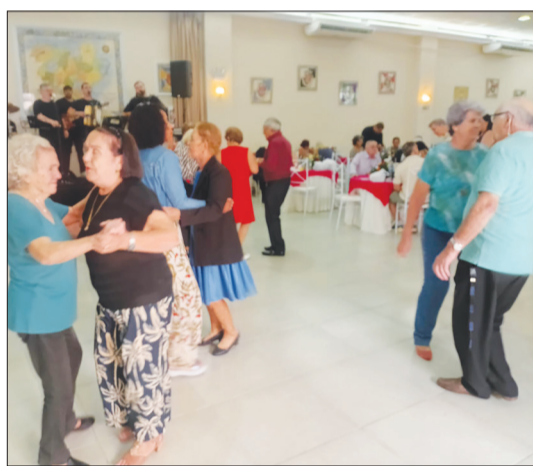
Panorâmica do almoço dos aniversariantes na Casa de Trás os-Montes