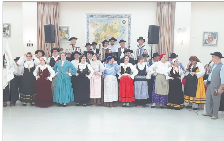
Componentes do Rancho Guerra Junqueiro com os seus lindos trajes entoando lindos cânticos com a sua Tocata

o Conjunto Amigos do Alto Minho, com direito a um repertório de muito bom gosto agitando o salão. Mas, a atração mais aguardada foi, sem dúvida, o Grupo Folclórico Guerra Junqueiro que agitou o salão e contagiou o público com os seus cantares e danças da sua região, sempre mantendo acesas as tradições Portuguesas