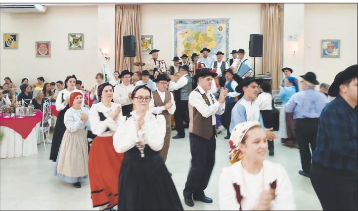
O verdadeiro show a apresentação do Rancho Folclórico Guerra Junqueiro participando do almoço em homenagem aos aniversariantes