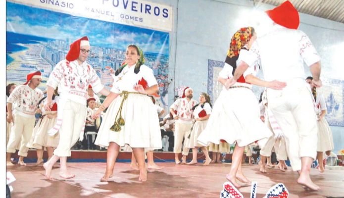
Um verdadeiro espetáculo de Folclore, apresentado pelo Rancho Poveiro, mostrando toda a sua magia, trajes e cantares e dançares