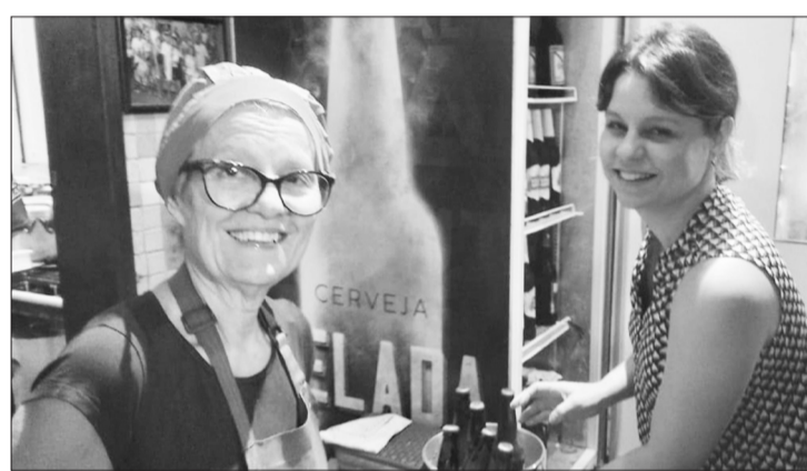
Duas grandes guerreiras, faço chuva ou sol, firme e forte levando, com muita luta e trabalho, o nosso Cantinho das concertinas um pedacinho de Portugal no Rio de Janeiro

tribuindo sorrisos aos amigos que toda a semana prestigiam esse pedacinho de Portugal, onde podem curtir a famosa Aldeia Portuguesa do Cadeg, vem você também fazer parte desta família do Cantinho das Concertinas, onde os clientes e amigos são recebidos com muito carinho e atenção, não podemos deixar de destacar a equipe de colaboradores, sempre atenciosa e eficaz atendimento Cantinho das Concertinas a extensão da vossa casa só chegar e desfrutar.