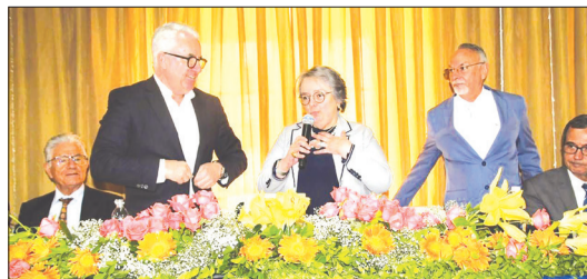
Embaixadora de Portugal Gabriela Soares de Albergaria, realizou, bellissimo discurso, falando da importância da união entre o Brasil e Portugal, ficou muito feliz em pisar pela primeira vez na Casa dos Poveiros e gostou muito de tudo que viu !