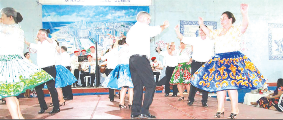
Momento mágico da tarde o Rancho Poveiro fez uma brilhante apresentação empolgando a todos os presentes que show