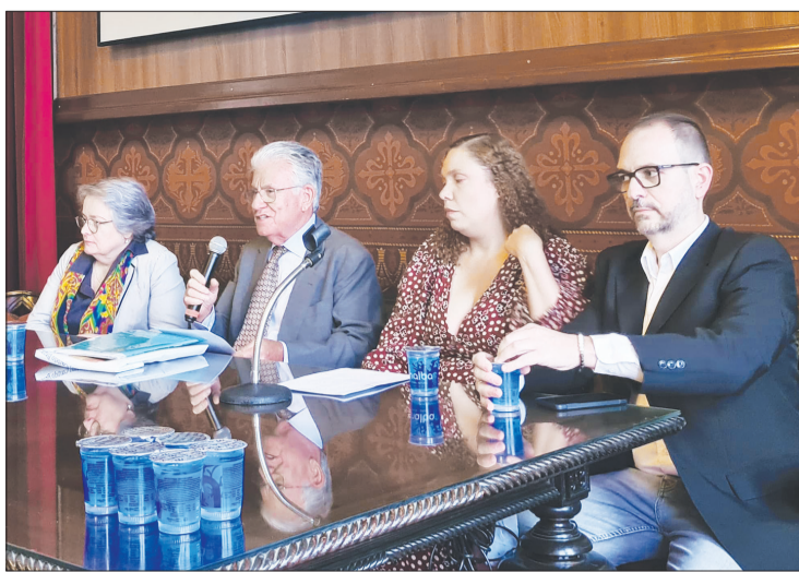
Mesa de honra Colóquio Internacional 200 anos de Camilo Castelo Branco no Real Gabinete Português