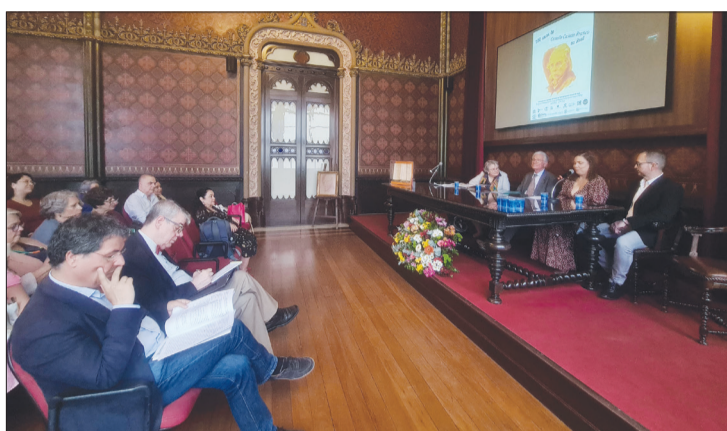
Assistência dos convidados, Colóquio Internacional 200 anos de Camilo Castelo Branco