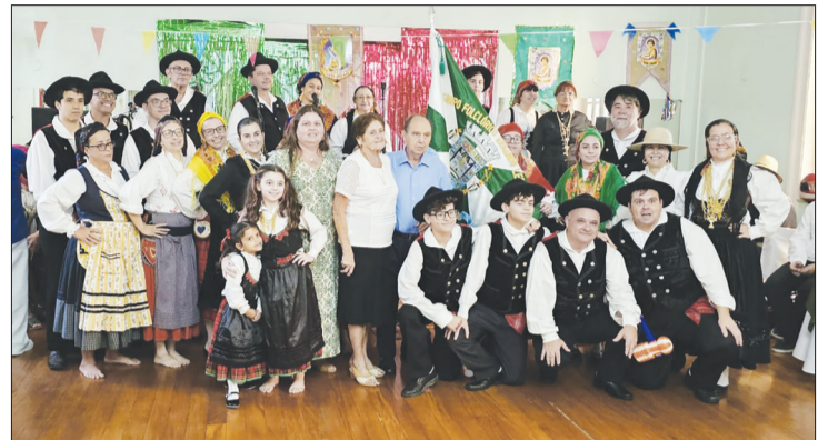
Belíssima exibição do R.F. Armando Leça, na festa de São João do Porto

taram que, quem gosta de um ambiente agradável com alegria e boa comida, nunca se desaponta nos almoços da Casa do Porto. Agora, o Rancho Folclórico Armando Leça, quando se apresenta dá um verdadeiro show de folclore da região do Porto. Nada mais falta para o sucesso desta Casa, tão tradicional da Rua Afonso Pena na Tijuca.