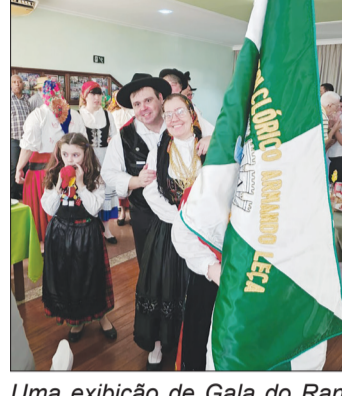
Uma exibição de Gala do Rancho Folclórico Armando Leça da Casa do Porto que Show

taram que, quem gosta de um ambiente agradável com alegria e boa comida, nunca se desaponta nos almoços da Casa do Porto. Agora, o Rancho Folclórico Armando Leça, quando se apresenta dá um verdadeiro show de folclore da região do Porto. Nada mais falta para o sucesso desta Casa, tão tradicional da Rua Afonso Pena na Tijuca.