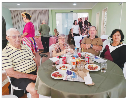
Gente muito fina que marcou presença na Casa do Porto, na Festa Junina