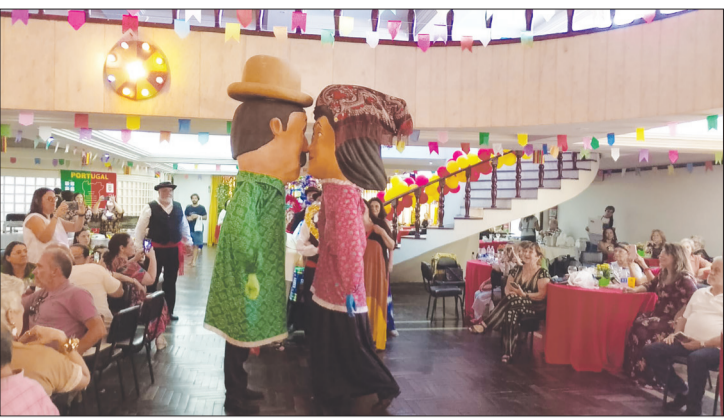
As tradições do Minho revida, Quinta de Santoinho, destaque para os tradicionais bonecos Gigantones agitando o público