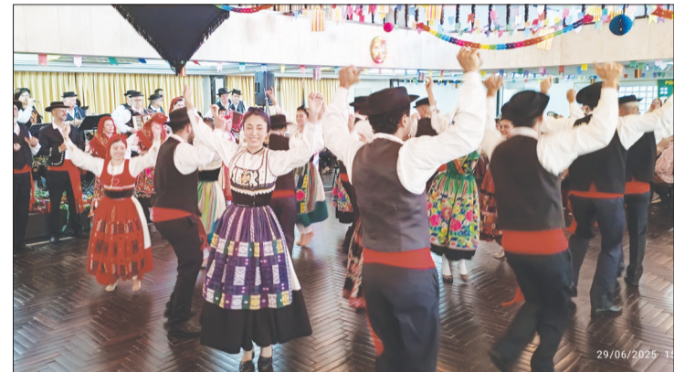
Um show de folclore do R.F. Luís de Camões na Quinta de Santoinho, no Clube Português de Niterói

É em Santoinho que se revive a cultura tradicional da vida do campo, com as músicas e danças folclóricas, na companhia dos petiscos à base de sardinhas assada, febras, frango, regados pelo Vinho do Pipo da região e culminando com o saboroso e aconchegante caldo verde. A decoração é pensada ao pormenor, onde as peças fazem brilhar a festa popular. Além das bandeirolas coloridas que circundam os palcos privilegiados do arraial, estão