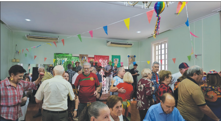
O conjunto Típicos da Beira Show agitou a festa Junina dos Santos Populares