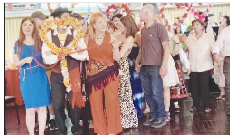
Simplesmente um domingo maravilhoso onde as tradições portuguesas foram revividas