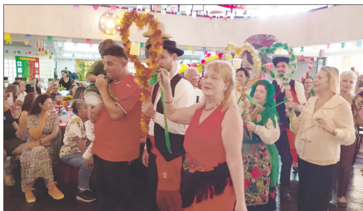
Tradicional desfile dos arcos com a participação do público presente