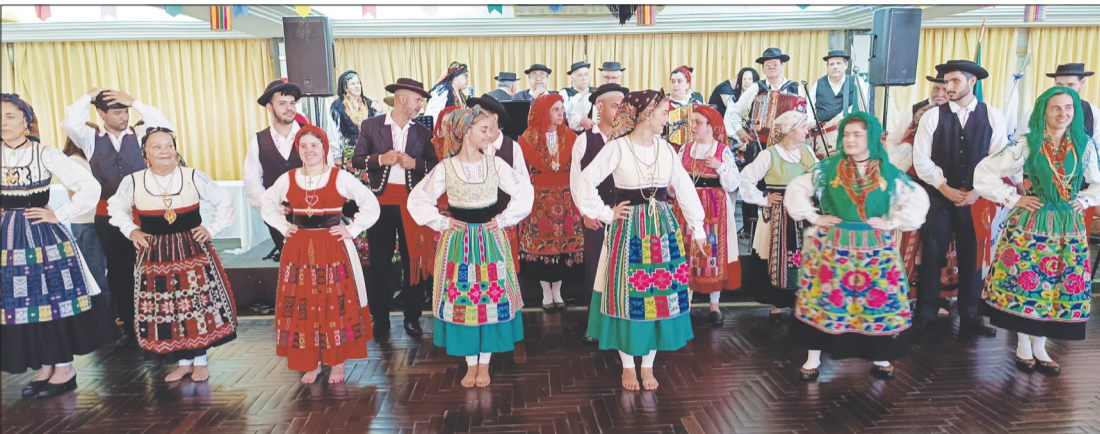
O R.F. Luís de Camões durante a Quinta de Santoinho dando um show de organização

É em Santoinho que se revive a cultura tradicional da vida do campo, com as músicas e danças folclóricas, na companhia dos petiscos à base de sardinhas assada, febras, frango, regados pelo Vinho do Pipo da região e culminando com o saboroso e aconchegante caldo verde. A decoração é pensada ao pormenor, onde as peças fazem brilhar a festa popular. Além das bandeirolas coloridas que circundam os palcos privilegiados do arraial, estão