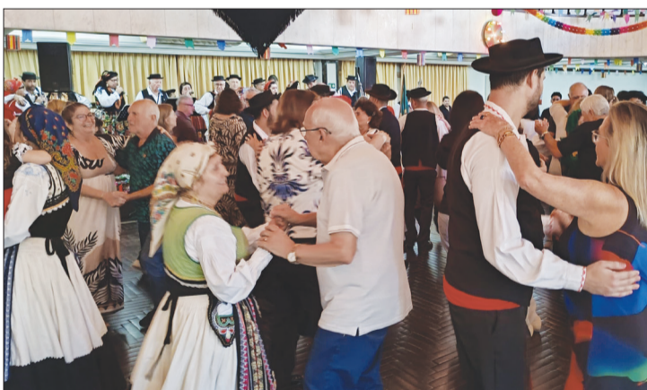
Visual maravilhoso do salão, com o público, dançando com os folcloristas