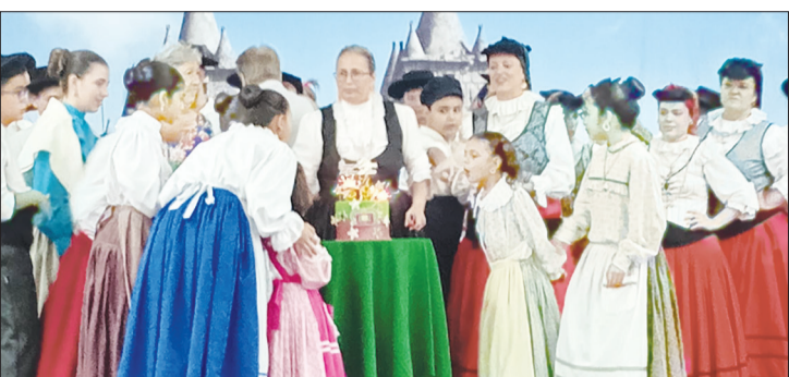
Diante do bolo festivo, os componentes do Rancho Folclórico Infantil juvenil Danças e Cantares das Terras da Feira celebraram com alegria mais um ano de vida, reforçando a união, a tradição e que marcam a trajetória deste querido grupo