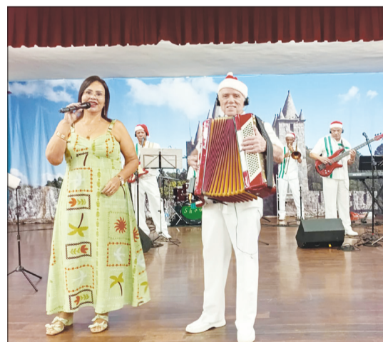
O conjunto musical Típicos das Beiras animou o Domingo Feirense em grande estilo