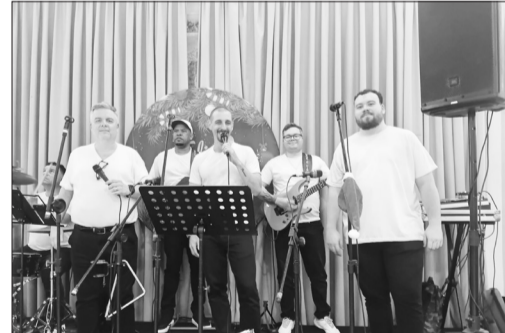
O conjunto Amigos do Alto Minho fechou o ano com chave de ouro, animando a confraternização natalina na Casa de Trás-de-Montes