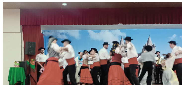
Infantil Juvenil Danças e Cantares das Terras da Feira em um momento maravilhoso, dançando junto com o Grupo Folclórico Almeida Garrett. Que show! Parabéns, turma