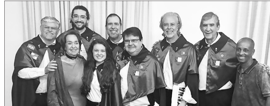
Belo registro dos integrantes da Tuna Açoriana, reunidos em uma linda imagem para o álbum de recordação do dia do lançamento