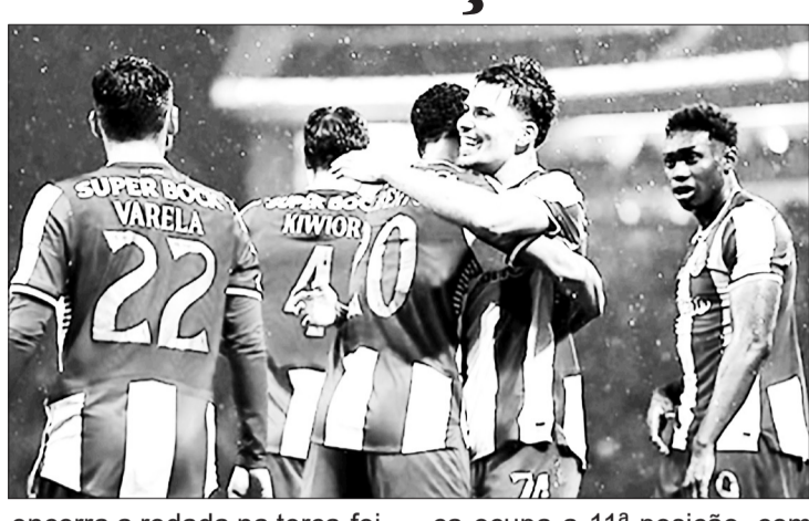
encerra a rodada na terça-feira, fora de casa, contra o Vitória de Guimarães. Já o Alverca ocupa a 11ª posição, com 17 pontos, os mesmos de Rio Ave (10ª) e Estoril Praia (9ª).