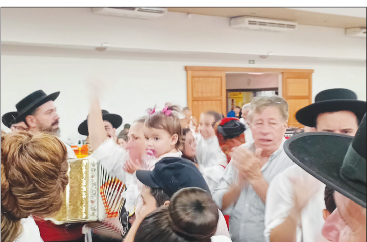
Momento final da apresentação, com os componentes da tocata reunidos, encerrando a festa em um grande e emocionante final de folclore português.