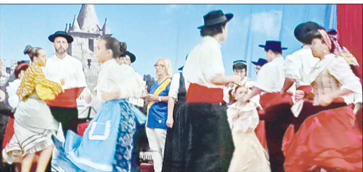
O Rancho Folclórico Infantil Juvenil Danças e Cantares das Terras da Feira dançou como gente grande! Parabéns, moçada! Inspirados pelo talento do Grupo Folclórico Almeida Garrett, mostraram todo o seu ritmo e carisma.