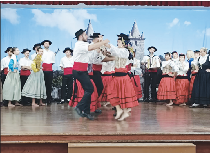
O Rancho Folclórico Almeida Garrett dançou para celebrar mais um ano de fundação dessa moçada que é o futuro do folclore da Casa da Vila da Feira, Terras de Santa Maria