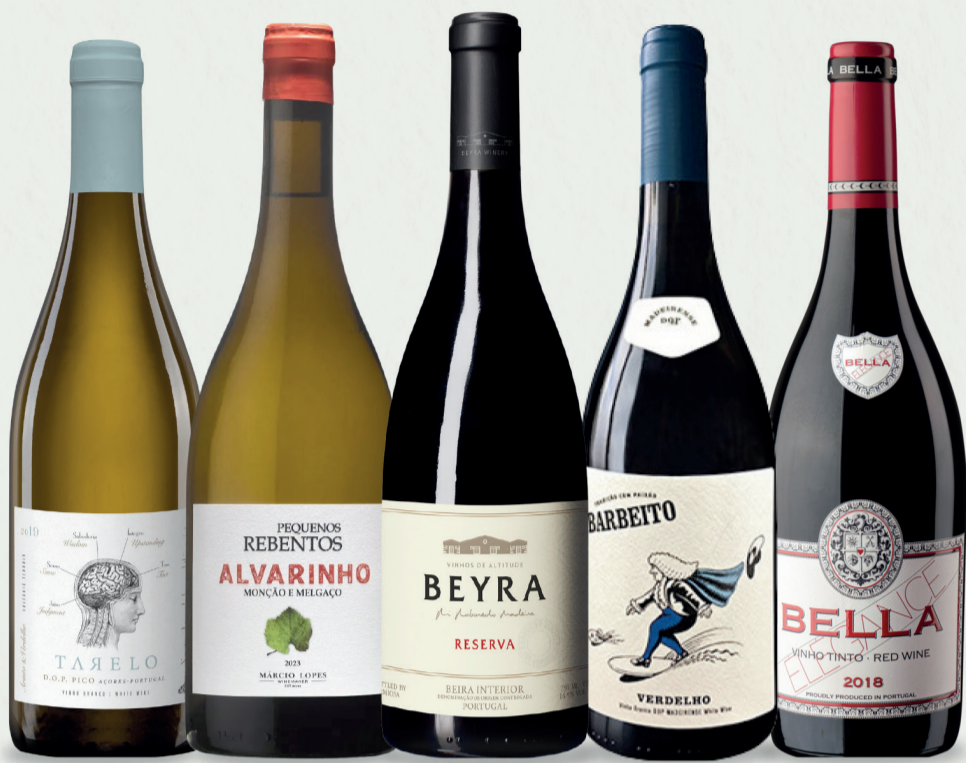
Tarelo Arinto & Verdelho 2019 Açores Pequenos Rebentos Alvarinho 2023 Minho Beyra Reserva 2022 Beira Interior Barbeito Verdelho Colheita 2021 Madeira Bella Elegance Touriga Nacional 2018 Dão

Tenha nossos vinhos em seu Restaurante e Empório