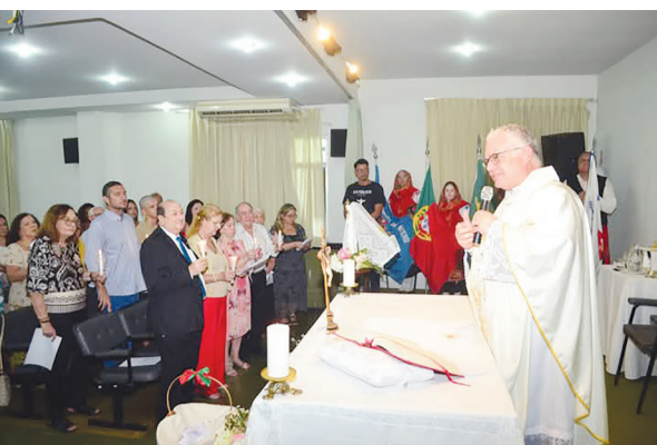
Panorâmica da missa em ação de graças de 65 de Fundação do Clube Português de Niterói