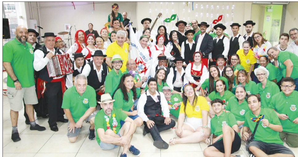
Confraternização entre os componentes do Grupo Folclórico Fausto Neves e Luís de Camões