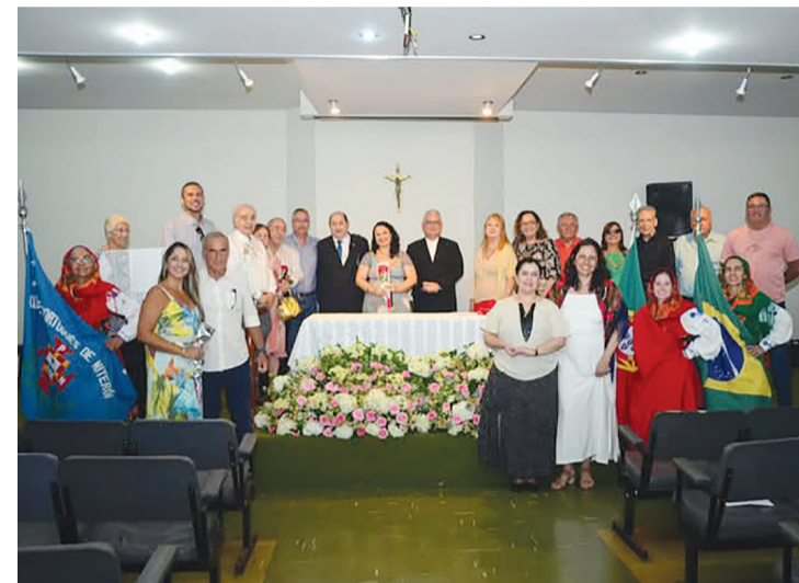
Logo a seguir a celebração vemos diretores e convidados reunidos numa linda foto de recordação