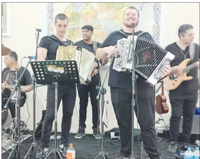
O Conjunto Amigos do Alto, marcou o ritmo musical, com um excelente repertório

Foi realizado no domingo passado, mas um almoço para festejar os aniversariantes do mês a diretoria transmontana como sempre dando um show de organização e simpatia com seus associados e amigos que prestigiam a casa. O cardápio transmontano da melhor qualidade com seu famoso churrasco completo mas Sardinha portu-