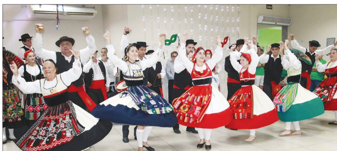
Muito charme elegância dos componente do . R.F Luis de Camões do Clube Português de Niterói, brilhando na sua apresentação que show