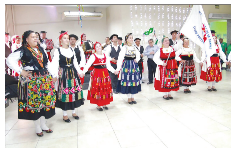
Belíssima apresentação do R.F Luis de Camões do Clube Português de Niterói