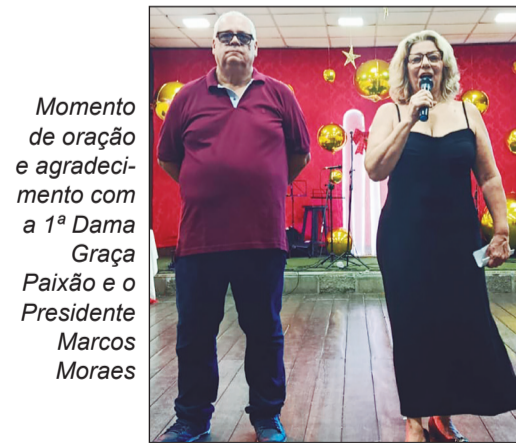
Momento de oração e agradecimento com a 1ª Dama Graça Paixão e o Presidente Marcos Moraes