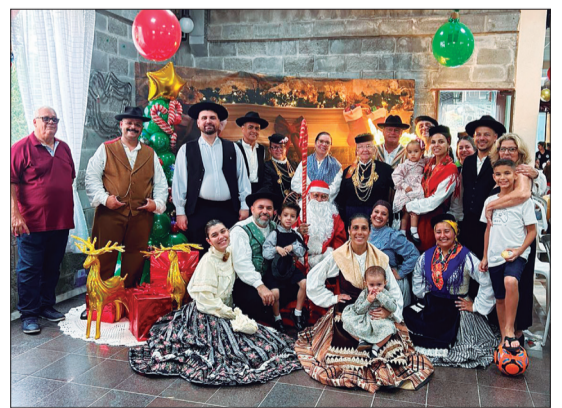
Bonita confraternização dos integrantes do Rancho Folclórico Camponeses de Portugal com a presença do Papai Noel!