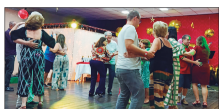
Ao som do Conjunto Viva Portugal, a magia musical deu ainda mais charme ao Natal nos Camponeses