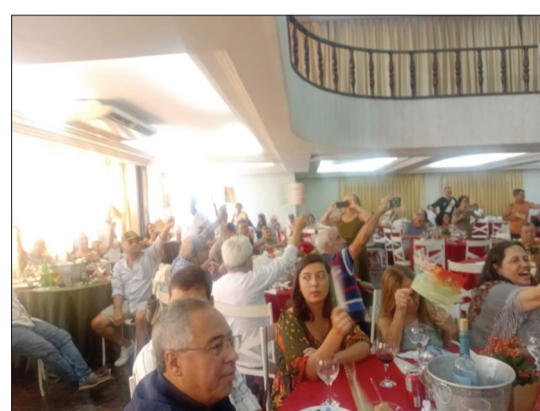
No momento do tradicional brinde, ao som da música Verde e Vinho, o cantor Mário Simões celebrou 60 anos de vida artística com amigos e fãs presentes no CPN.