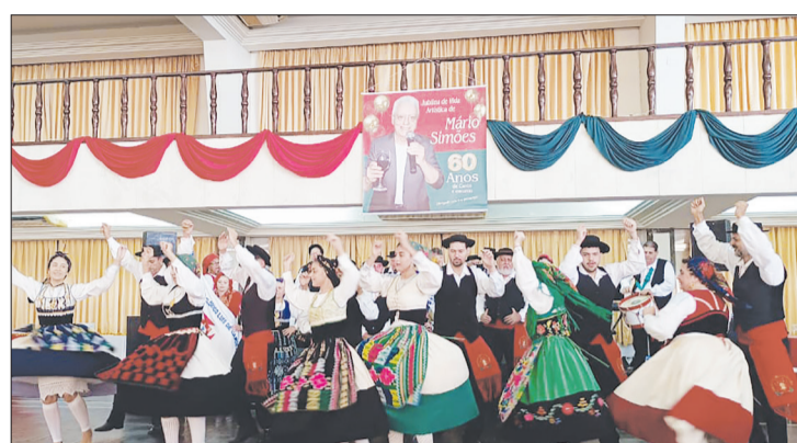
O Rancho Folclórico Luís de Camões brilhou na Festa da Castanha, no Clube Português de Niterói, no Ingá.

dadeiro espetáculo à parte. O churrasco completo conquistou os paladares mais exigentes e o já consagrado arroz de camarão confirmou seu prestígio, sendo um dos grandes destaques do cardápio e arrancando elogios de todos os presentes. Cada detalhe revelou cuidado, sabor e excelência, tornando a experiência gastronômica ainda mais especial. A programação cultural encantou