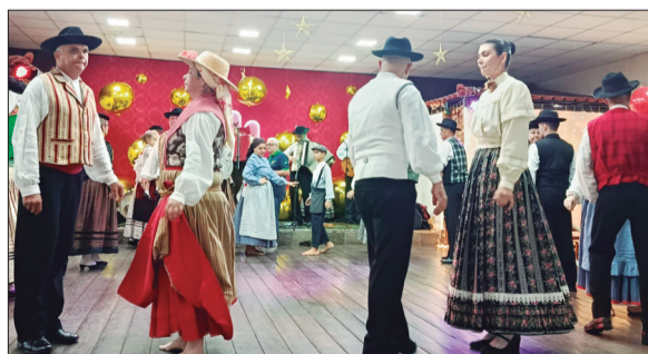
O Rancho Folclórico Camponeses de Portugal sempre dando seu show particular, encantando a todos no Natal Luz!