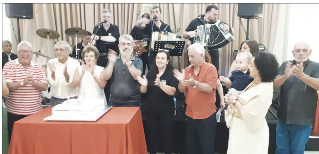
O tradicional momento dos parabéns na almoxaria acontece sempre antes do início do mês, reunindo todos os aniversariantes, amigos e familiares diante do bolo comemorativo. Um instante repleto de alegria, sorrisos e confraternização, celebrando juntos mais um ano de vida.

S ucesso absoluto! O almoço dos aniversariantes do mês de dezembro aconteceu na Casa de Trás-os-Montes e Alto Douro, um espaço acolhedor, cheio de charme, tradição e história, que mais uma vez recebeu todos com calorosa hospitalidade. A gastronomia impecável encantou a todos: churrasco completo, pernil assado, batatas cozidas, sardinha portuguesa e uma grande variedade de saladas frescas e deliciosas, preparadas com todo o cuidado e dedicação, que fizeram a alegria de cada convidado. O excelente conjunto Amigos