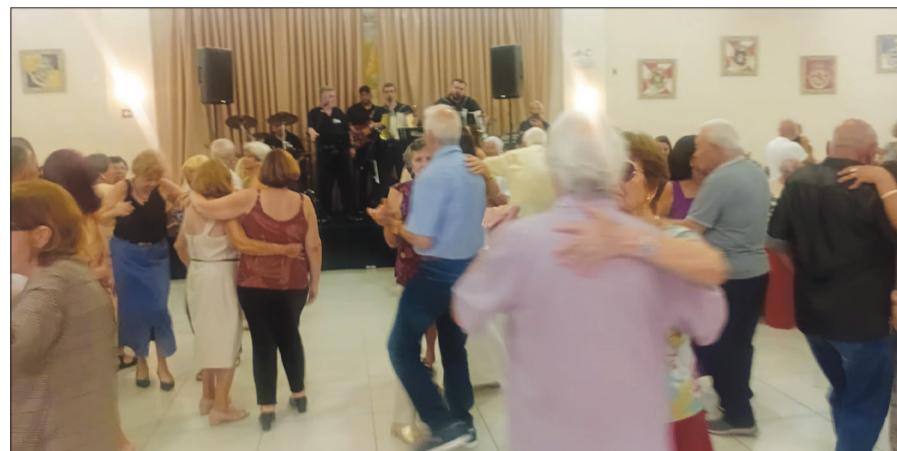
Panorâmica do tradicional almoço na Casa de Trás-os-Montes, onde os presentes aproveitam para curtir e desfrutar de momentos agradáveis

O Conjunto Amigos do Alto Minho, mais uma vez, agitou o convívio social em Trás-os-Montes, deixando a pista de dança belíssima, com os pés de valsa curtindo e dançando pra valer