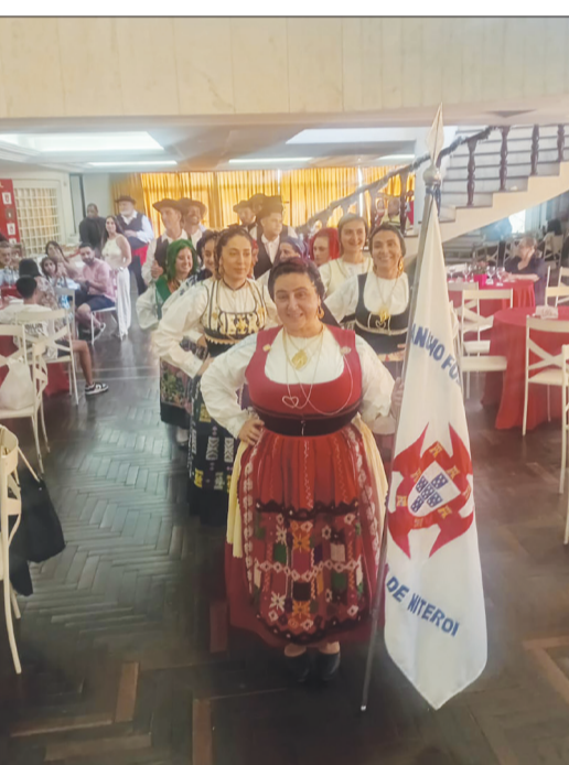
Entrada espetacular dos componentes do Rancho Folclórico Luís de Camões para mais uma linda apresentação.