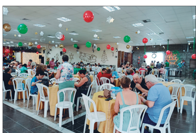
Mágica que ilumina corações Natal Luz começa nos Camponeses com alegria, luzes e encanto para toda a família

O Natal Luz nos Camponeses não foi apenas um evento gastronômico e musical, mas também um momento de união, confraternização e celebração do espírito natalino, fortalecendo os laços da comunidade e proporcionando lembranças inesquecíveis para crianças, adultos e idosos.