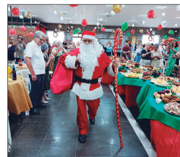
A chegada do Papai Noel aos Camponeses de Portugal emociona e encanta as crianças