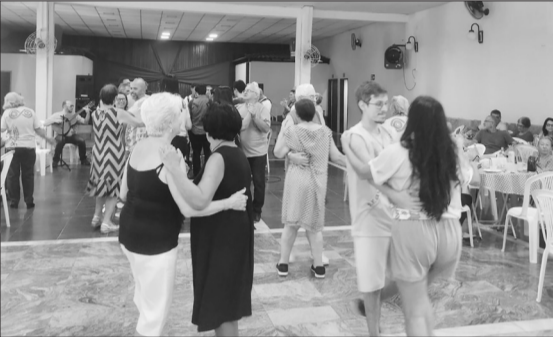
A pista de dança esteve bem movimentada, com os famosos pés de valsa dando show