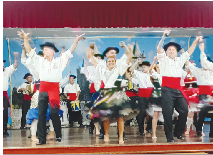
Imagem fantástica do Rancho Almeida Garrett, nesta tarde dedomingo no Castelo da Feira