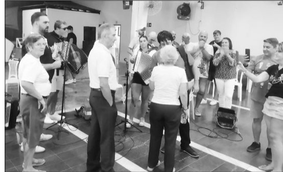
O público presente fazia questão de ficar bem pertinho dos Sanfoneiros, para apreciar as canções