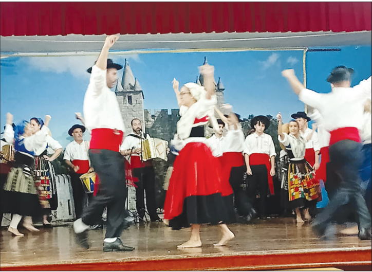
Apresentação de gala do Rancho Folclórico Almeida Garrett que show dos seus componentes