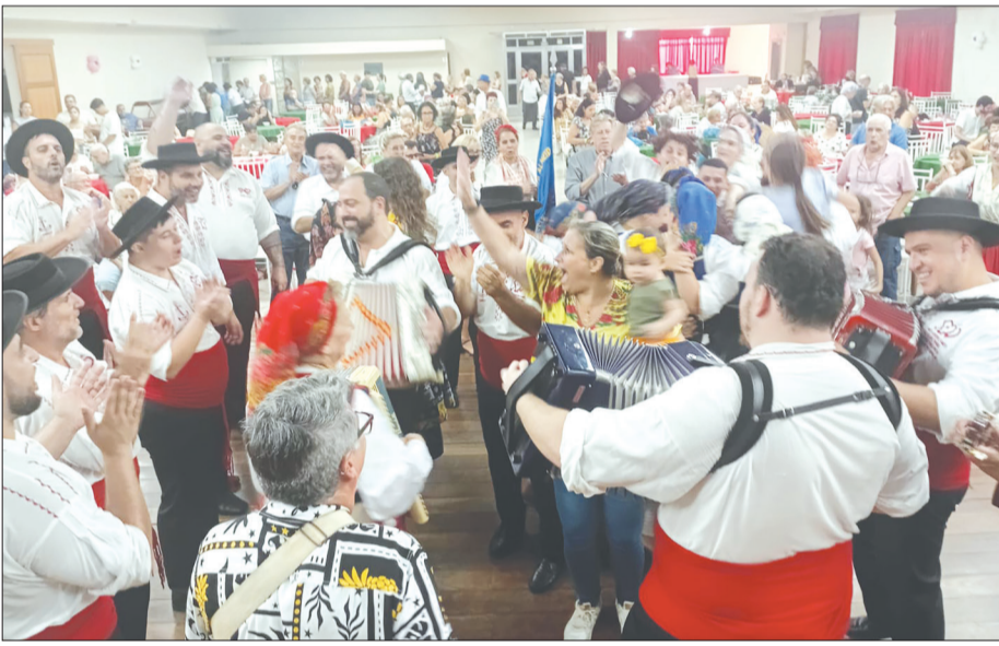
Panorâmica do Arraial Feirense Quinta do Castelo, numa explosão de alegria onde a Tocata não deixou ninguém ficar parado.