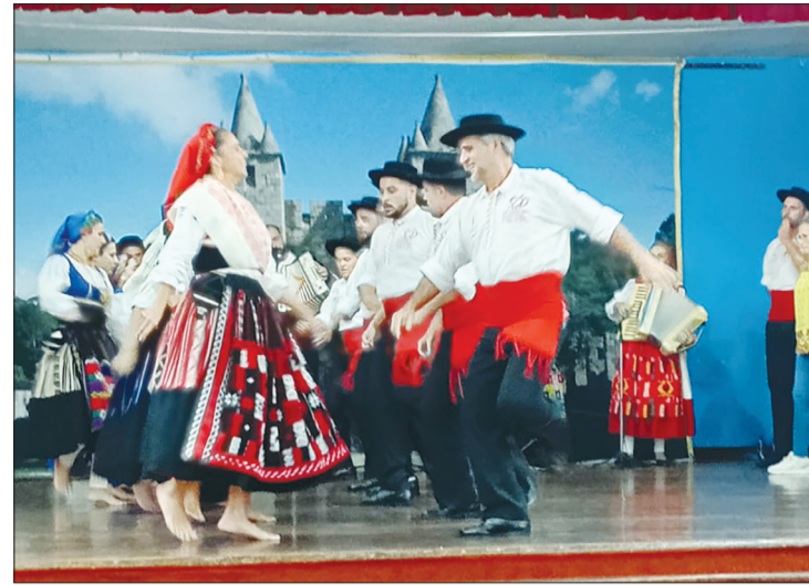
Que espetáculo foi o Arraial Feirense -Quinta do Castelo, simplesmente uma tarde maravilhosa