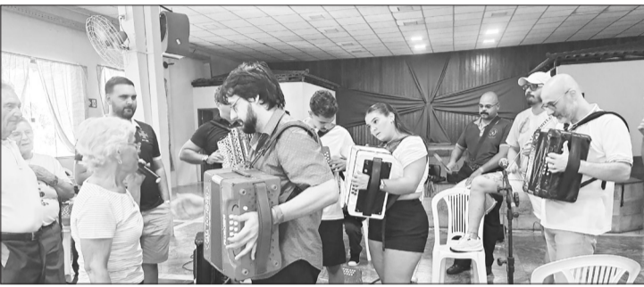
A moçada mandou ver com as suas sanfonas agitando o domingo nos Camponeses de Portugal