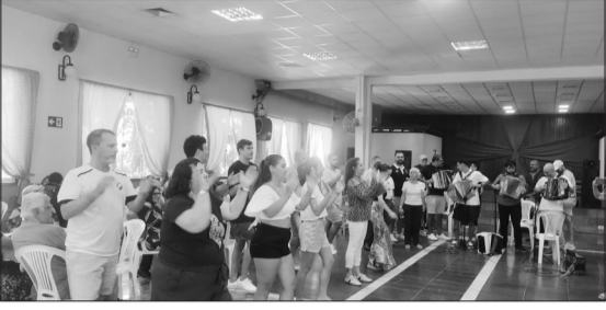
Muita música boa marcando o ritmo da segunda Sanfonada com o público presente agitando o salão