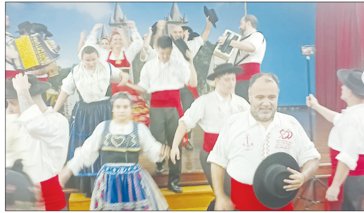
Saída do palco triunfal em, mas um show de Folclore Rancho Folclórico Almeida Garrett

giou em peso. Uma tarde de muitos encontros entre amigos que foram desfrutar do delicioso cardápio e do maravilhoso show de folclore do Rancho Almeida Garrett. Que apresentação espetacular dessa rapaziada! Temos que bater palmas para diretoria da Casa da Vila da Feira que prestigiam a nossa juventude. Sem dúvida um grande dia este domingo no Castelo da Feira. Que