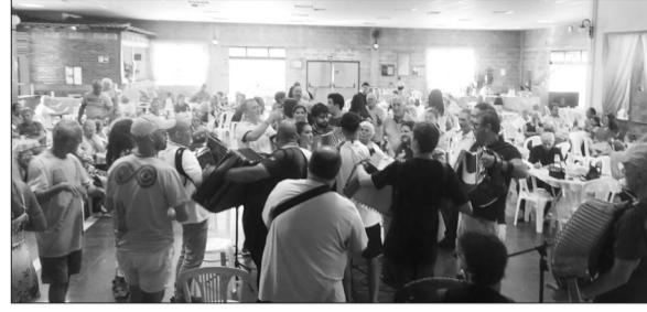
Panorâmica da Segunda Sanfonada sucesso absoluto a rapaziada botou para quebrar