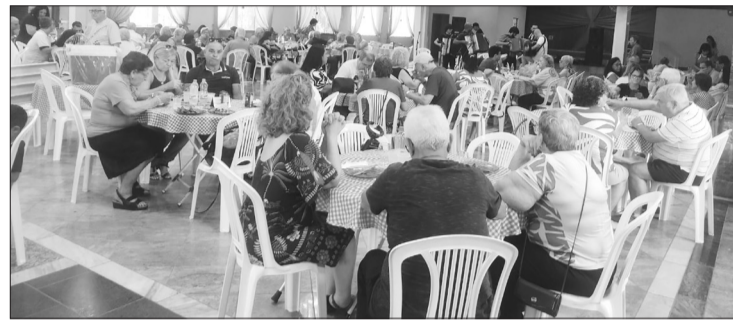
A comunidade portuguesa de Duque de Caxias e adjacências, prestigiou em peso o convívio nos Camponeses