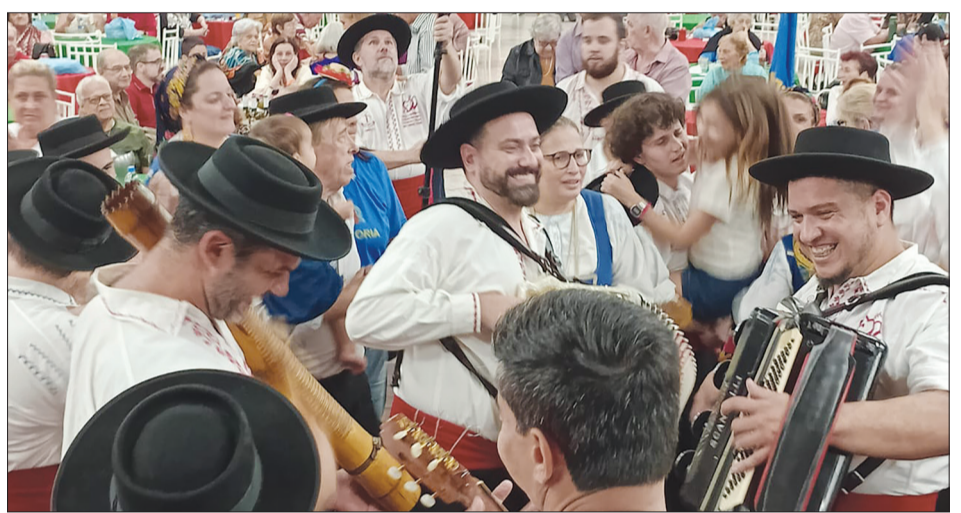
Uma verdadeira apoteose no Castelo da Vila da Feira, a apresentação do G.F. Almeida Garrett e sua tocata espetacular