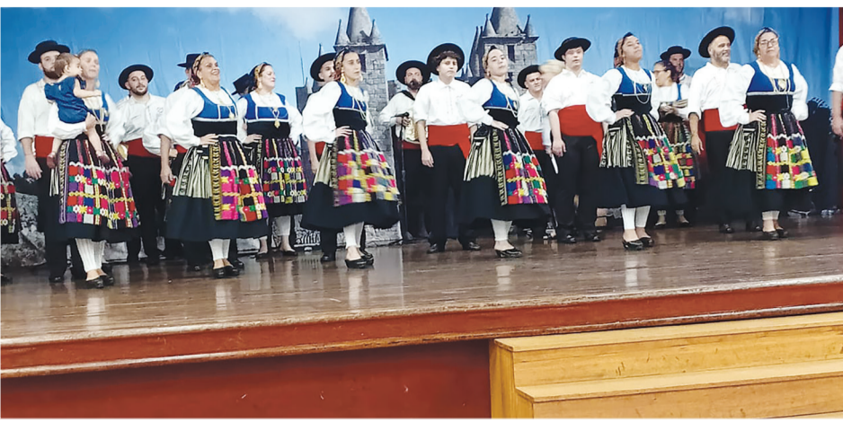
A moçada não brincou e deu, verdadeiro espetáculo de folclore