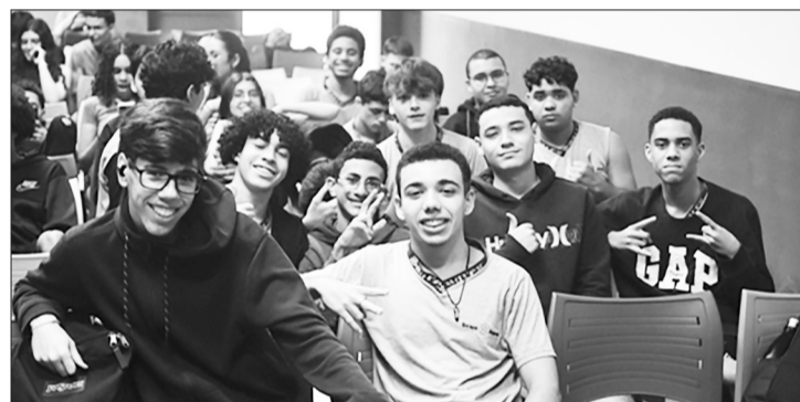
Estudantes do Ensino Médio na aula sobre o Luís Vaz de Camões