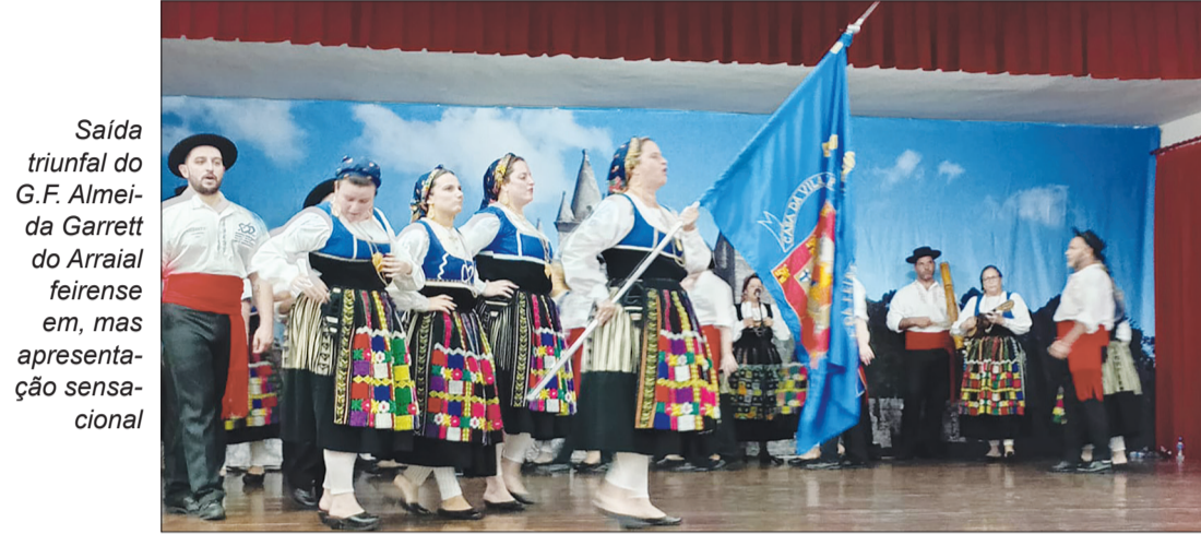
Saída triunfal do G.F. Almeida Garrett do Arraial feirense em, mas apresentação sensacional