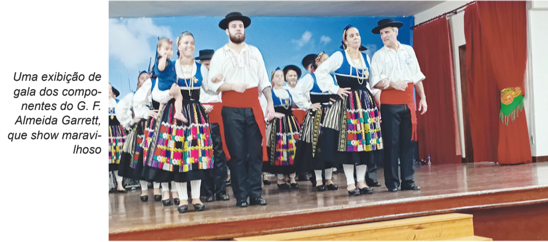
Uma exibição de gala dos componentes do G. F. Almeida Garrett, que show maravilhoso