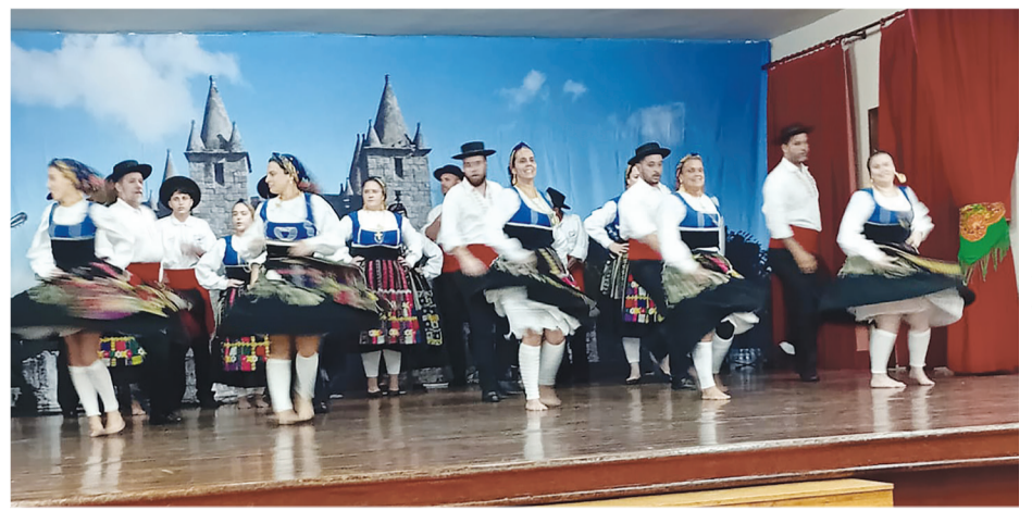
Uma verdadeira apoteose no Castelo da Vila da Feira, a apresentação do G.F. Almeida Garrett