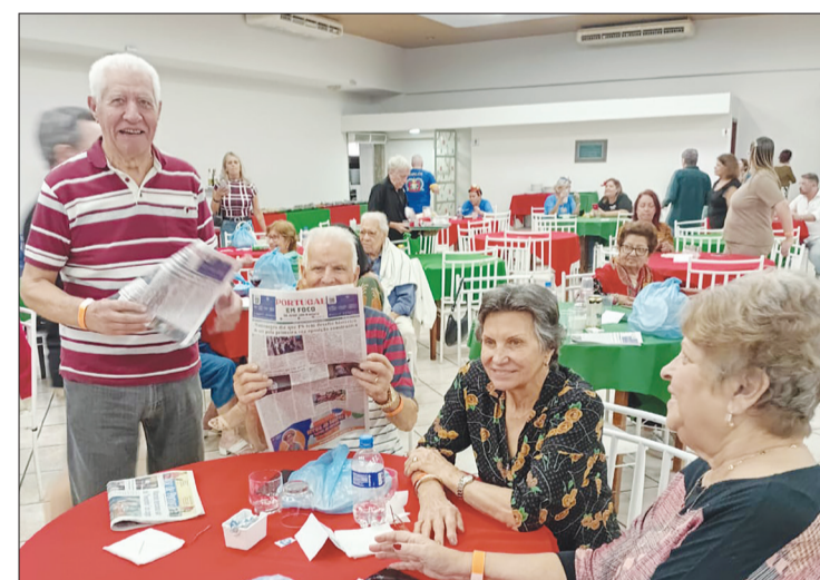
Presente no Castelo da Feira, diversas famílias que prestigiam o Jornal Portugal em Foco