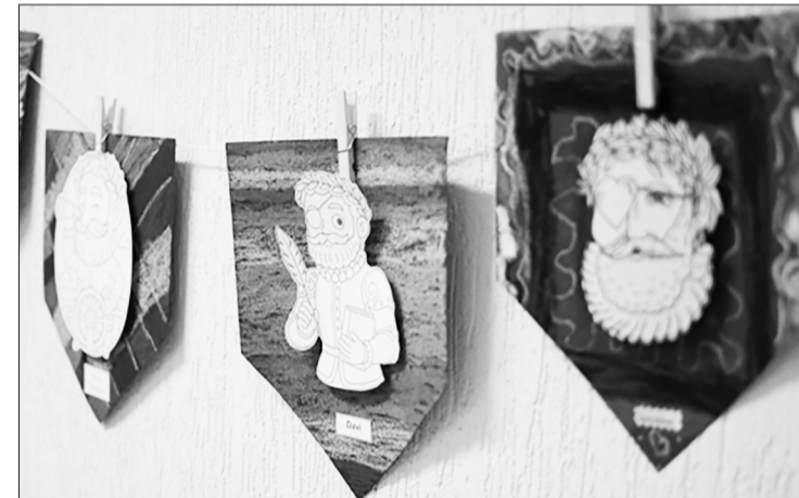
Varal de Camões feito por estudantes do Ensino Fundamental I (Anos Iniciais).