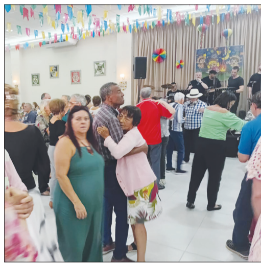
Panorâmica do salão social com os pés de valsa dando show na pista de dança