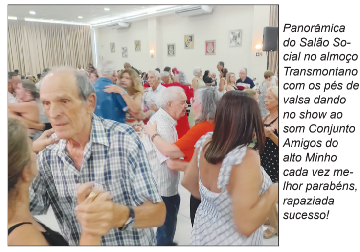
Panorâmica do Salão Social no almoço Transmontano com os pés de valsa dando no show ao som Conjunto Amigos do alto Minho cada vez melhor parabéns, rapaziada sucesso!