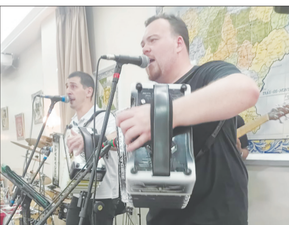
Mas uma atuação espetacular do Conjunto Amigos do Minho, cada show com muita música boa e qualidade, rumo ao sucesso!