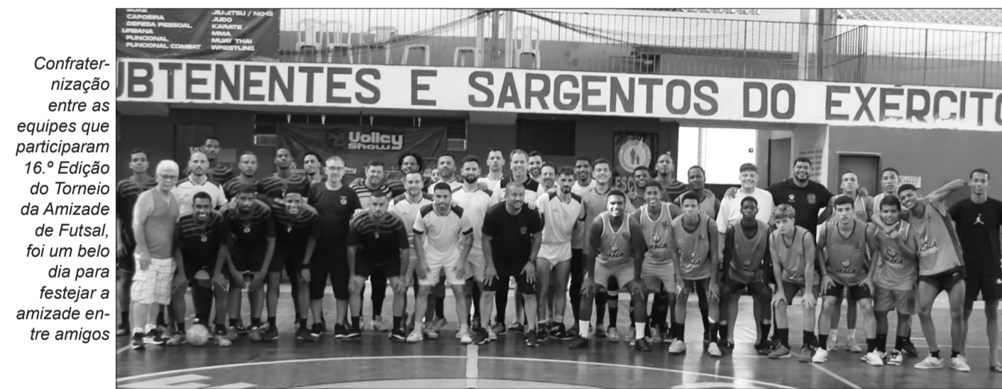
Confraternização entre as equipes que participaram 16.º Edição do Torneio da Amizade de Futsal, foi um belo dia para festejar a amizade entre amigos

Janeiro. Participaram os equipes da TAP Portugal, Magé e Casa do Benfica do Rio de Janeiro. Resultados das partidas, primeiro jogo o placar foi Magé 3x1 TAP. Segundo jogo Magé 1x3 Casa do Benfica e o encerrando, o 16.º Edição do Torneio da Amizade de Futebol de Salão, Tap-Portugal 8x3 Casa do Benfica, pelo saldo de gols a equipe