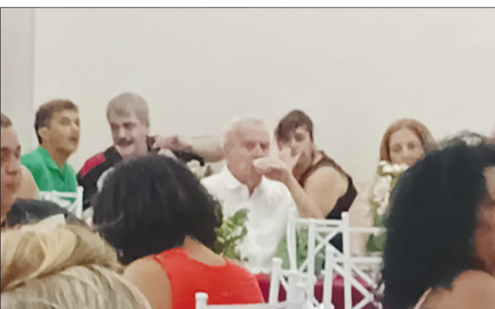
Durante o almoço transmontano vemos o presidente Ismael Loureiro. Esposa primeira dama Sineide junto aos amigos e convidados