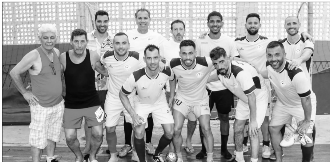
Já e uma tradição o equipe de Futsal da Tap Portugal todos os anos vieram ao Rio participar do evento

Janeiro. Participaram os equipes da TAP Portugal, Magé e Casa do Benfica do Rio de Janeiro. Resultados das partidas, primeiro jogo o placar foi Magé 3x1 TAP. Segundo jogo Magé 1x3 Casa do Benfica e o encerrando, o 16.º Edição do Torneio da Amizade de Futebol de Salão, Tap-Portugal 8x3 Casa do Benfica, pelo saldo de gols a equipe