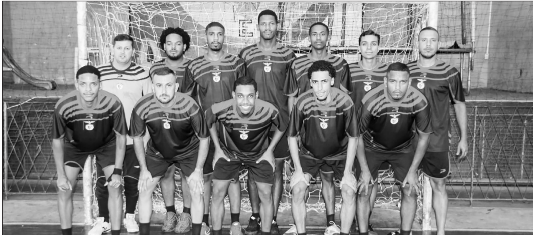
A equipe de Futsal da Casa do Benfica, Perfilada no registro durante o Torneio

Foi realizado no último dia 22 de fevereiro, o 16.º Edição do Torneio da Amizade de Futsal. Que já virou uma tradição todos os anos, a turma se reunir para este tradicional evento que foi realizado nas dependências do Clube de Subtenentes e Sargentos do Exército no Bairro do (Rocha) no Rio de