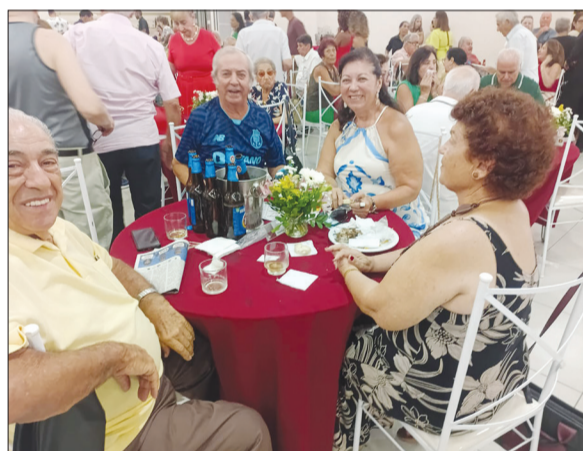
Um verdadeiro festival de encontro de amigos, já em clima de carnaval para curtir o almoço transmontano