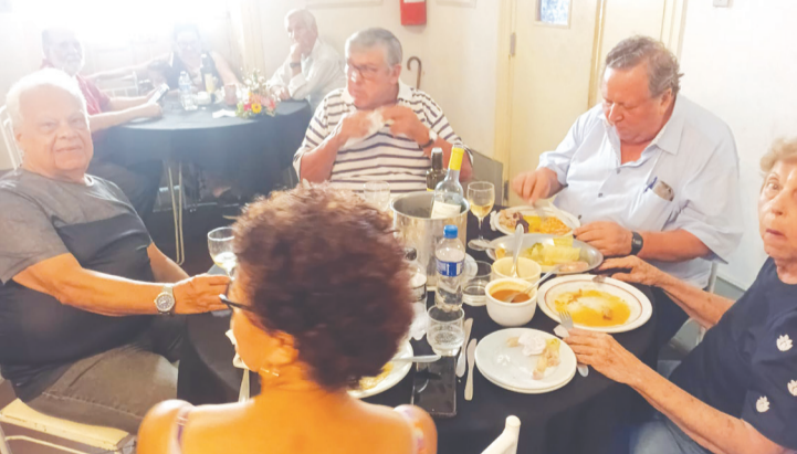
Grupo de amigos que foram saborear a deliciosa gastronomia da Casa da Vila da Feira e curtir a Tarde de Fados