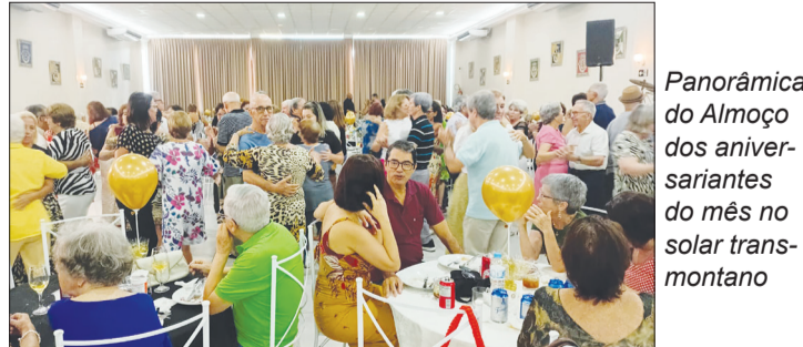
Panorâmica do Almoço dos aniversariantes do mês no solar transmontano