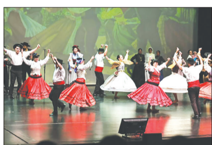
Sem duvida uma apresentação do G.F Almeida Garrett, que vai ficar marcada na história simplesmente fantástica