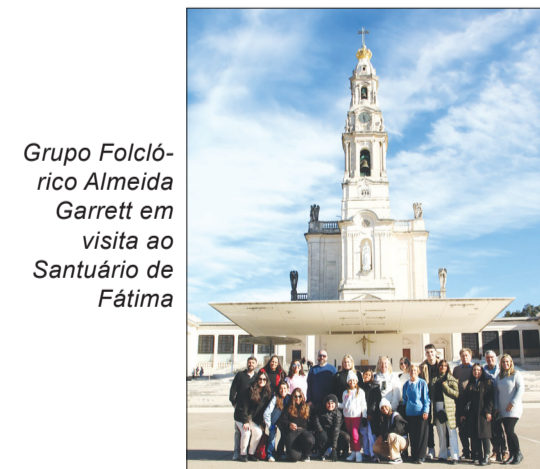
Grupo Folclórico Almeida Garrett em visita ao Santuário de Fátima