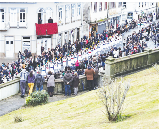
Linda imagem procissão da Festa das Fogaceiras em Santa Maria da Feira