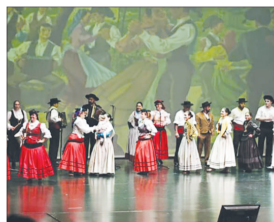
Apresentação do Grupo Folclórico Almeida Garrett no Europarque no encerramento da Festa das Fogaceiras