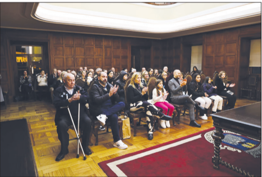
Panorâmica da solenidade festiva na Câmara de Santa Maria da Feira