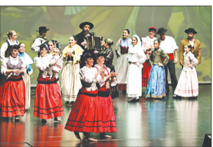
Que apresentação maravilhosa dos componentes do G.F Almeida Garrett, brilhando nas Terras da Feira