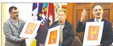
Foi um dia de muitas homenagens, na foto na recepção na Câmara Municipal de Santa Maria da Feira as comunidades Feirense do Brasil, Venezuela e África do Sul