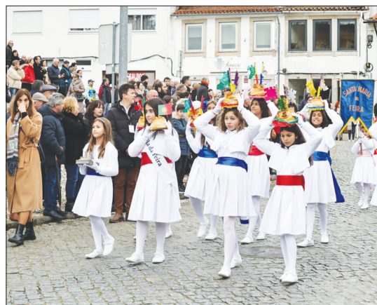
Belíssima foto das crianças conduzindo as Fogaceiras na cabeça lindo, durante a procissão