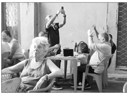
Panorâmica da Aldeia portuguesa do Cadeg, diversas famílias portuguesas e luso-brasileiras, matando a saudades de Portugal