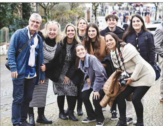
A turma transbordando de felicidade durante os passeios em Portugal