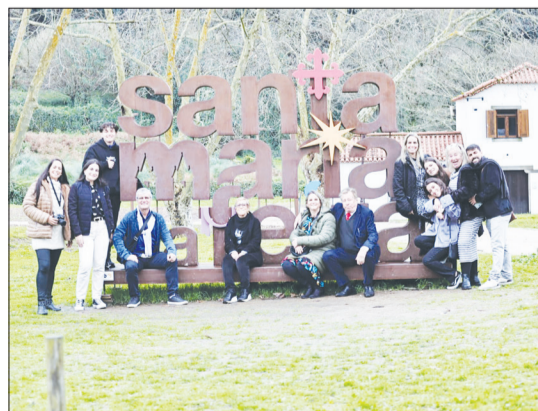
Outra bela recordação da turma reunida em de Santa Maria Feira