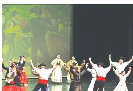
Foi com certeza um dia inesquecível, para os componentes do G.F Almeida Garrett