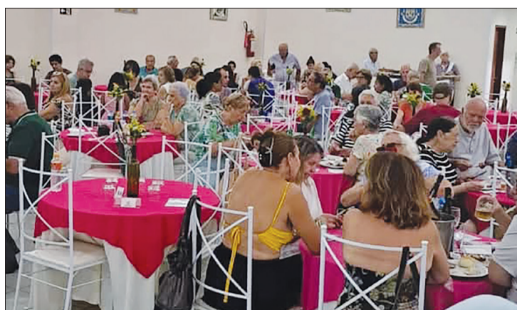
Panorâmica do salão totalmente lotado