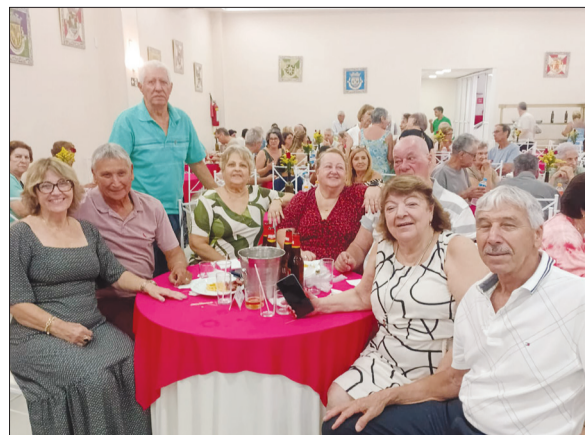
Diversas famílias portuguesas foram prestigiar a apresentação do Rancho Poveiro