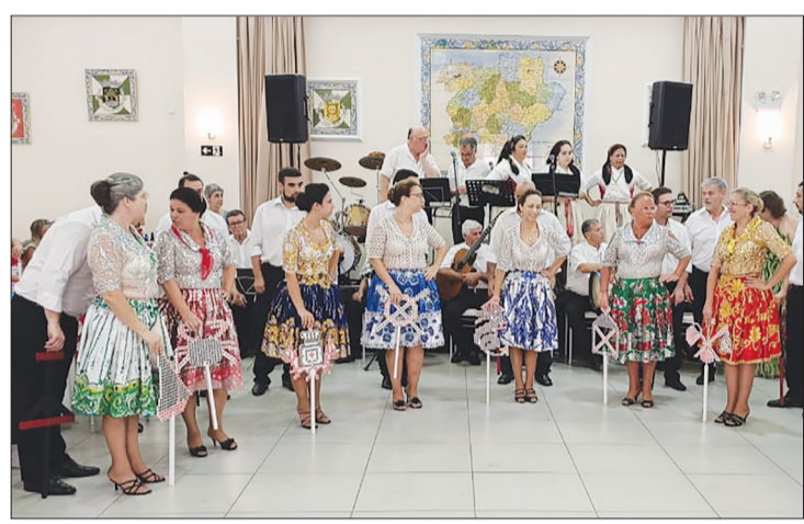
Simplesmente fantástico apresentação do Rancho Poveiro no solar transmontano