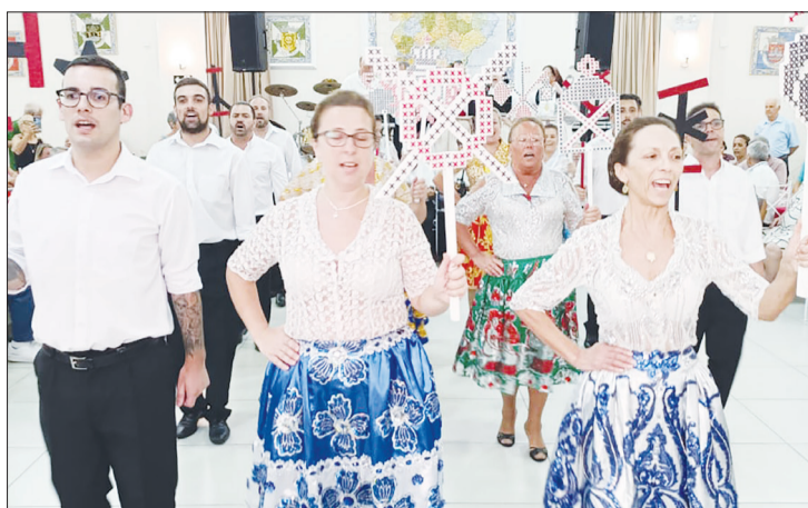
Magistral apresentação do Rancho Poveiro, dando lindo show de Folclore