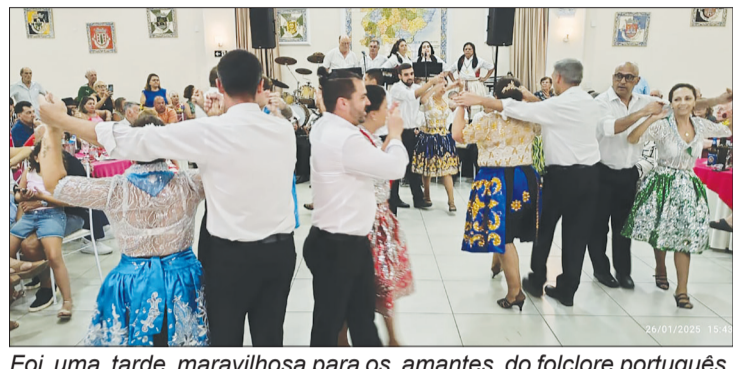
Foi uma tarde maravilhosa para os amantes do folclore português, muito lindo o Rancho Poveiro

tores do Rancho Poveiro, agradeceu pela belíssima apresentação que realizaram neste domingo mágico na Casa de Trás-os-Montes, quer recebeu um bom número de associados e amigos. Ao final do evento o tradicional parabéns diante do bolo comemorativo oferecido pela casa enfim mas um Domingo maravilhoso nesta querida casa da rua Melo Matos na Tijuca