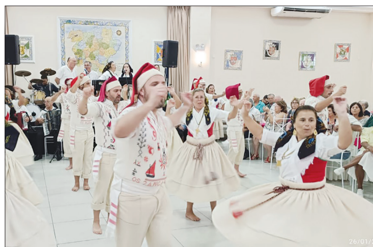
Que espetáculo maravilhoso, realizado pelo Rancho Poveiro