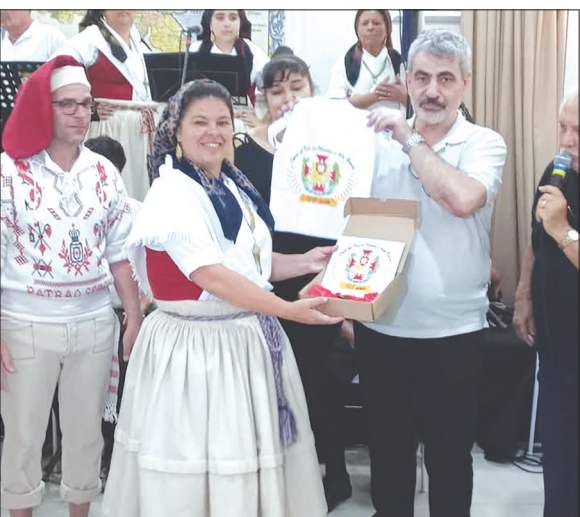
Presidente da Casa de Trás-os-Montes, entregando uma um galhadete da casa a um componente do Rancho Poveiro