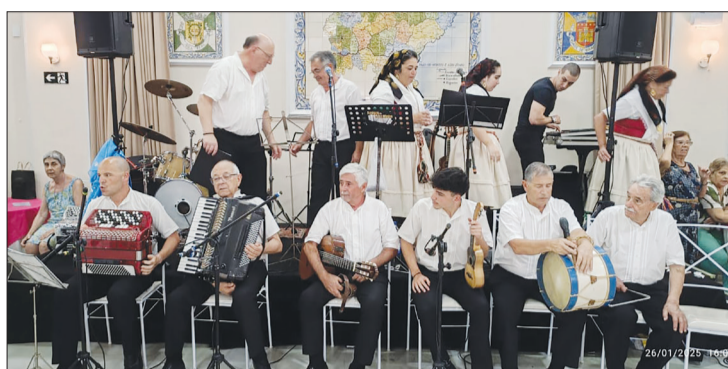
A tocata do Rancho Poveiro, muito boa muito ritmo, charme