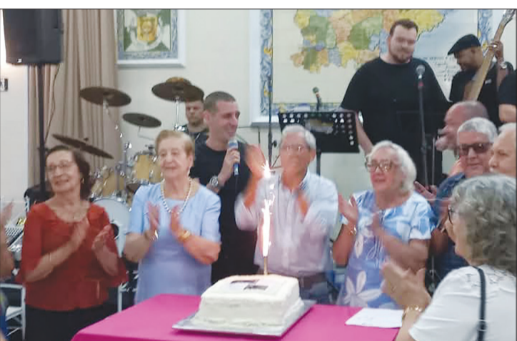
O momento do tradicional parabéns em homenagem aos aniversariantes do mês de janeiro