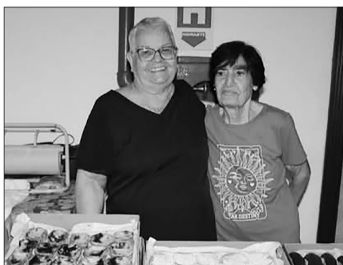
Você quando estiver na Casa do Minho Não deixei de saborear os deliciosos doces Portugueses das nossas amigas que fazem questão oferecer um docinho para a nossa equipe