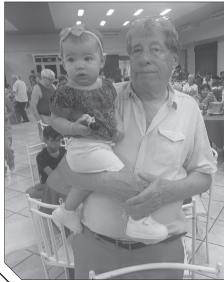
Foto Destaque no domingo Passado, na Quinta do Castelo Feirense