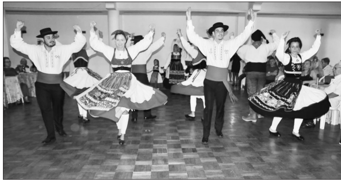
Apresentação magistral do R.F Maria da Fonte no domingo Minhoto