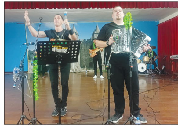
Conjunto Amigos do Alto Minho mando ver no Castelo da Feira, agradando em cheio ao Público presente com um belo repertório