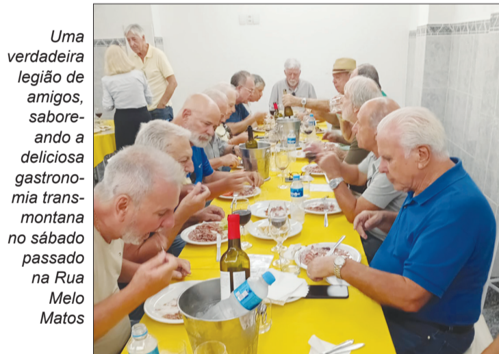
Uma verdadeira legião de amigos, saboreando a deliciosa gastronomia transmontana no sábado passado na Rua Melo Matos