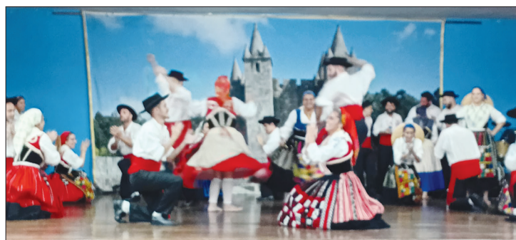
Que maravilhosa atuação foi a do Grupo Folclórico Almeida Garrett, na Casa da Vila da Feira e Terras de Santa Maria