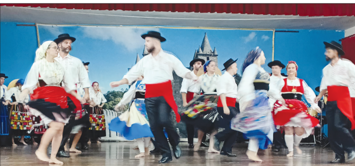
Uma primorosa apresentação do Grupo Folclórico Almeida Garrett no Arraial Feirense