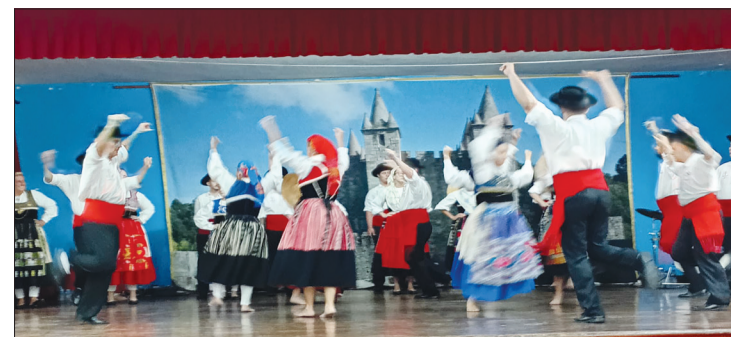
Cada apresentação do G. F. Almeida Garrett e um verdadeiro show de danças e cantares