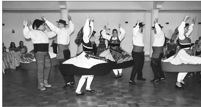
Essa moçada do R.F Maria da Fonte, brinca de dançar folclore que espetáculo