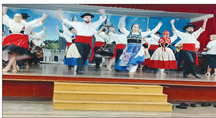
Mas um lindo espetáculo de Folclore do G. F. Almeida Garrett, agitando a Quinta do Castelo

Dia de festa no Castelo Feira, apesar da temperatura alta a comunidade portuguesa, esteve em peso, marcando presença para saborear a gastronomia feirense, num cardápio típico com sardinha portuguesa, frango assado, batata cozidas e fritas, e um succulento caldo verde, regados por aquela cervejinha bem gelada e vinhos portugueses; enfim, uma tarde perfeita para os amantes do Folclore Português. Como