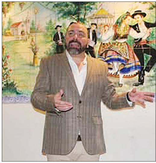
O cantor Camilo Leitão movimentou o Restaurante Costa Verde da Casa do Minho, com muita música boa e um maravilhoso repertório