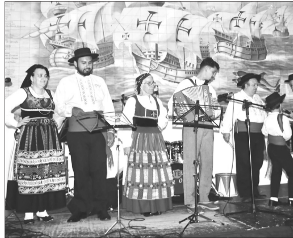
A tocata do R.F. Maria da Fonte sempre e um, atração á parte marcando o ritmo das apresentações