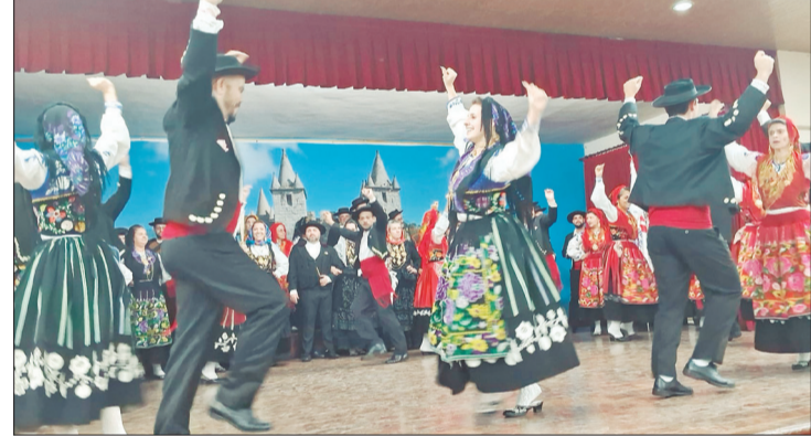
O Rancho Folclórico Maria da Fonte da Casa do Minho brilhou no festival