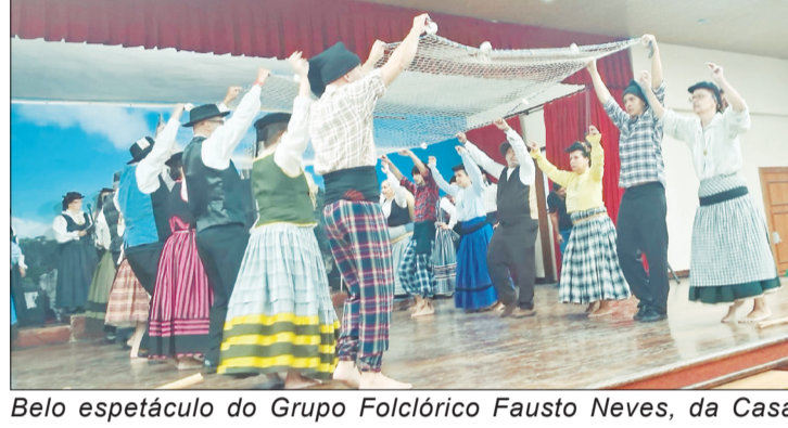
Belo espetáculo do Grupo Folclórico Fausto Neves, da Casa de Espinho

Neves, R.F. Eça de Queiroz, R.F. Camponeses de Portugal, R.F. Casa de Viseu, G.F. Guerra Junqueiro.