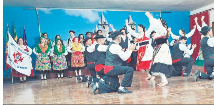
O R. F. Luís de Camões, mostrou mais uma vez toda sua categoria