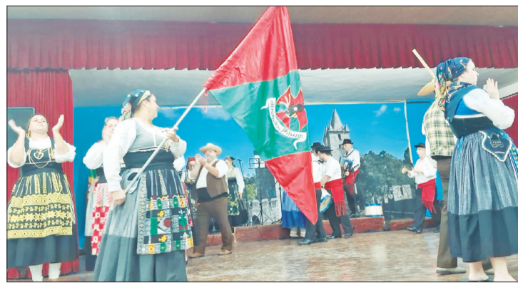
Grupo. Folclórico Serões das Aldeias sempre brilhante, encantando o público