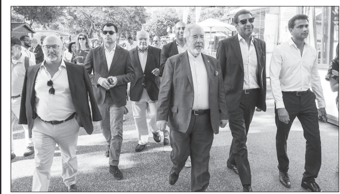
As Festas de Oeiras 2024 tiveram início ontem, dia 31 de maio, no Jardim Municipal de Oeiras