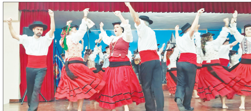
Mais um lindo Show, do Grupo. Folclórico. Almeida Garrett da Casa da Vila da Feira e terras de Santa Maria