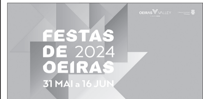
O mês de junho está à porta e com ele chegam as tão esperadas Festas de Oeiras

Entre 31 de maio e 16 de junho, Oeiras está em festa. Reconhecidas pelo seu cartaz atrativo, as Festas de Oeiras prometem bons momentos para passar em família ou entre amigos.