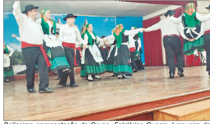
Bellissima apresentação do Grupo. Folclórico Guerra Junqueira da Casa de Trás-os-Montes