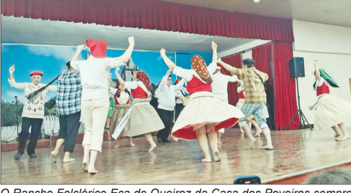
O Rancho Folclórico Eça de Queiroz da Casa dos Poveiros sempre uma atração a parte