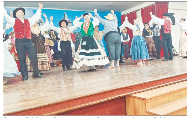
Rancho Folclórico Camponeses de Portugal deu show de Folclore