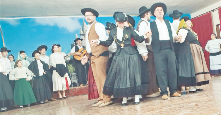
O Rancho Folclórico da Casa de Viseu blindou o público com uma linda apresentação