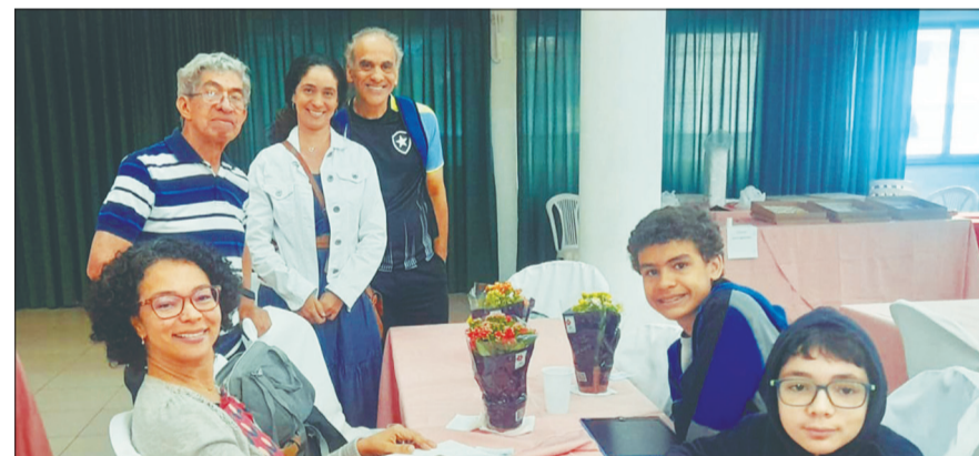
A família Minhota comemorou, com grande alegria, o Dia das Mães

em uma confraternização, acompanhada de presentes e calorosos abraços. Era tudo o que a Diretoria queria. O cardápio e a música com o som do Conjunto musical Fabio