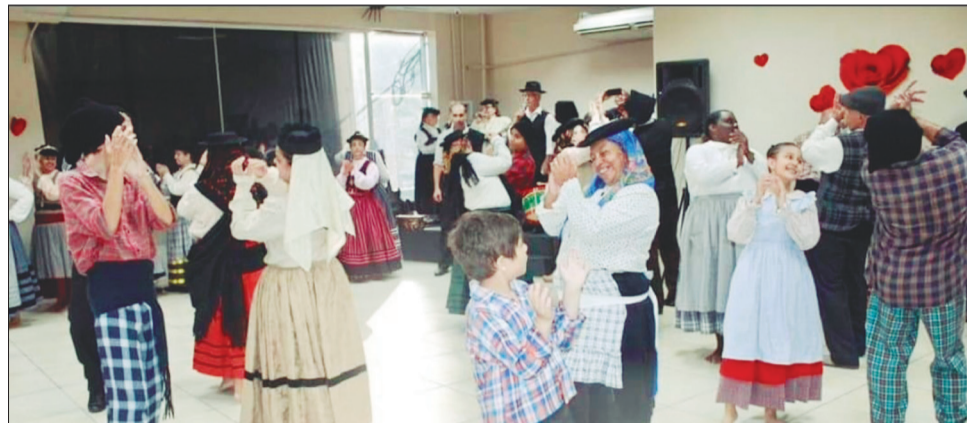
Maravilhosa apresentação das crianças do Rancho com suas mães nesse almoço festivo