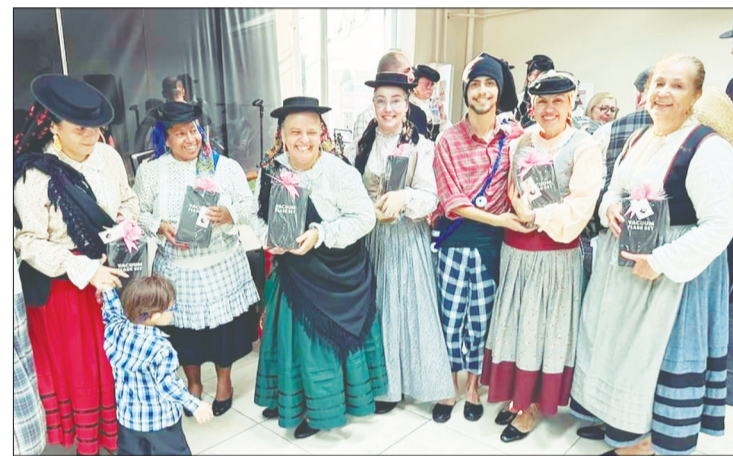
Todas as mamães componentes do Folclórico Fausto Neves também foram agraciadas com presentes, uma singela homenagem da diretoria Espinhense