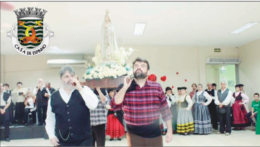
Foi realizada uma pequena homenagem à Nossa Senhora de Fátima com procissão e cânticos