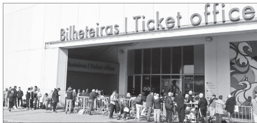
Mais de dez pessoas foram constituídas arguidas

Operação de "grande envergadura nos concelhos do Porto, de Vila Nova de Gaia e de Matosinhos", levada a cabo pela Divisão de Investigação Criminal da PSP do Porto e executada com o apoio operacional de várias valências da PSP, incluindo a Unidade Especial de Polícia (UEP), foi ordenada pelas entidades competentes – Ministério Público e Juiz