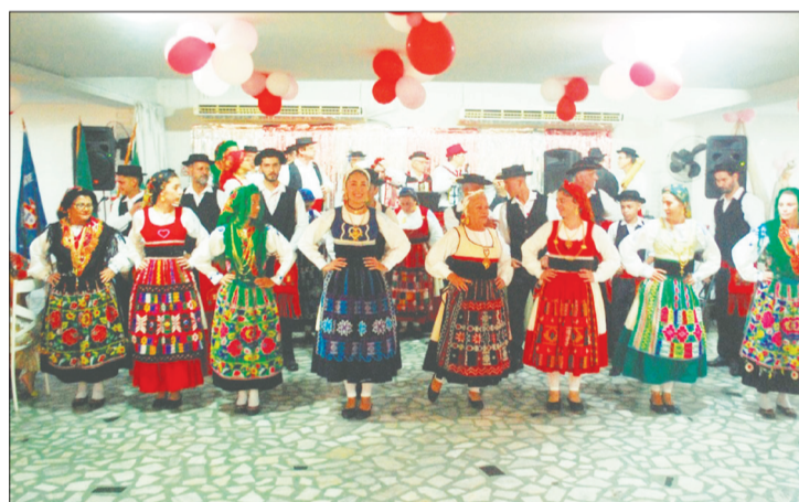
Apresentação espetacular do Rancho Folclórico Luís de Camões na festa em homenagem a toda as mães