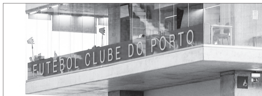
Treze pessoas foram constituídas arguidas

Quatro mil bilhetes de jogos do FC Porto e 44.510 euros foram apreendidos no âmbito da operação Bilhete Dourado, operação que investiga um esquema de venda ilegal de ingressos para partidas dos dragões e que já resultou na constituição de 13 arguidos.