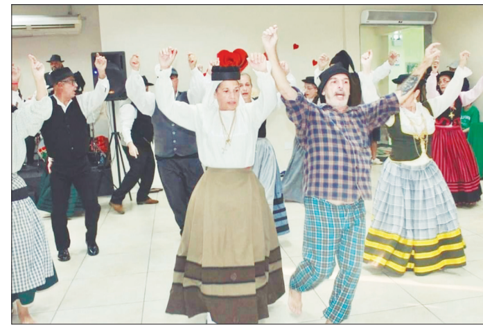
Um lindo show de folclore ficou por conta do Grupo Folclórico Fausto Neves, sempre dando espetáculo, parabéns moçada