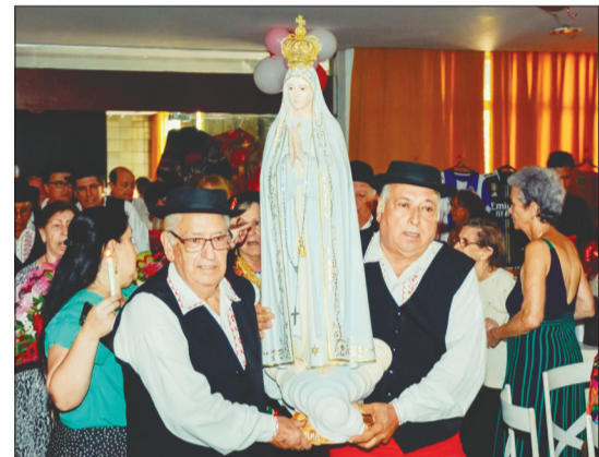
Momento da entrada da procissão, com imagem de Nossa Senhora de Fátima no salão do Clube Português de Niterói, conduzida pelos componentes do Rancho Folclórico Luís de Camões