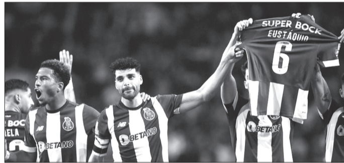
Médico canadiano está de luto pela morte do pai

Um gesto que o internacional canadiano destacou nas redes sociais. “Enormes”, escreveu Eustáquio, acompanhado com uma foto da homenagem.