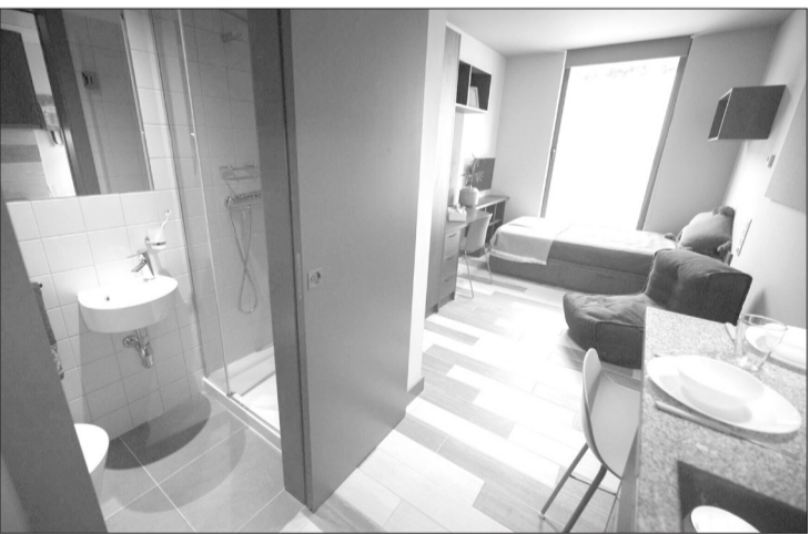
A Universidade de Lisboa (UL) vai construir uma nova residência universitária com 200 camas, um investimento de mais de cinco milhões de euros e com abertura prevista para 2026

A construção foi aprovada em resolução do Conselho de Ministros de 27 de março, o último liderado por António Costa e com a participação do presidente da República, Marcelo Rebelo de Sousa.