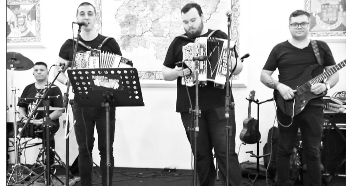
O conjunto Amigos do Alto Minho deu o charme musical ao almoço dos aniversariantes