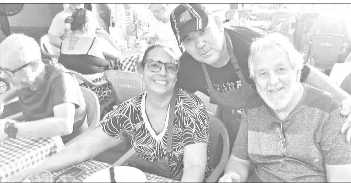
Gente da melhor qualidade, marcando presença no Cantinho das Concertinas, recebendo tratamento vip, da excelente equipe de colaboradores