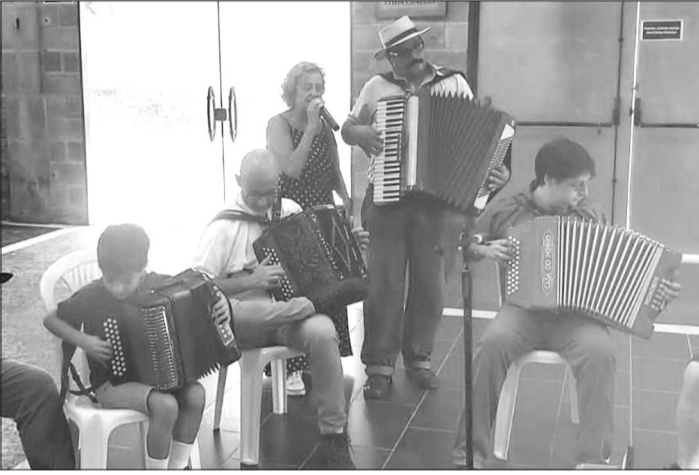
Registro do 1º Encontro de Concertinas, onde vemos os músicos reunidos numa verdadeira roda musical, já com a nova geração de sanfoneiro