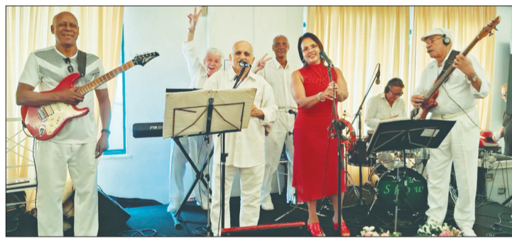
A Banda Típicos da Beira Show, deu o ritmo musical ao convívio social na Casa dos Açores

recebeu a todos com muito carinho e simpatia, com a Casa cheia e com muita animação, a música ao vivo para dançar ficou com a excelente Banda Típicos da Beira Show Foi, sem dúvida um belo domingo para aqueles que estiveram presentes no Solar da Avenida Melo Matos, 21/25 Tijuca.