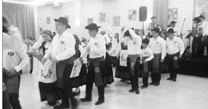
Apresentação, com muito capricho e emoção, dos componentes do R.F. Guerra Junqueiro, com seus trajés tipicamente regionais