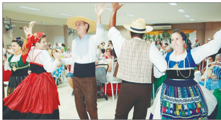
O Grupo Folclórico Serões das Aldeias, realizou mas um lindo espetáculo, que show parabéns moçada, pelos 20 anos de Fundação