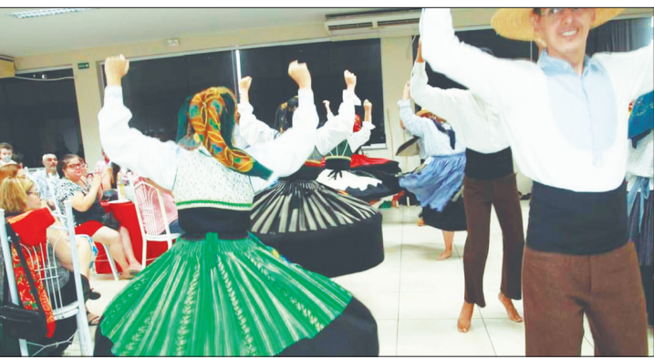
Que apresentação magistral, muita elegância do Grupo Folclórico Serões das Aldeias, há 20 anos brilhando na Comunidade Portuguesa