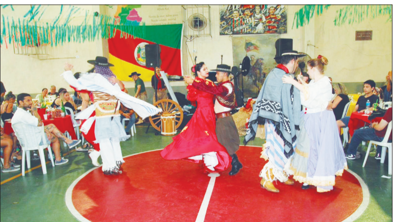
Bonita foto com componentes do Rancho Gaúcho, numa pose especial para o Jornal Portugal em Foco