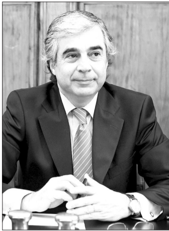
José Pedro Aguiar-Branco, antigo ministro da Defesa, sucederá ao socialista

Segundo o Regimento da Assembleia da República, a eleição do presidente do parlamento tem lugar na primeira reunião plenária da legislatura e é eleito o candidato que obtiver a maioria absoluta dos votos dos deputados em efetividade de funções.