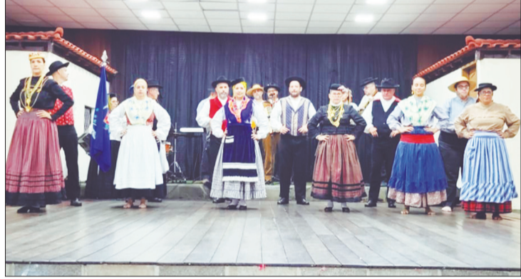
Num registro com os componentes do R.F. Camponeses de Portugal, com seus belos trajes regionais