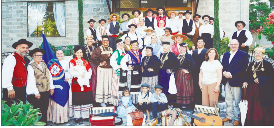
Bela imagem para ficar para história, com os componentes do Rancho Folclórico Camponeses de Portugal no domingo de Ramos