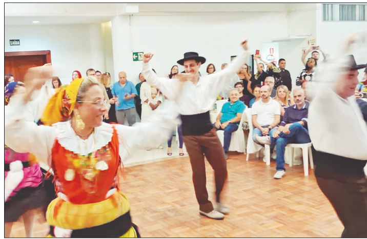
A magia e o encanto do folclore do R. F. Maria da Fonte, simplesmente maravilhoso, nesta foto que mostra toda elegância desta dança