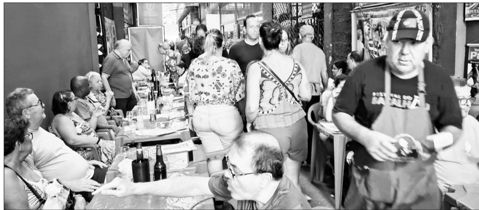
Uma grande festa, aos sábados no Polo Gastronômico do Cadeg. O Cantinho das Concertinas é destaque com toda equipe, sempre receptiva com os amigos frequentadores deste acolhedor espaço Regional