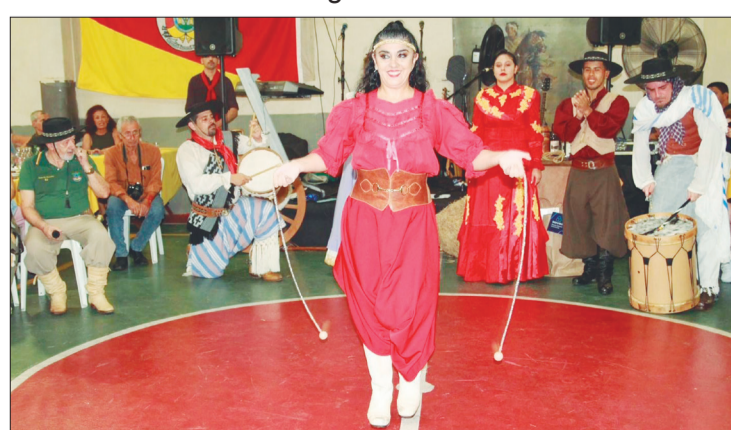
Um verdadeiro show de Folclore da cultura Gaúcha, no Rio de Janeiro