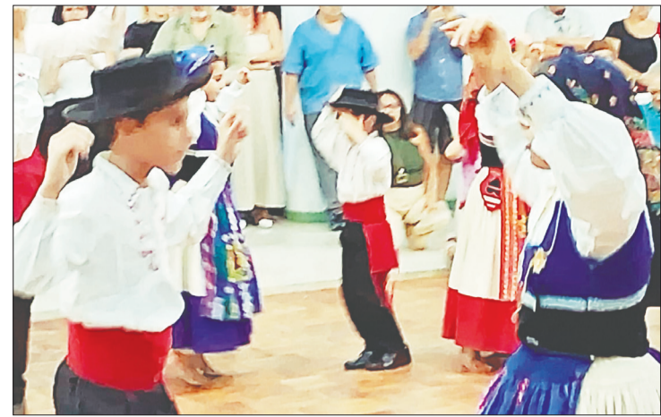
Um verdadeiro show proporcionado pelo Rancho Juvenil da Casa do Minho