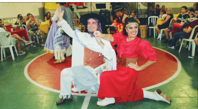
Uma apresentação magistral do Rancho Gaúcho no Orfeão Português