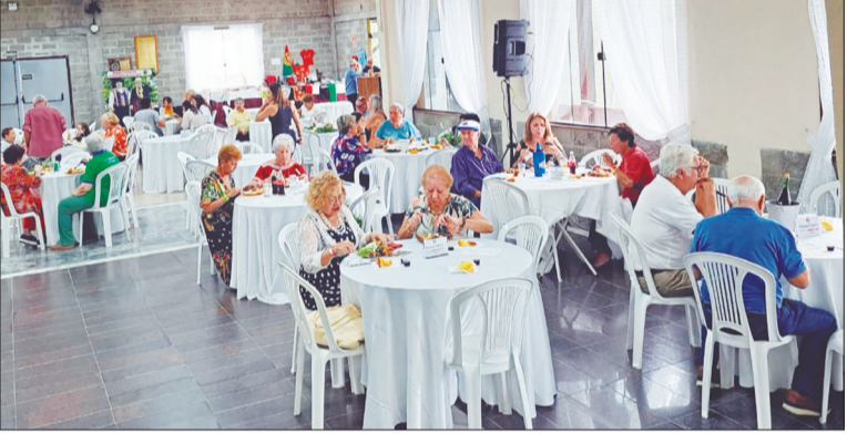
Panorâmica do domingo de Páscoa antecipada no Clube Camponeses de Portugal