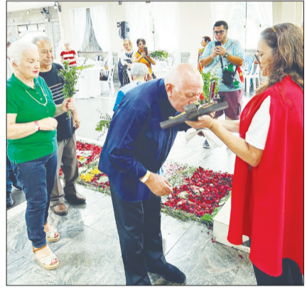
Momento do Tradicional Beija-Cruz realizado pelos fiéis