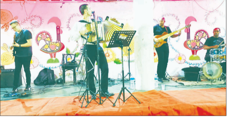
O Conjunto Amigos do Alto Minho, sempre, agitando o Arraial-Minhoto