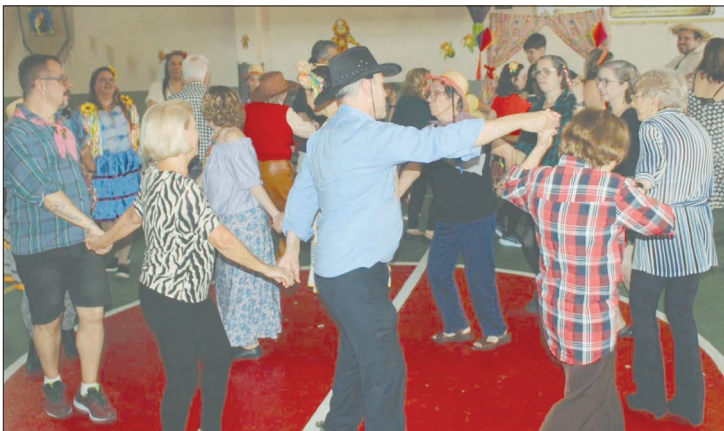
Os componentes do G.F Armando Leça da Casa do Porto, agitaram o salão com sua tradicional quadrilha Junina