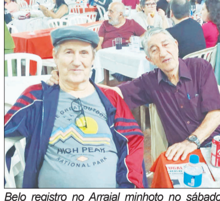
Belo registro no Arraial minhoto no sábado passado com o diretor Veloso, com um amigo