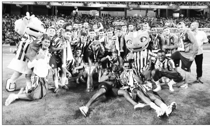
Épica reviravolta dos dragões na Supertaça selou o 86.º título da história e Benfica tem 85

Agora, os dragões têm 86 no seu palmarés — 30 Campeonatos, 24 Super-