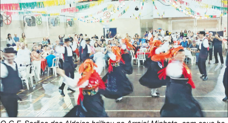
O G.F. Serões das Aldeias brilhou no Arraial Minhoto, com seus belos trajes