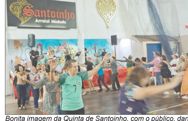
Bonita imagem da Quinta de Santoinho, com o público, dançando show no ginásio Minhoto