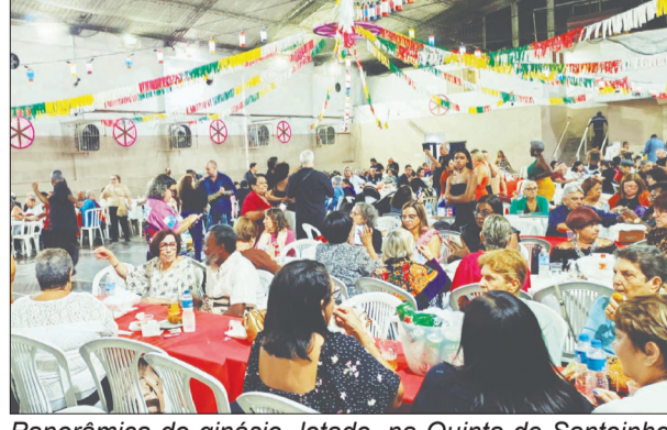
Panorâmica do ginásio, lotado, na Quinta de Santoinho onde a atenção é sempre