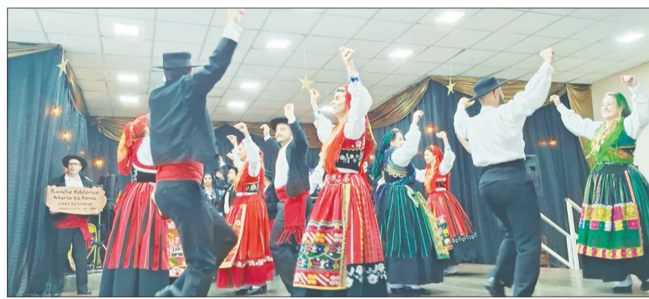
Apresentação magistral do R.F. Maria da Fonte da Casa do Minho, no almoço festivo dos Pais nos Camponeses de Portugal