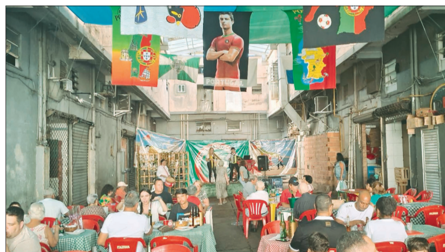
Marcando presença, no Cantinho das Concertinas do Cadeq, a comunidade portuguesa, que sempre prestigia a Aldeia Portuguesa