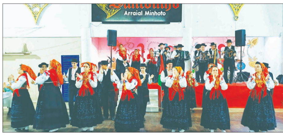
Foi um show a participação do G.F. Serões das Aldeias, no Arraial Minhoto e como sempre acarinhados pelo público presente

T odo os meses, em seu primeiro sábado, a família minhota tem o seu encontro com as belas tradições da sua terra. Os sabores da típica culinária, a música e o folclore, tudo provoca uma onda contagiante dentro daquele que é considerado o maior Arraial Minhoto – Quinta de Santoinho. E no passado sábado, dia 3 de Agosto, aconteceu mais um encontro com farto serviço gastronômico onde não faltam a alegria e a confraternização daqueles que já tem “cadeira cativa”. É sempre um prazer receber visitantes que passam a conhecer este grandioso convívio. Ninguém resiste à sardinha na brasa bem preparada, tornando-se uma especialidade da gente minhota, assim como o caldo verde, sempre quentinho com cheirinho da santa terra! Na música um sucesso sempre marcante no Arraial, o Conjunto Amigos do Alto Minho. Enfim, a Quinta de Santoinho é um calendário cheio de tradição que nunca sai da moda.