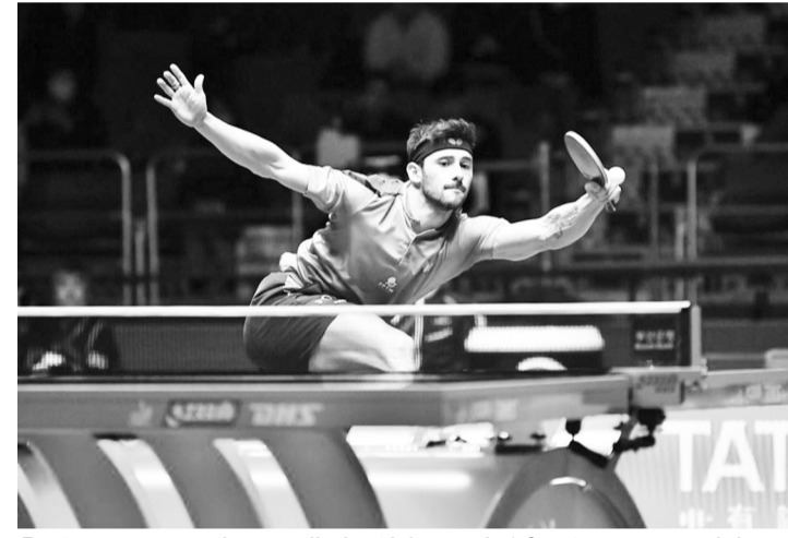
Portugueses perderam eliminatória por 3-1 frente aos canarinhos

A seleção portuguesa masculina de ténis de mesa foi, esta segunda-feira passada, eliminada nos oitavos de final dos Jogos Olímpicos de Paris 2024, depois de perder com o Brasil, 9.º cabeça de série, por 3-1.