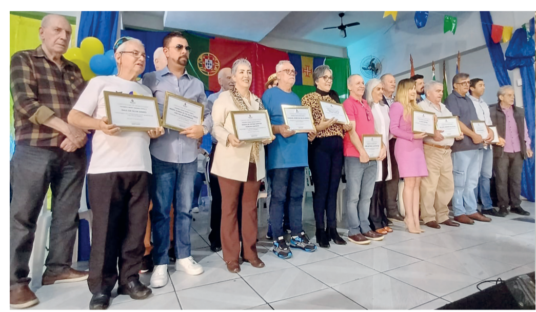
Aqui os muitos ilustres homenageados neste dia na Casa Ilha da Madeira.