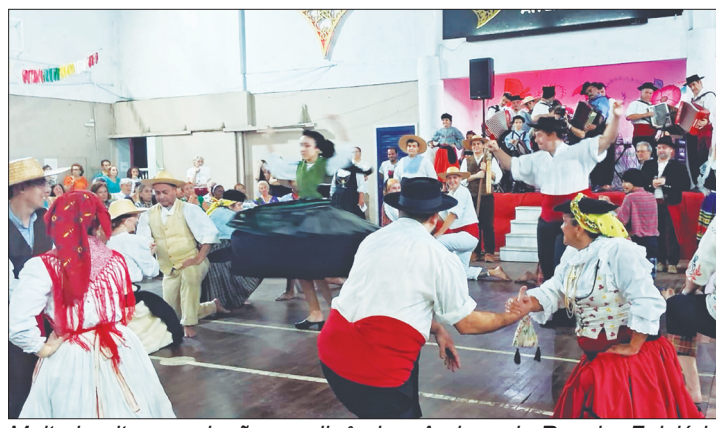
Muito bonita a evolução e a dinâmica Amigos do Rancho Folclórico Maria da Fonte, além de seus lindos trajés