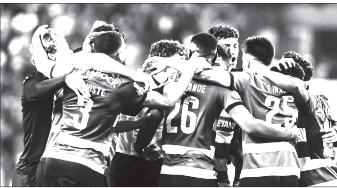
Sporting venceu o Benfica por 2-1

A vitória no dérbi deixou o Sporting com 71 pontos em 27 jogos do campeonato, restando-lhe disputar sete até final da temporada. Terá, pois, a possibilidade de conquistar 21 pontos, sendo que 15 serão os suficientes para garantir o título (o Benfica só pode somar mais 18 pontos e tem quatro de atraso).