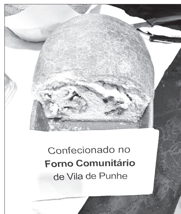
Confecionado no Forno Comunitário de Vila de Punhe