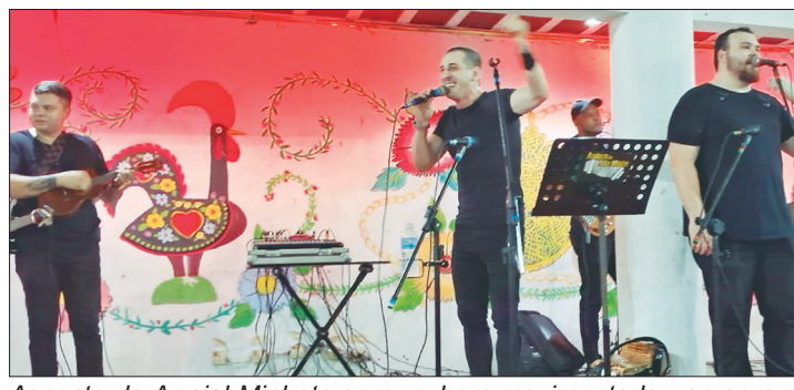
Aspecto do Arraial Minhoto sempre bem movimentado, ao som do conjunto Amigos do Alto Minho

se deliciavam com um buffet completo com sardinha portuguesa na brasa, febras (carne de porco), Drumet, linguça calabresa, feijão manteiga, arroz, batata cozida, batata calabresa, saladas, broa de milho e caldo verde quente, enfim, os Amigos do R. F. Maria da Fonte é anunciado, sob os aplausos da plateia que se encanta a