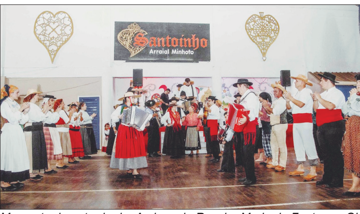
Momento da entrada do Amigos do Rancho Maria da Fonte, no Ginásio da Casa do Minho, para sua apresentação