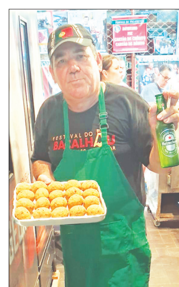
O famoso e delicioso bolinho de bacalhau, Marca especial do Cantinho das Concertinas