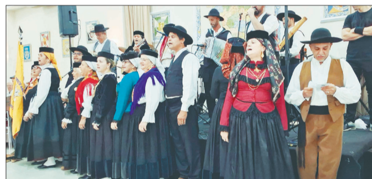
Apresentação, com muito capricho e emoção, dos componentes do R.F. do Arouca, com seus trajes tipicamente regionais

sem ter uma tarde alegre com os seus amigos e familiares. Como não poderia deixar de ser, foram momentos agradáveis com excelente ambiente e boa música de Amigos do Alto