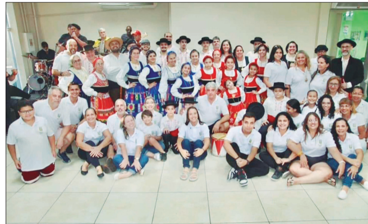
A tradicional confraternização do R.F. Fausto Neves com o Rancho Juvenil da Casa do Minho