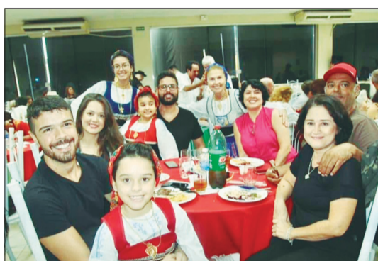
As lindas crianças do Rancho Juvenil da Casa do Minho junto com seus familiares na festa