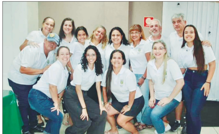
Os componentes do G.F. Fausto Neves trabalhando e também curtindo a o convívio social Espinhense