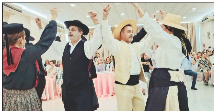
Outro registro do show de folclore, no almoço dos aniversariantes, do R.F. do Arouca Barra Clube

meira fartura, o almoço tem um cardápio variado, com churrasco completo, saladas variadas e estrogonofe de frango. Também foi uma bela oportunidade para que os aniversariantes pudes-