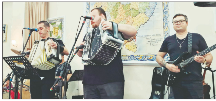
O conjunto Amigos do Alto Minho, deu o ritmo ao almoço transmontano, evento sempre aguardado por aqueles que apreciam uma Casa Regional