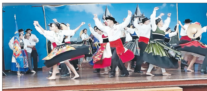
Mas um show do G.F. Almeida Garrett, na Quinta do Castelo e sempre marcante a atuação como muito empenho e dedicação