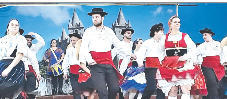
Um verdadeiro show de folclore, a apresentação G.F Almeida Garrett, que coisa linda, que espetáculo, sensacional