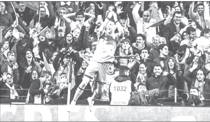
Capitão de Portugal pode terminar «dentro de um ou dois anos»; deseja sorte ao novo treinador do Manchester United e fala de marcas pessoais

Cristiano Ronaldo, capitão de Portugal, esteve na zona mista do Estádio do Dragão no final do encontro e falou abertamente sobre vários temas, entre os quais o final de carreira. CR7 começou pelo jogo. "Foi uma segunda parte espetacular, boa dinâmica, ficamos em primeiro, era