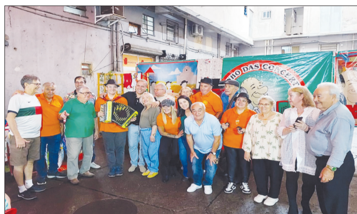
Belíssima confraternização da comunidade do Rio de Janeiro, com o Cantor Português Carlos Rivera