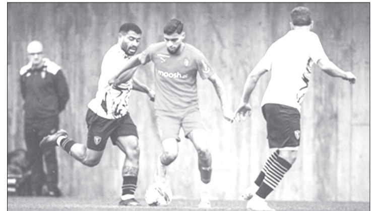
Após ter vencido o Felgueiras, também da II Liga, na quinta-feira

Um dia depois de ter vencido o Felgueiras por 3-2, o Braga goleou o Acadêmico de Viseu, também da II Liga, por 4-1, em novo jogo particular disputado na Cidade Desportiva do clube minhoto.