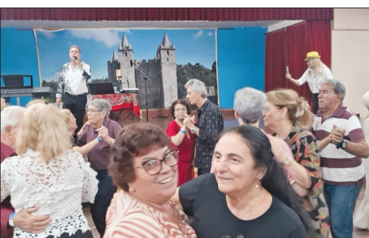
Panorâmica da Quinta do Castelo com o publico, dando show no salão feirense