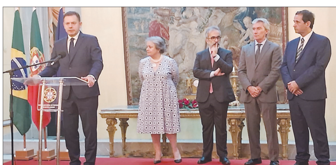
O primeiro-ministro anunciou a realização de uma cimeira luso-brasileira em fevereiro do próximo ano, no Brasil, e uma nova visita a este país, em data a acertar. Montenegro defendeu que a interação entre Portugal e Brasil está mais viva do que nunca, e que para além das ligações culturais, históricas e das parcerias económicas, a ligação entre os dois países tem uma dimensão humana verdadeiramente notável. "Estaremos a falar, grosso modo, de 700 mil portugueses no Brasil e de 700 mil brasileiros em Portugal", destacou

reforma das instituições de governação global. O início da cimeira do G20 do Rio ficou marcado pelo lançamento, pelo Presidente Lula, da Aliança contra a Fome e a Pobreza, iniciativa a que Portugal aderiu como fundador e para a qual anunciou um contributo inicial, correspondente a 10% das despesas administrativas de funcionamento da aliança, de 300 mil dólares (perto de 284 mil euros) anuais até 2030. À tarde, Luís Montenegro irá visitar o Real Gabinete Português de Leitura e ao qual entregou a obra completa de Eduardo Lourenço, uma edição da Fundação Calouste Gulbenkian. O último ponto da agenda oficial de Luís Montenegro no Rio de Janeiro foi uma recepção à comunidade portuguesa, no Consulado-geral de Portugal no Rio, no Palácio de São Clemente.