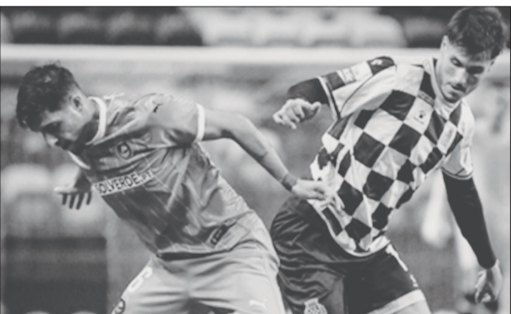
Triunfo da formação de Vila do Conde por dois gols sem resposta

O Rio Ave venceu em casa do Boavista por 2-0, em jogo da 11.ª jornada da I Liga que marcou a estréia de Petit, antigo treinador boavistense, no comando dos vila-condenses.