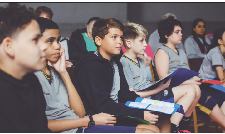
Alunos do 4º e 5º ano.