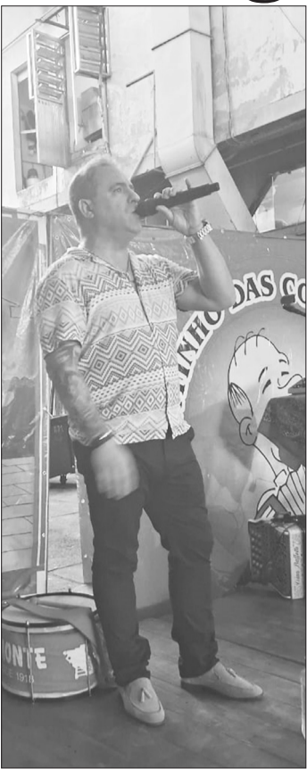
Esse sábado foi pra-lá de especial, com atração internacional o Cantor Português Carlos Rivéra, que deu uma canja na Aldeia portuguesa