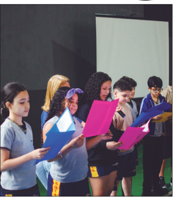
Alunos do 5º ano lendo o poema "Quando as crianças brincam", de Fernando Pessoa.

No dia 28 de outubro houve no Colégio Sagres um encontro de gerações: o Lar D. Pedro V, casa de acolhimento a pessoas idosas, fez uma visita à instituição escolar para uma "Tarde poética", nome dado ao evento que teve como proposta a socialização dos estudantes com os residentes do Lar.