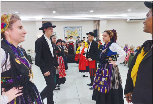
Simplemente espetacular a apresentação, deste maravilhoso Grupo Folclórico Serões das Aldeias

acolhida simpática da Casa. Num clima muito legal e imperdível. O nosso Jornal Portugal em Foco, aqui, registra alguns desses belos momentos.