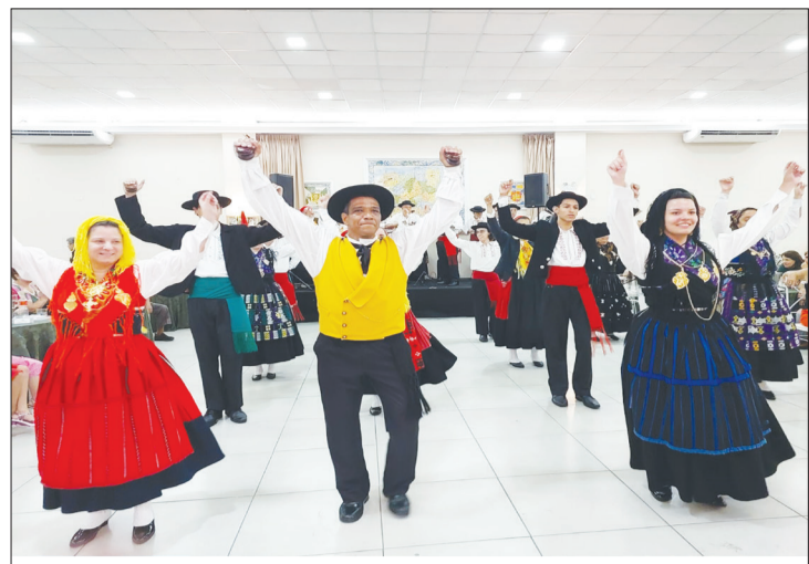
Mais um verdadeiro show de folclore dessa rapaziada do Serões das Aldeias, parabéns para todos os componentes.