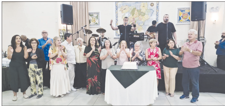
O tradicional momento dos parabéns pra você com os aniversariantes reunidos diante do bolo festivo, oferecido pela Casa de Trás-os-Montes