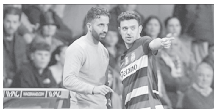
11 vitórias em outras tantas jornadas para os leões

Na próxima jornada, o Sporting, já com João Pereira a treinador, recebe o Santa Clara, e, caso conquiste os três pontos, baterá, então, o registro de 1990/91.