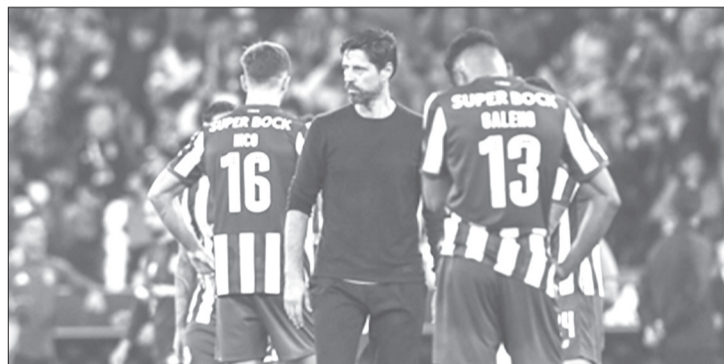
Declarações de Vítor Bruno, treinador do FC Porto, após o jogo com o Benfica, que terminou com um triunfo dos encarnados por 4-1.

Gols sofridos: “Foi culpa minha, não é mais de ninguém. Sou o máximo responsável. As decisões foram minhas, fui eu que as tomei. Tivemos um ou outro percalço, o Pepê esteve em grandes dificuldades para jogar, daí não ter entrado de início. Tivemos de redefinir a estratégia para o jogo, mas não serve de desculpa. A equipa esteve muito amorfa e os quatro gols surgem por aquilo que nunca fomos enquanto equipa. Não fomos competente do ponto de vista de organização e agressividade, que tem de ser uma marca forte do FC Porto.”