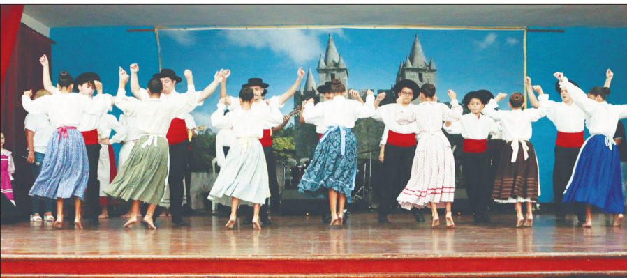
Numa linda apresentação nesta tarde de aniversário, o Rancho Folclórico Infante Juvenil de Danças e Cantares das Terras da Feira, sonhando com o dia em que participará do Grupo Folclórico Almeida Garrett da Vila da Feira