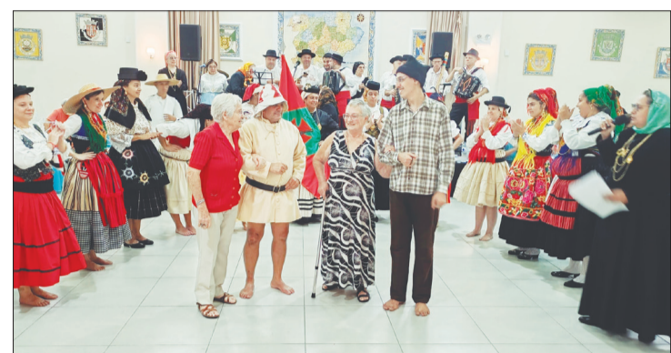
Bonita Homenagem dos componentes do G.F. Serões das Aldeias, a mamãe Mas idosa presente na festa em louvor a N.S de Fátima