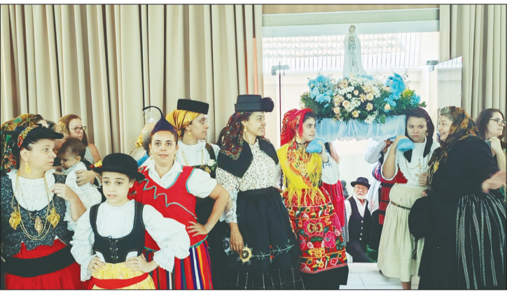
A entrada da imagem de Nossa Senhora de Fátima, conduzida pelos componentes do R.F. Serões das Aldeias, dirigindo-se aos fiéis