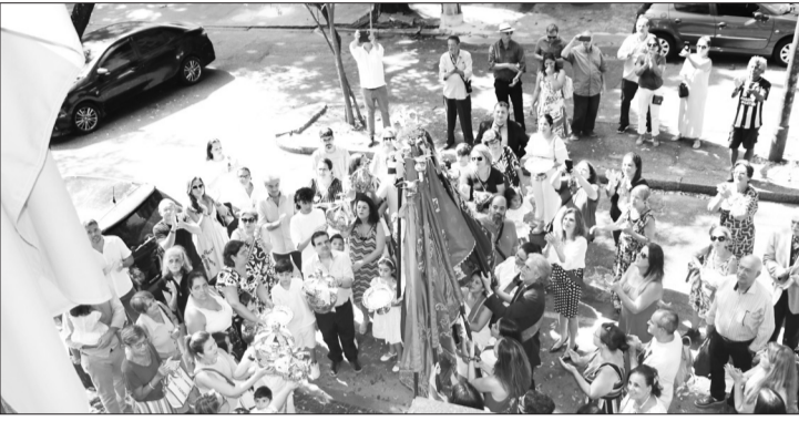
Outro belo momento desta linda tarde, a chegada da Procissão na Casa dos Açores, suas lindas Bandeiras e as Insignias tradicionais desta festa ao Divino Espírito Santo