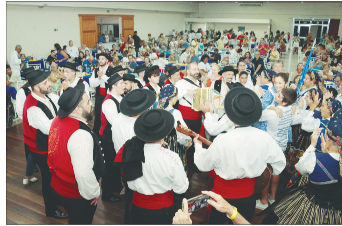
Explosão de alegria, na Vila da Feira, na festa do G.F. Almeida Garrett, a tocata reunida com os componentes vibrando, em mais uma apresentação espetacular