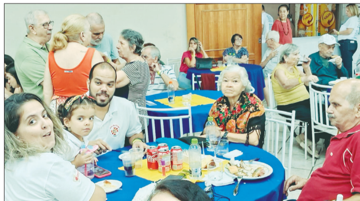
A família minhota marcou presença na festa de 62 anos de fundação do Grupo Folclórico Almeida Garrett