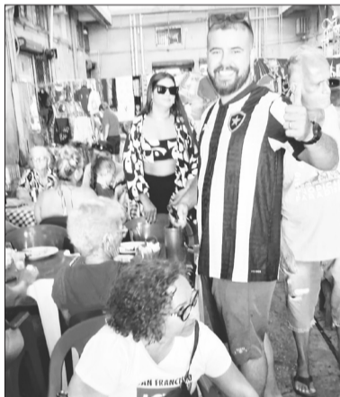
Gente boa e amiga, luso-brasileira curtindo o sábado a tarde na Aldeia Portuguesa do Cadeg