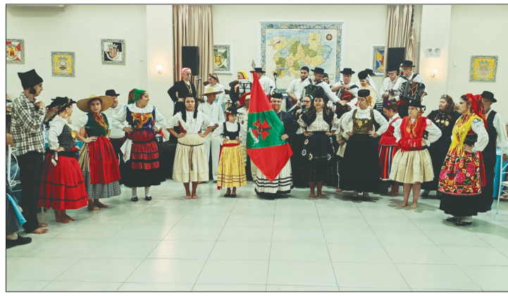
O G.F. Serões das Aldeias, deu mais um lindo show de Folclore no domingo passado no Solar Transmontano