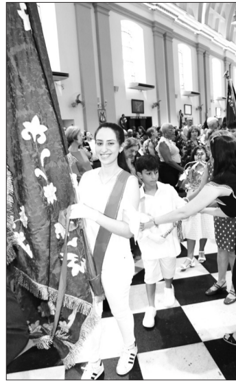
Procissão do Divino Espírito Santo quando dava entrada na Igreja São Francisco Xavier