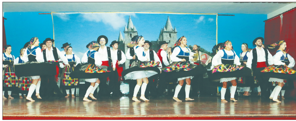
Uma verdadeira apoteose no Castelo da Vila da Feira, na festa do Grupo Folclórico Almeida Garrett