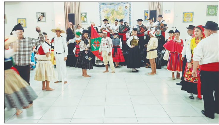
Linda apresentação dos componentes do G.F. Serões das Aldeias, na festa de Coroação da imagem de N.S. de Fátima