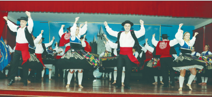
A moçada não brincou e deu, verdadeiro espetáculo de folclore na comemoração dos 62 anos de fundação