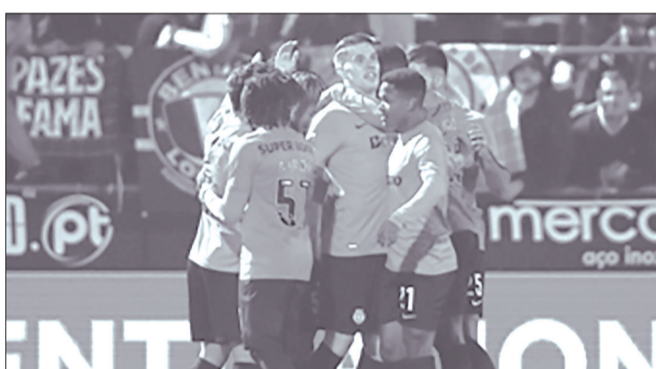
(1997) Simão Sabrosa, 17 anos, 6 meses e 16 dias (2002) Cristiano Ronaldo, 17 anos, 8 meses e 3 dias Depois de quatro empates, o Famalicão segue no oitavo lugar, com 13 pontos, apesar de não vencer há seis jogos.

Sporting tornando-se o mais jovem futebolista de sempre a marcar no campeonato da I Liga pelos leões. O jovem ala que já tinha conseguido o feito de marcar na estreia oficial pelos verdes e brancos, no desafio da Supertaça frente ao FC Porto em agosto, assinou o 2-0 na partida diante do Famalicão e obteve deste modo um recorde com 17 anos, cinco meses e 27 dias de idade.