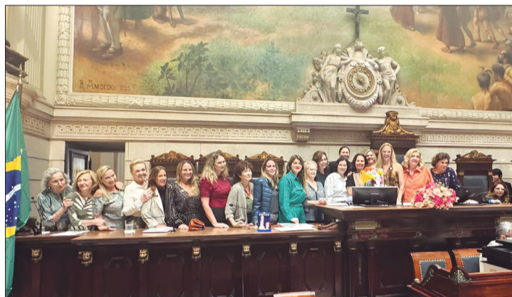
Panorâmica da Mesa de Honra da Câmara Municipal do Rio de Janeiro, numa belíssima confraternização