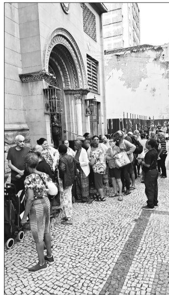
Os assistidos pela irmandade, aguardando a distribuição das cestas básicas