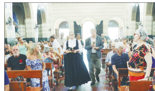
Momento do ofertório com a primeira-dama Rose Boaventura e o Presidente Ernesto Boaventura