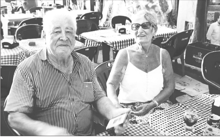
Quem também marcou presença na Aldeia Portuguesa no Cadeg no último sábado foi o simpático casal da nossa comida portuguesa