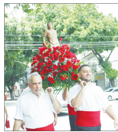
O andor, com a imagem do Padroeiro da Casa da Vila da Feira, conduzido pelos componentes do Rancho Folclórico Almeida Garrett