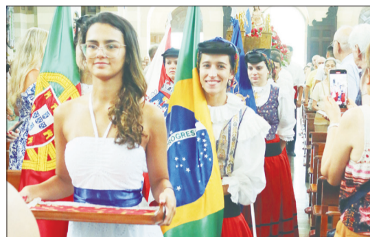
Componentes do R.F. Almeida Garrett no interior da Igreja dos Capuchinhos na Tijuca