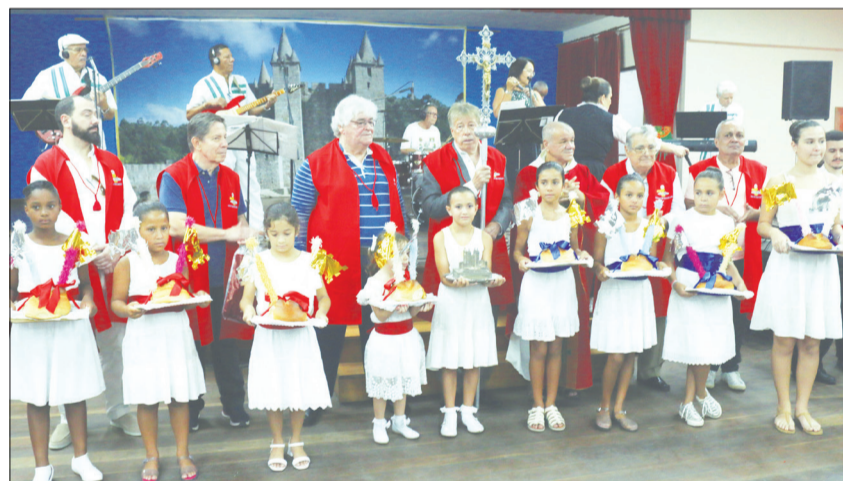
Já no palco da Vila da Feira, um momento marcante, as crianças com as fogaças, o Presidente e diretores feirenses