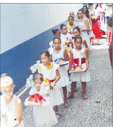
Tal como a Festa das Fogaceiras em sua cidade de origem as meninas vestidas de branco, conduzindo as Fogaças para Procissão