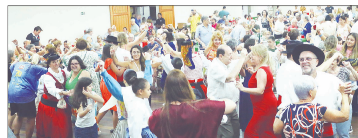
Panorâmica do almoço festivo das Fogaceiras, na Casa da Vila da Feira e Terras de Santa Maria