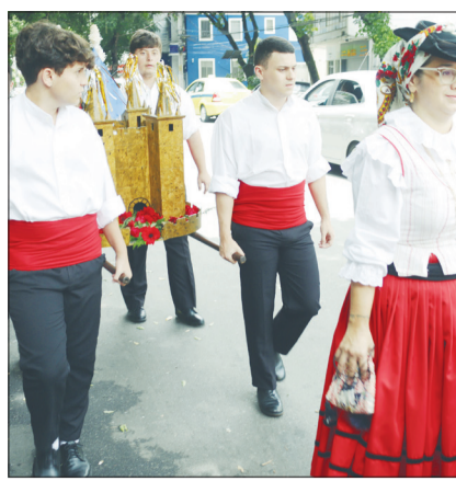
Outro belo registro durante a procissão em louvor a São Sebastião, componentes do Rancho com a imagem do Castelo da Feira pelas ruas da Tijuca