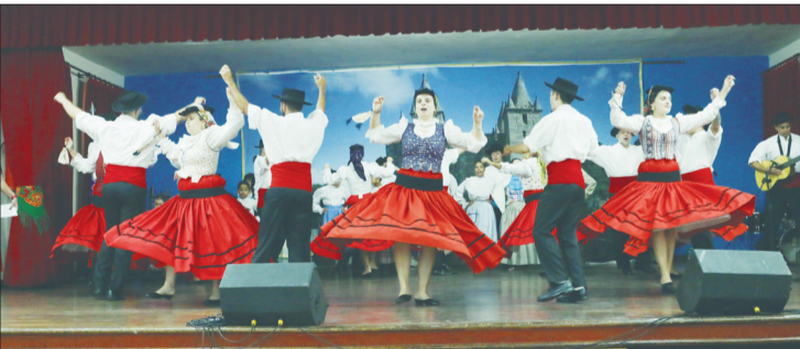
Belíssima apresentação do Rancho Folclórico Almeida Garrett na festa das Fogaceiras, mostrando que as tradições regionais não esmorecem