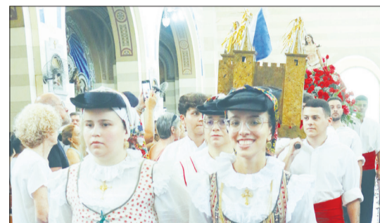
Saída da imagem de São Sebastião, da Igreja dos Capuchinhos, com os Componentes do Rancho Folclórico Almeida Garrett