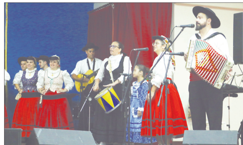
A excelente Tocata do Rancho Folclórico Almeida Garrett, brilhou na festa das Fogaceiras