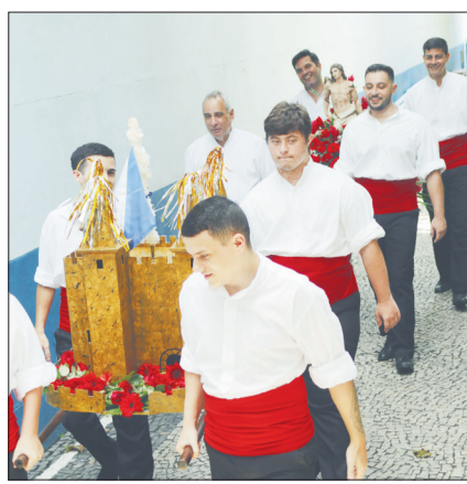
Componentes do R.F. Almeida Garrett, quando conduzindo o andor com a imagem de São Sebastião, na saída da Casa da Vila da Feira