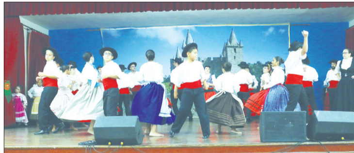
Apresentação magistral dos componentes R.F.I.J. Terras da Vila da Feira dando um belo espetáculo na Festa das Fogaceiras