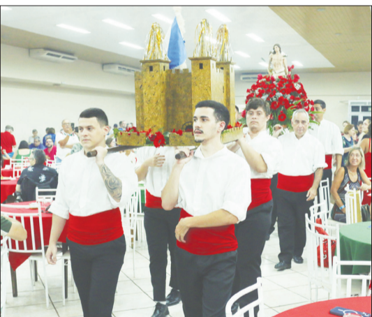
A imagem de São Sebastião, quando entrava no salão da Casa da Vila da Feira, abençoando todos os presentes