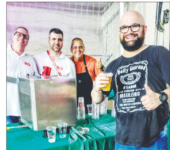
A turma aproveitou pra valer, extravasando alegria e descontração