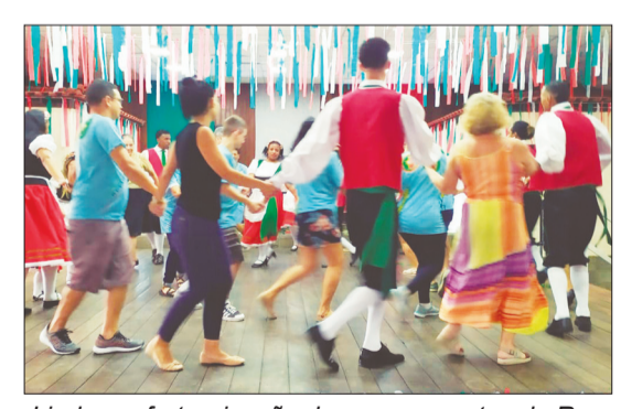
Linda confraternização dos componentes do Rancho Folclórico Fontana Di Trevi, do Rancho Camponeses de Portugal e do público presente