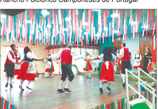
Rancho Folclórico Fontana Di Trevi, brilhando no palco dos Camponeses de Portugal