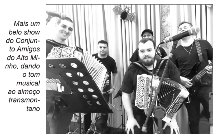
Mais um belo show do Conjunto Amigos do Alto Minho, dando o tom musical ao almoço transmontano