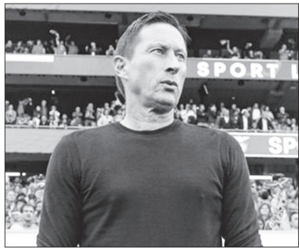
Roger Schmidt: "Jogámos bem, tivemos oportunidades, mas não decidimos o jogo"

Em declarações à BTV, Roger Schmidt considera que a sua equipe jogou "um bom futebol", mas foi castigada pela falta de eficácia. "Estamos frustrados" referiu o treinador das águias, justificando: "Penso que, se vivesse o jogo, temos de o ganhar. Hoje jogámos um bom futebol. Não é fácil criar oportunidades contra o Casa Pia, porque eles defendem bem. Tivemos grandes oportunidades, mas não decidimos o jogo. Com apenas