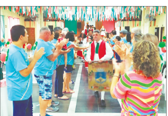
Entrada triunfal do Rancho Italiano Fontana Di Trevi, sendo recebidos pelos componentes do Rancho Folclórico Camponeses de Portugal