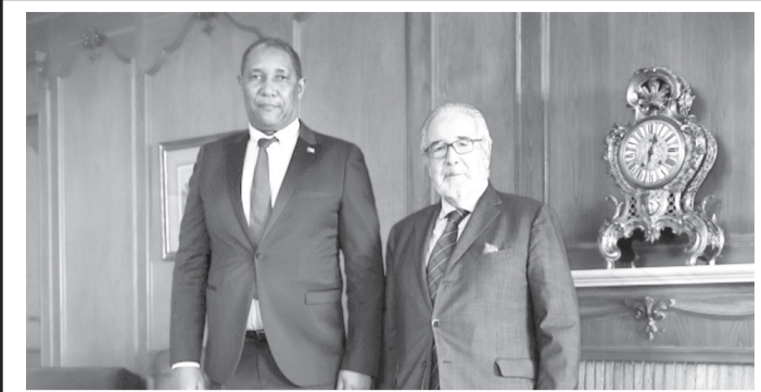
Esta visita, decorreu na Fundação de Oeiras e teve como objetivo reforçar as relações de cooperação entre o Município de Oeiras e a Guiné-Bissau