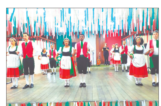
A apresentação do Rancho Folclórico Fontana Di Trevi, foi simplesmente maravilhosa