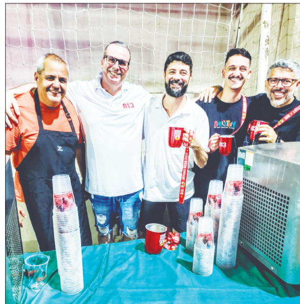
A rapaziada estava com saudades de um bom festival de Chope, ainda mas com este calor que esta fazendo, caiu muito bem

A diretoria da Casa do Minho realizou, no último sábado, mais um Festival de Chope, finalizando sua programação de outubro em grande estilo. Como sempre tudo num clima de total descontração, cordialidade e animação geral. Parabéns ao presidente Joaquim Fernandes e sua diretoria que, durante esses anos, têm realizado um trabalho brilhante além de divulgar as tradições portuguesas, com sua Quinta de Santinho e Arraial Minhoto tendo proporcionado aos seus diretores e associados, diversos tipos de eventos, Noite de Fados, e o Festival de Chope que é tradicional todos os anos e, realmente, a Casa do Minho é um verdadeiro ponto de turismo e lazer da cidade do Rio de Janeiro.