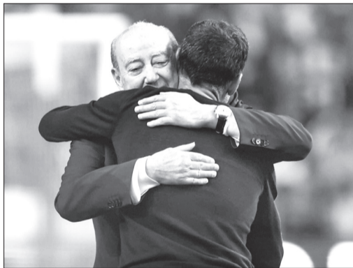
Declarações de Sérgio Conceição, treinador do FC Porto, após o triunfo por 2-0 em Vizela, em jogo da nona jornada da Liga Betclic

ta? Fruto do trabalho na paragem? "Sim, porque temos alguns jogadores novos, principalmente numa zona muito importante, que é o setor intermédio, onde é preciso trabalhar. Não conheço outra forma de evoluir os jogadores. Muita dedicação, muito foco, muita concentração no trabalho diário, para eles individualmente crescerem e para que a equipe possa crescer também. Seremos mais fortes se cada um de nós evoluir dessa forma. Com certeza que equipe ganha uma estabilidade completamente diferente com esse trabalho."