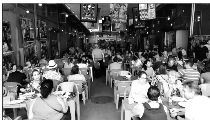
Panorâmica do sábado no Cantinho das Concertinas, na Aldeia Portuguesa