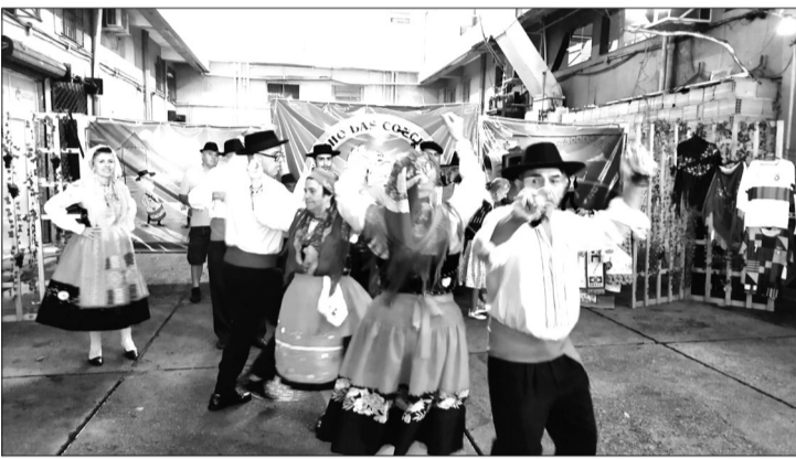
Atração do sábado na Aldeia portuguesa do Cadeg foi o Rancho Folclórico Armando Leça da Casa do Porto agitando a Aldeia Portuguesa