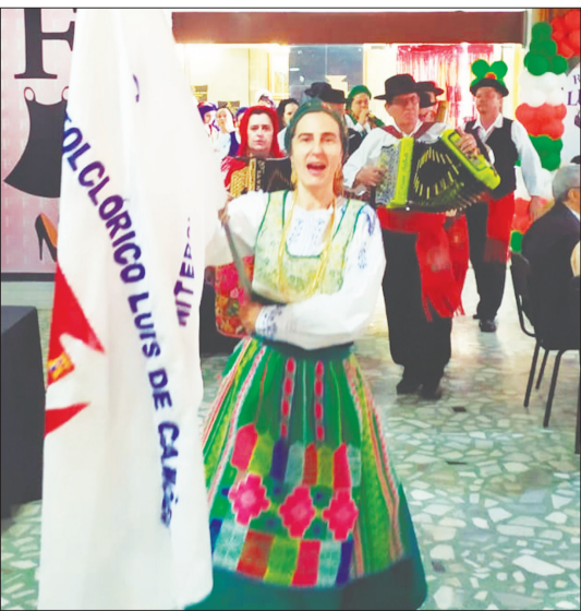
Momento da entrada do R.F. Luís de Camões na festa, de 41º anos de sua fundação, recebendo todo carinho do público presente