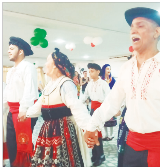
O charme e a elegância desses folcloristas que amam o folclore português, e têm prazer em divulgar suas tradições