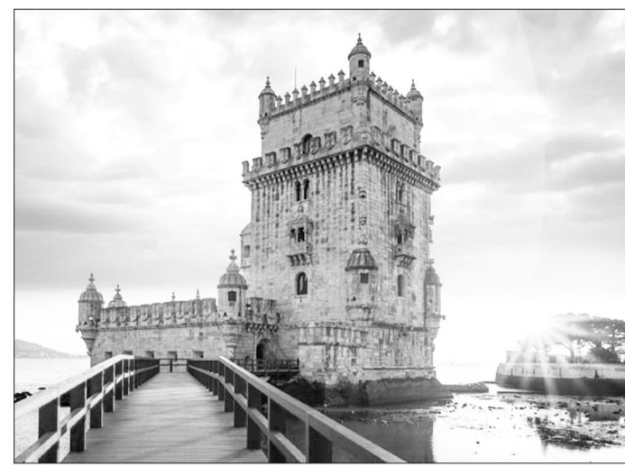
Subida do mar já provocou estragos na Torre de Belém

São temas em destaque nesta segunda edição dos encontros PNAID a economia azul, energias renováveis e sustentabilidade e agenda cultural, património, ciência e turismo.