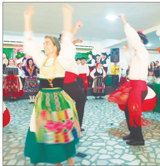
Que apresentação maravilhosa do Rancho Folclórico Luís de Camões, merecendo todas as atenções do público e os aplausos