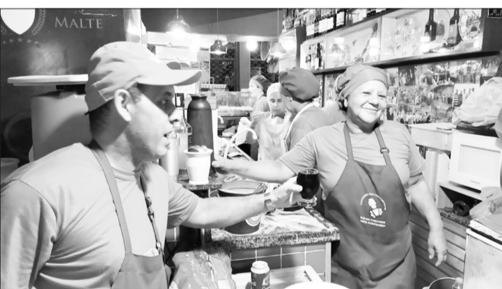
É essa turma sempre sorridente, agradável atendendo os clientes e amigos com aquela simpatia