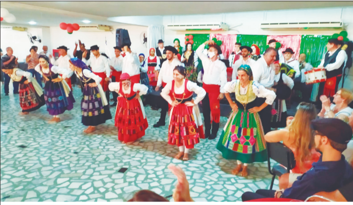
O Rancho Folclórico Luís de Camões, ao lado da sua Tocata, brilhando na festa comemorativa do seu aniversário. Podemos ver a alegria e a competência deste Grupo, que demonstra toda alegria do Clube Português de Niterói

recebendo a todos com muito carinho. O cardápio, maravilhoso, com um delicioso churrasco completo, acompanhamentos diversos. Uma tarde especial para os folcloristas que festejaram mais um ano de sucesso do R.F. Luís de Camões, que abrilhantou a festa com seus dançares e cantares. Na oportu-