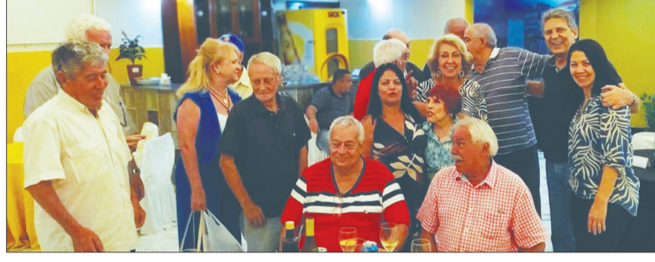
Explosão de alegria dos amigos, que fazem questão de esta presença no almoço das quartas na Casa das Beiras