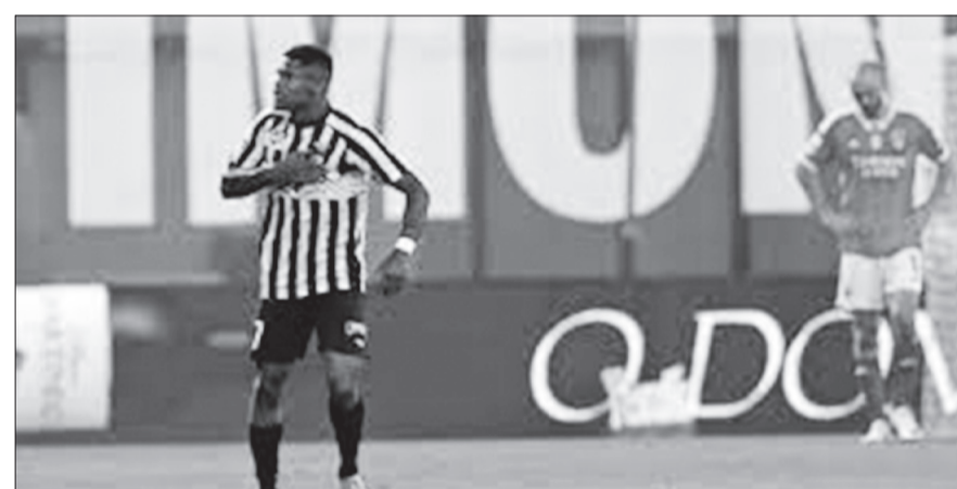
Atacante de 21 anos analisou derrota com as águias (1-3)

Questionado sobre se a entrada infeliz foi mérito do Benfica ou demérito, defendeu ter sido "um pouco dos dois" e justificou: "O Benfica entrou muito bem, como é costume. Sabíamos que ia ser complicado, tentámos entrar da melhor maneira