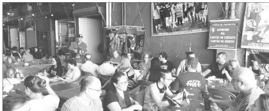
Panorâmica da Aldeia Portuguesa do Cadeg, no Cantinho das Concertinas sempre recebendo um bom público