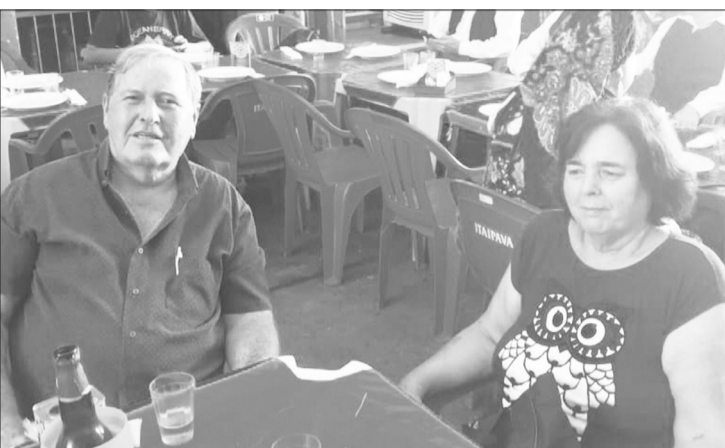
Gente e boa e amiga sempre marcando presença no Cantinho das Concertinas, como este casal de amigos do Jornal Portugal em Foco

S em qualquer dúvida, o Cantinho das Concertinas tem todo um carisma especial no qual a cada semana mais amigos tem se encontrado para se desafogar do dia a dia e degustar a maravilhosa gastronomia portuguesa e deliciosos vinhos portugueses. A empolgação e generosidade é a marca deste encontro dos amigos, todos os sábados no point da nossa comunidade luso-brasileira. Forme um grupo e vá se divertir no