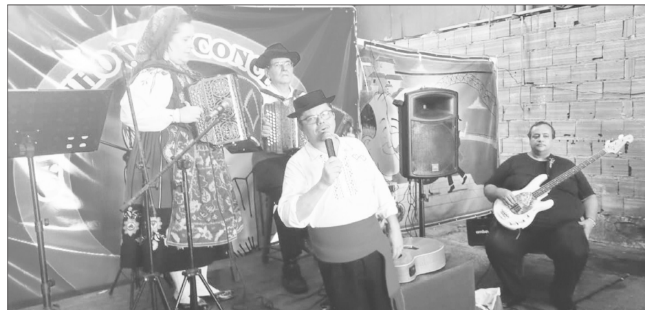
A tocata do Rancho Luís de Camões do Clube Português de Niterói, movimentou a Aldeia portuguesa do Cadeg