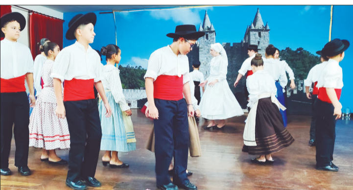
Um verdadeiro espetáculo a apresentação do Rancho Folclórico Infantil das Terras da Feira