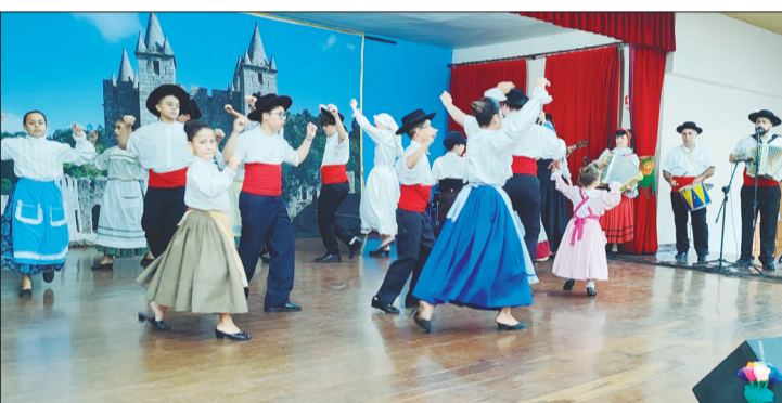
Que show do Rancho Folclórico Infantil das Terras da Feira na festa da Banda T.B. Show