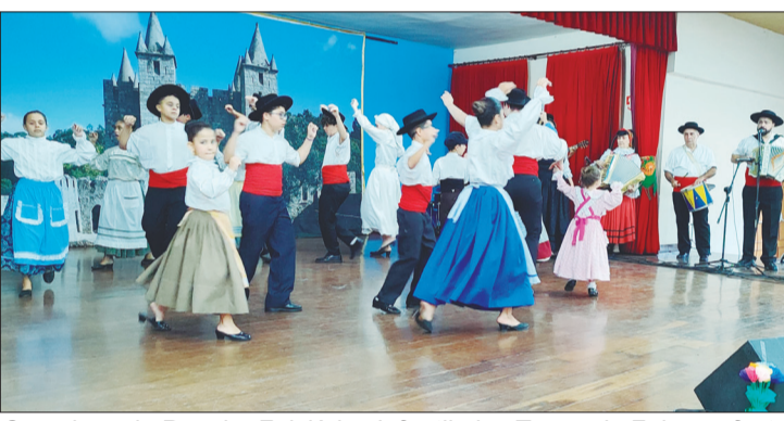
Que show do Rancho Folclórico Infantil das Terras da Feira na festa da Banda T.B. Show