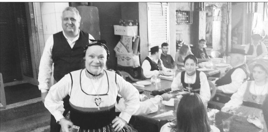
O Rancho Folclórico Luís de Camões brilhou no sábado passado, na Aldeia portuguesa do Cadeg, no Cantinho das Concertinas realizando uma apresentação magnífica