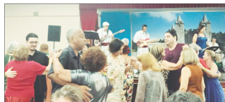
Panorâmica da festa de 38 anos, de vida artística da excelente Banda T.B. Show, parabéns rapaziada mais sucesso