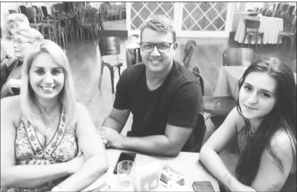
Num destaque na Adegas do Porto vemos está linda família curtindo o evento