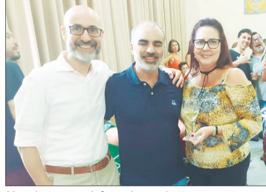
Num bate papo informal no solar transmontano os amigos.....