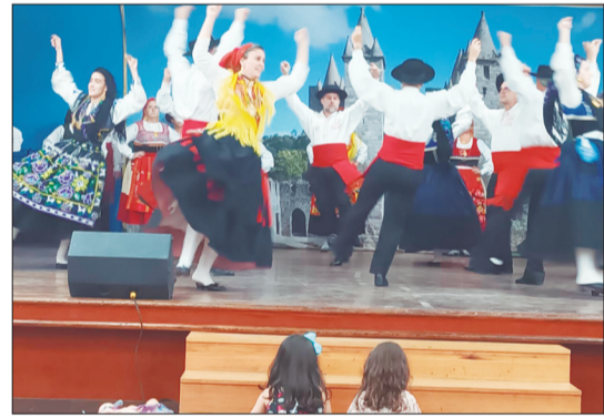
Imagem fantástica do G.F. Almeida Garrett em mas um lindo espetáculo