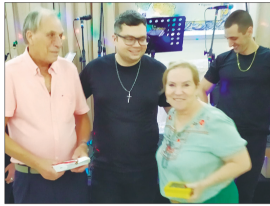
O ex-presidente Transmontano Antônio Paiva e esposa Fátima Paiva durante as homenagens festivas