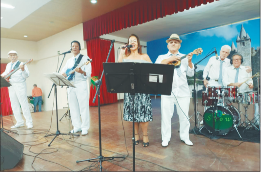
Presença marcante desses músicos da querida Banda T.B. .Show na Casa da Vila da Feira