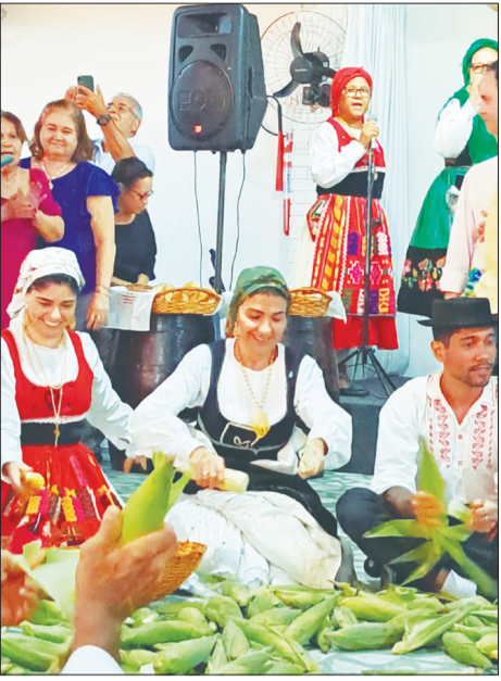
O momento da desfolhada com os componentes do Rancho Folclórico Luís de Camões