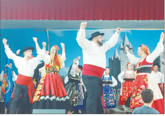
Esse show do Almeida Garrett vai ficar para a história no Arraial Feirense- Quinta do Castelo

Que dia especial no Castelo da Feira, onde a magia do folclore reinou com o Arraial Feirense Quinta do Castelo, mais