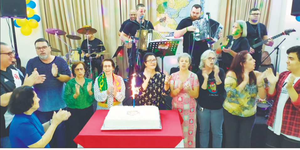
Diante do bolo comemorativo vemos os aniversariantes. Presente no Tradicional Parabéns pra você