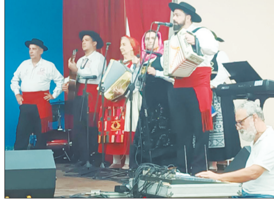
A Tocata do G.F. Almeida Garrett sempre e uma atração aparte, muito ritmo e dedicação