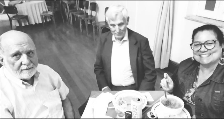
Um sexta-feira muito agradável, diversos familiares e amigos saboreando aquele delicioso caldo verde