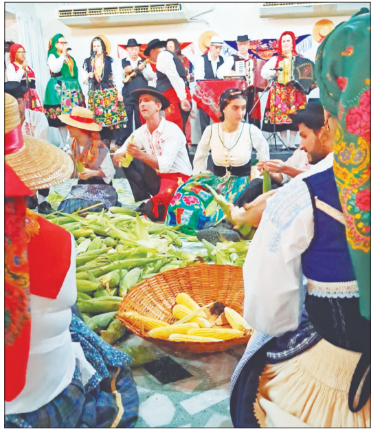
Panorâmica dos componentes do Luís de Camões, revivendo as tradições Portuguesas nesta linda Festa da desfolhada