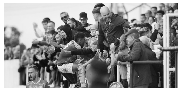
Quatro representantes do principal escalão já eliminados