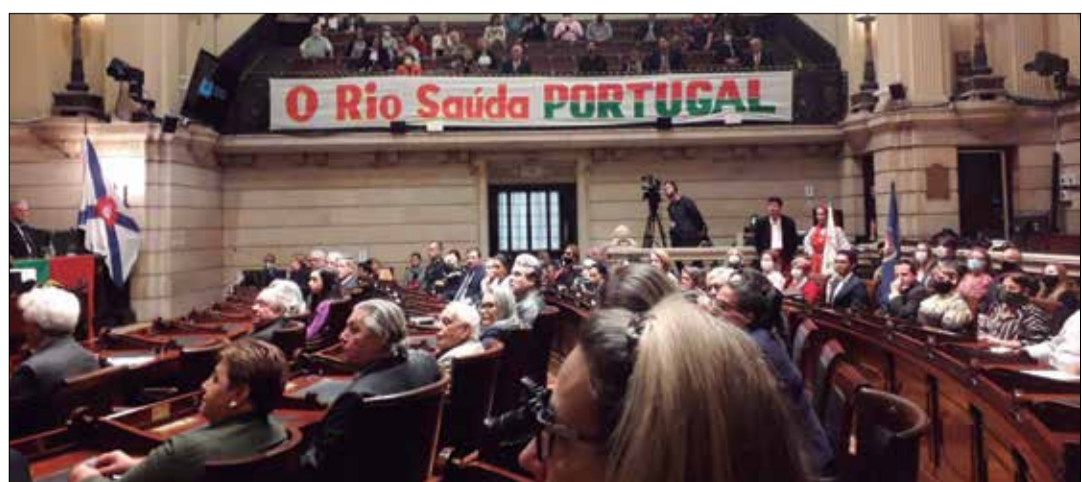
Panorâmica do Plenário com a presença de convidados da Comunidade Luso Brasileira