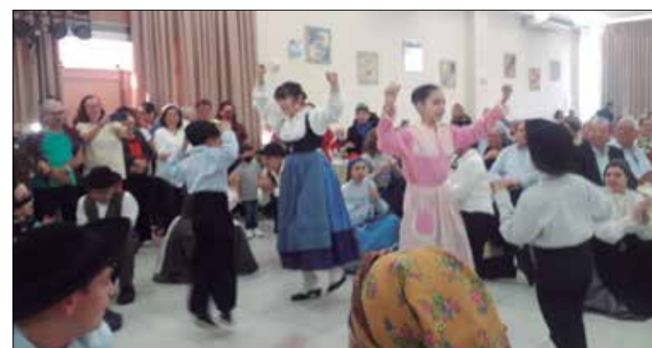
O Rancho Folclórico Guerra Junqueiro, deu um show de folclore