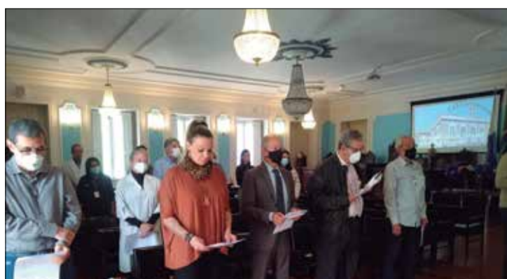
Panorâmica de diretores e convidados no Ato Religioso de Fundação