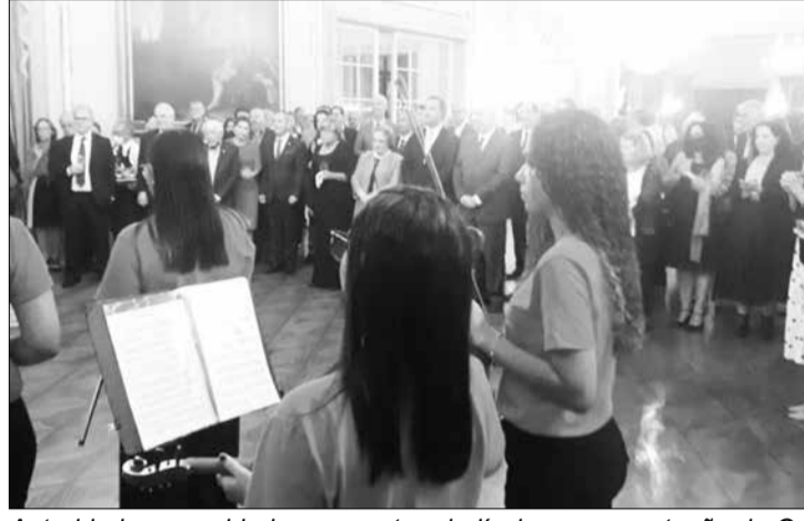
Autoridades, convidados presente a belíssima apresentação da Orquestra Chiquinha Gonzaga, que brilhou nesta Noite festiva

A Comunidade Portuguesa do Rio de Janeiro compareceu, na última sexta-feira, nas dependências do Palácio de São Clemente, em Botafogo, para celebrar o Dia de Portugal, Dia de Camões, da Raça e das Comunidades Portuguesas no Mundo.