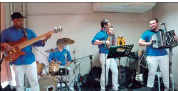
O Conjunto Amigos do Auto Minho agitou o Almoço na Casa de Espinho