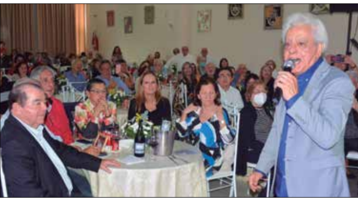
Mário Simões, soltando a voz e matando a saudade dos amigos

Foi um domingo inesquecível na Casa de Trás-os-Montes com almoço em homenagem ao Dia dos Namorados, que teve como atração a volta do Cantor Mário Simões, aos palcos, foi um dia perfeito com a casa totalmente lotada para o retorno do querido artista português.