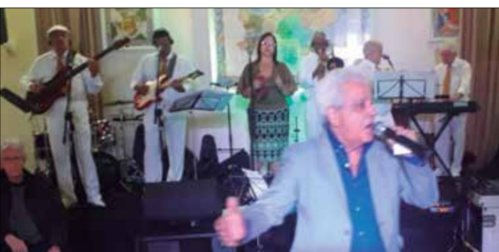
Um dia muito especial para o cantor Mário Simões no reencontro com seu público