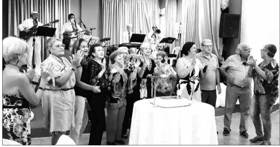
Não poderia faltar o tradicional parabéns pra você com os aniversariantes do mês

O ano começou com movimentado a realização do Almoço em homenagem ao "Dia de Reis e aniversariantes", um pedaço de dia maravilhoso com amigos se reencontrando após a festa de fim-de-ano um Almoço no capricho além de bons vinhos. A animação ficou por conta da Banda T.B. Show do Maestro Rogério que agitou o salão não faltando o tradicional parabéns aos aniversariantes.