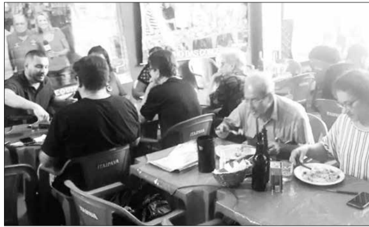
Gente fina é outra coisa já começou o ano saboreando a gastronomia do Cantinho das Concertinas