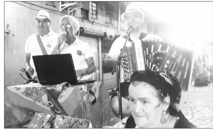
O Conjunto Cláudio Santos e seus Amigos começaram com força total para continuar divulgando as tradições portuguesas