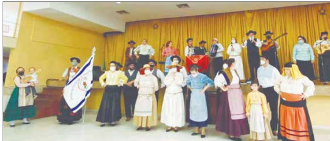
Linda imagem do Rancho Folclore da Casa de Viseu e sua Tocata que deram um show espetacular