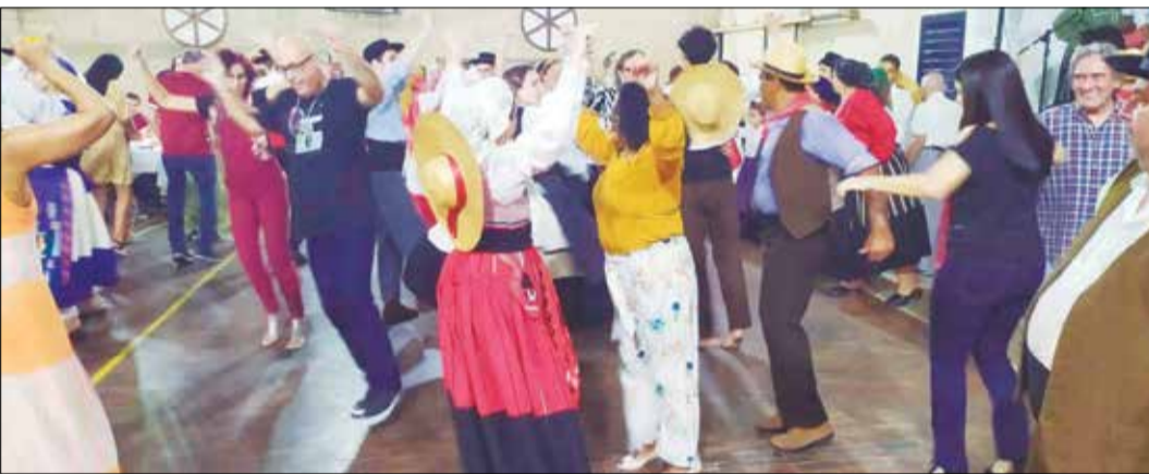
Panorâmica do Arraial Minhoto, onde R.F. Serões das Aldeias, brindou o público com um lindo espetáculo que show da rapaziada parabéns