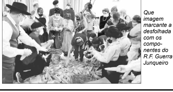
Que imagem marcante a desfolhada com os componentes do R.F. Guerra Junqueiro