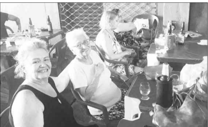
O Cantinho das Concertinas, sempre uma boa opção para as famílias portuguesas