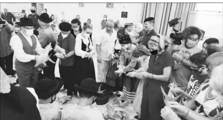
Tradicional momento da desfolhada com os componentes do R.F. Guerra Junqueiro e convidados