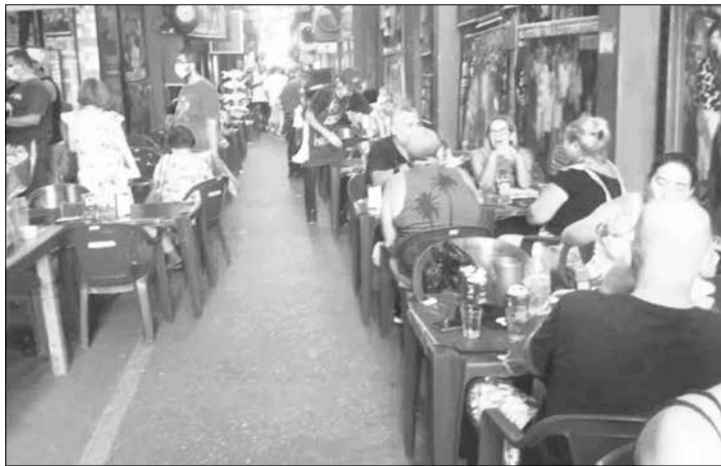
Panorâmica do Polo Gastronômico do Cadeg, sempre uma boa opção aos sábados, além de ótimos preços não falta a deliciosa gastronomia

Cantinho das Concertinas, para saborear a deliciosa gastronomia preparada no capricho preparado pelos mestre do sabor e supervisão do mestre Carlinhos.