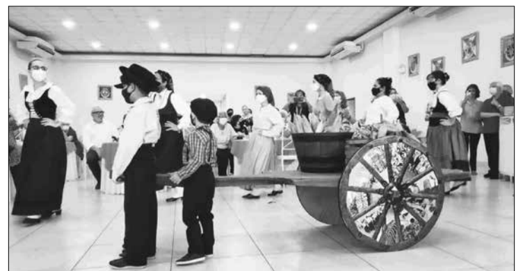
Momento o carrinho com os milho para início da desfolhada