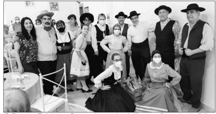
O Rancho Folclórico Guerra Junqueiro, brilhou na festa da desfolhada dando um show de folclore