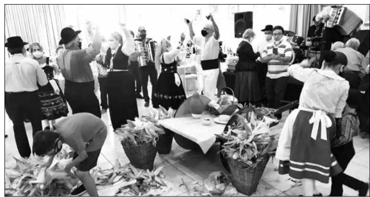
Que imagem linda quanto tempo não tivemos a desfolhada tradição transmontana