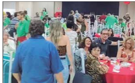
Diversas família comemoram o Dia das Mães na Casa de Espinho