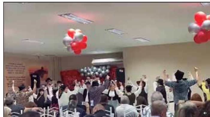
Que dia maravilhoso na Casa de Espinho relembrado os velhos tempos

Depois de 2 anos a Casa de Espinho voltou a fazer seu tradicional almoço de convívio social, desta vez comemorando no último dia 8 o dia das mães. Casa cheia, os amigos desfrutando de tremoços, caipirinha e tira gosto, os componentes animados e a diretoria na empolgação de mais uma festa na casa. A casa teve seu bufê variado com churrasco e sardinhas na brasa, a animação ficou com o conjunto Amigos do Alto Minho e show