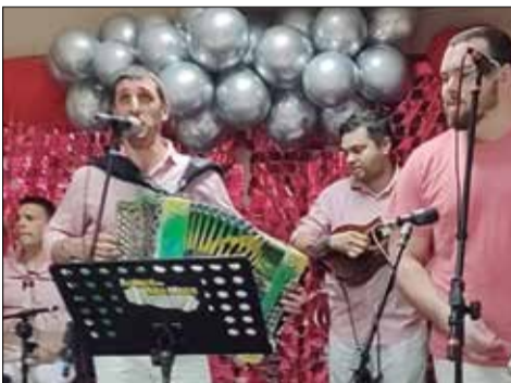
O Conjunto Amigos do Minho, abrilhantou o domingo das Mães na Casa de Espinho