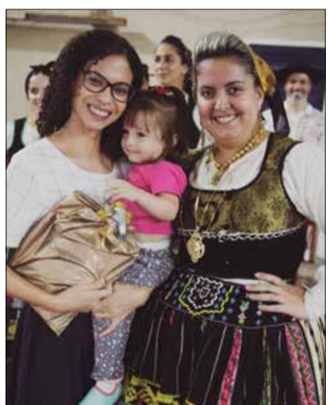
Linda imagem de mães mais nova presente da Quinta de Santoinho, recebendo um presente do componente do R.F. Maria da Fonte

todos, como é tradicional. Foi eleita a Mãe do Ano da Casa do Minho 2022, a Mãe mais nova, a Mãe mais idosa,