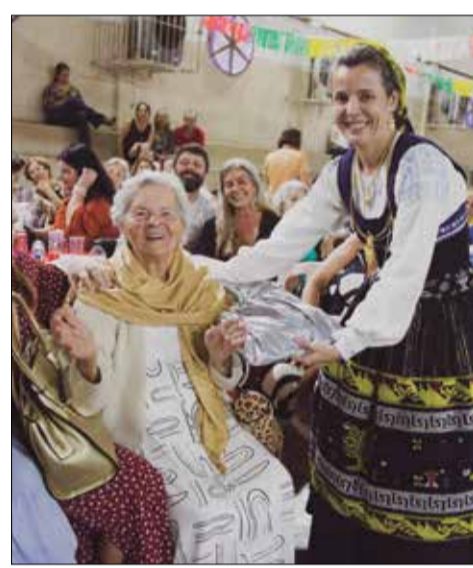
Que felicidade e alegria da mãe mais idosa 91 anos presente na Quinta de Santoinho homenageada pela componente do R. F. Maria da Fonte

que foram homenageados com lembranças, foi uma noite especial com o Rancho Folclórico Maria da Fonte realizando um lindo espetáculo.