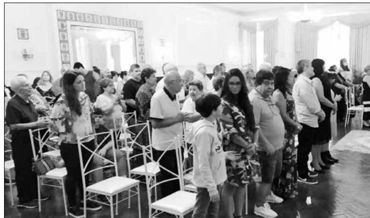
Assistência da Solenidade religiosa, em homenagem às Mães