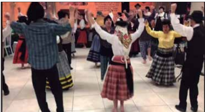
Apresentação marcante do G.F. Fausto Neves, mantando a saudade dos velhos tempos