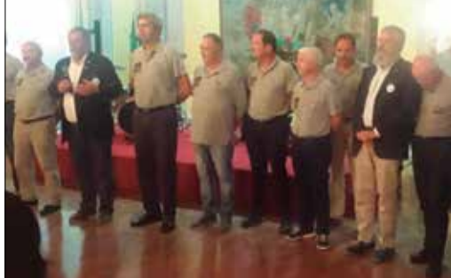
Presente ao evento os convidados, da Marinha Portuguesa e Brasileira