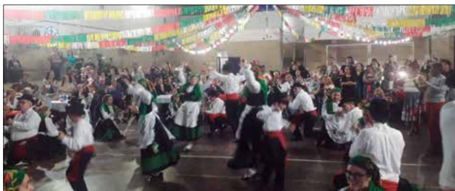
Magistral apresentação do Rancho Folclórico Guerra Jungueiro no último sábado, no Arraial Minhoto. Que show, rapaziada! Parabéns pela linda apresentação