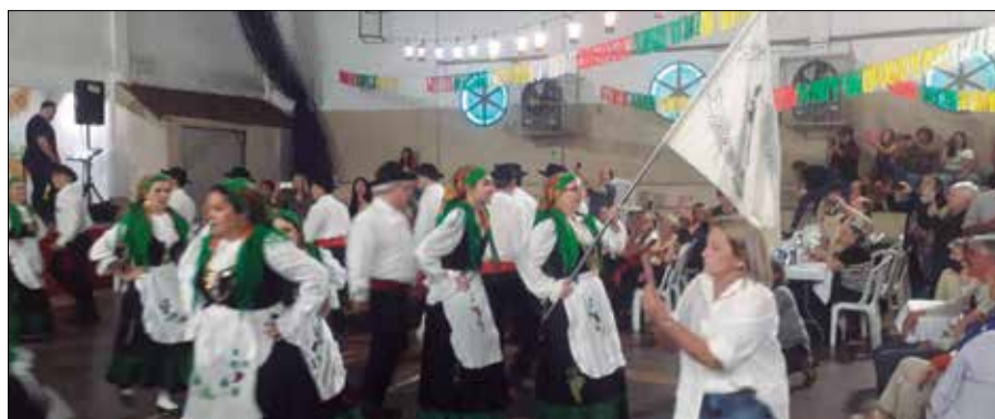
Uma atração à parte, o show do Rancho Folclórico Guerra Jungueiro, encantando o público presente que se encanta com os cantares, dançares, e lindos trajes