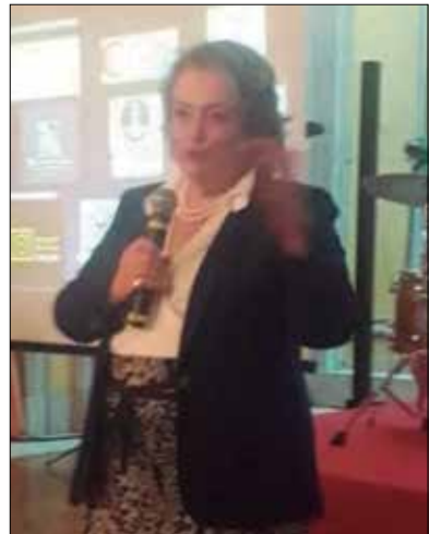
Consul-geral de Portugal no Rio de Janeiro, Gabriela Albergaria, quando falava a Comunidade Portuguesa