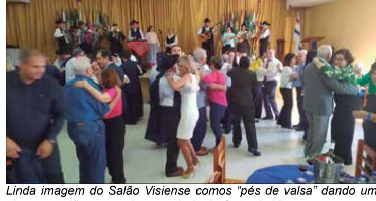
Linda imagem do Salão Visiense como "pés de valsa" dando um show no salão, matando a saudade da Casa de Viseu