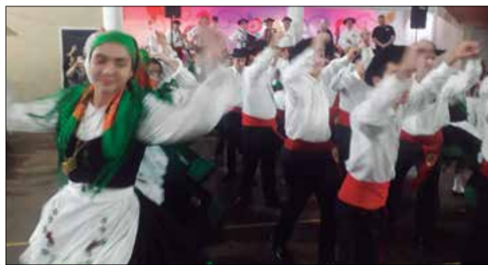
Mais um belo espetáculo Rancho Folclórico Guerra Jungueiro. "Quem sabe, sabe!"