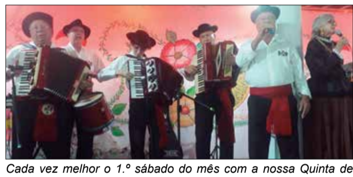
Cada vez melhor o 1.º sábado do mês com a nossa Quinta de Santoinho, na Casa do Minho. Sempre com a tocada realizando uma grande festa