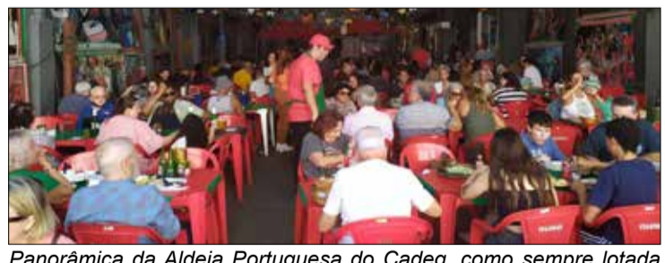
Panorâmica da Aldeia Portuguesa do Cadeg, como sempre lotada de amigos