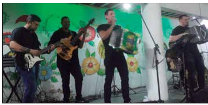
Agitando o sábado passado na Quinta de Santoinho o Conjunto Amigos do Alto Minho

retoria e Departamento Feminino faziam de tudo para que nada faltasse. Sardinha assada, broa de milho, demais acompanhamentos, caldo verde e o vinho eram servidos com simpatia e um sorriso de amizade. A apresentação do Rancho Folclórico Guerra Jungueiro coloriu com seus trajes e a alegria de suas músicas que representavam o importante folclore regional. Sucesso também com as Marchas de Lisboa, arcos, componentes, visitantes, naquele momento estavam em Portugal.