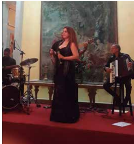
Não poderia jamais faltar a música Portuguesa neste dia especial