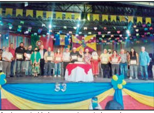
Aqui as autoridades presentes e todos os homenageados.