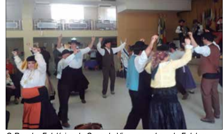
O Rancho Folclórico da Casa de Viseu seu show de Folclore