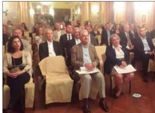
Panorâmica com autoridades e convidados presentes no Palácio São Clemente

de Portugal para cá, caminho percorrido por Gago Coutinho e Sacadura Gabral, em dois meses de viagem contaram com