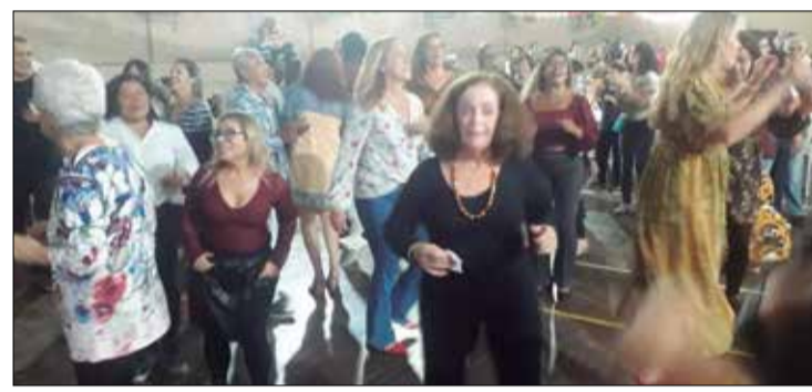
O público numa explosão de alegria no sábado passado na famosa Quinta de Santoinho