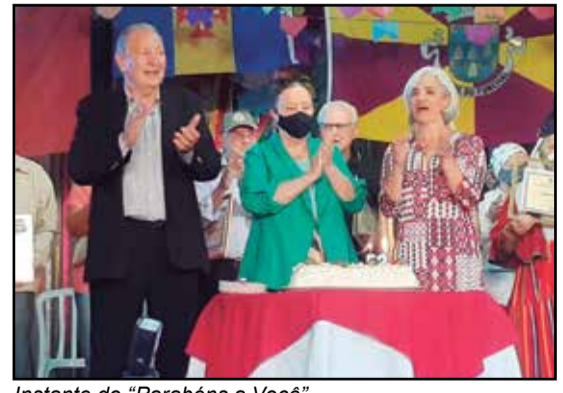
Instante do "Parabéns a Você".