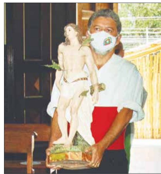
A imagem de São Sebastião, Padroeiro da Casa da Vila da Feira, sendo carregada pelo componente do Rancho