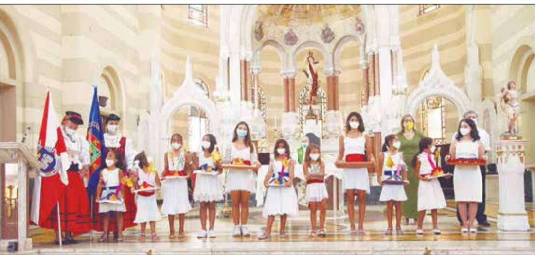
Linda imagem no Altar da Igreja dos Capuchinhos com as crianças carregando as fogaças