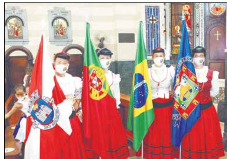
As componentes do R.F. Almeida Garrett, conduzindo as Bandeiras do Brasil, Portugal, da Casa da Vila da Feira e Santa Maria da Feira