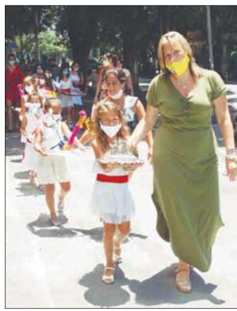
A chegada das crianças com as Fogaças, o Castelo de Prata, na Igreja dos Capuchinhos, a frente a Primeira Dama Rose Boaventura