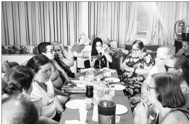
Foi um dia maravilhoso onde as amigas puderam encontra-se num delicioso churrasco