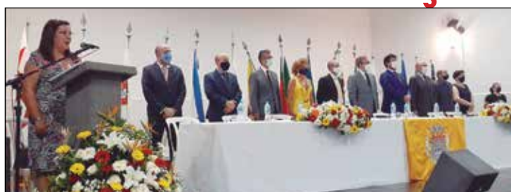
Composição da mesa de honra.