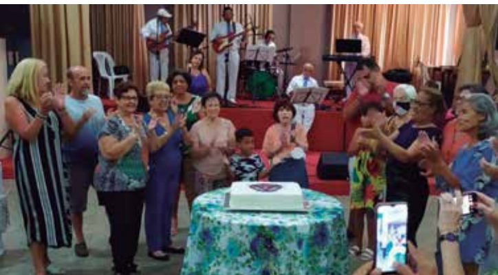
Tradicional momento dos parabéns com os aniversariantes, reunidos diante do Bolo Comemorativo ao som da Banda TB Show