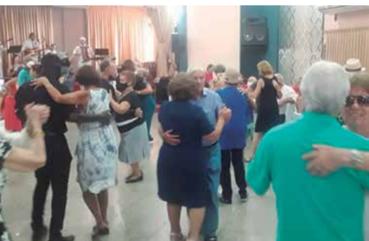
Foi com certeza uma tarde muito agradável, com muita música boa com o Banda TB Show