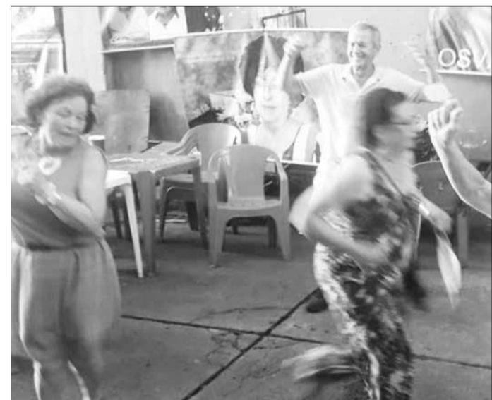
Apesar do forte calor do último sábado, os amigos não deixaram de prestigiar o Restaurante Cantinho das Concertinas, para dançar o vira livre