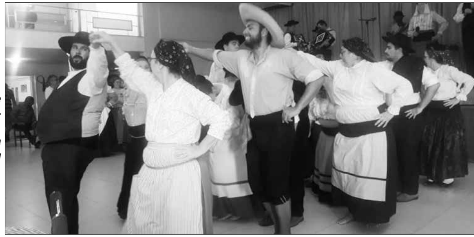
Brilhante apresentação do R.F. da Casa de Viseu