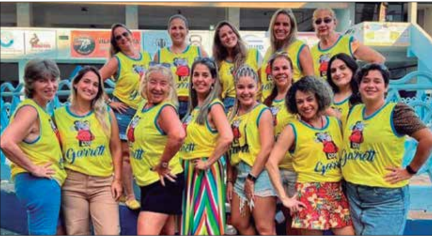
O charme feminino das componentes do R.F. Almeida Garrett, no encontro festivo

No domingo, 1 de maio, o Grupo Folclórico Almeida Garrett completou 60 anos de existência. A Diretoria da Casa da Vila da Feira e Terras de Santa Maria ofereceu um churrasco aos componentes para comemorar a data.