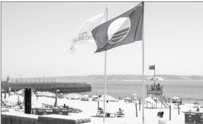
A Associação Bandeira Azul da Europa (EBAE) voltou a reconhecer ao Município de Oeiras "a excelência da qualidade das suas praias"