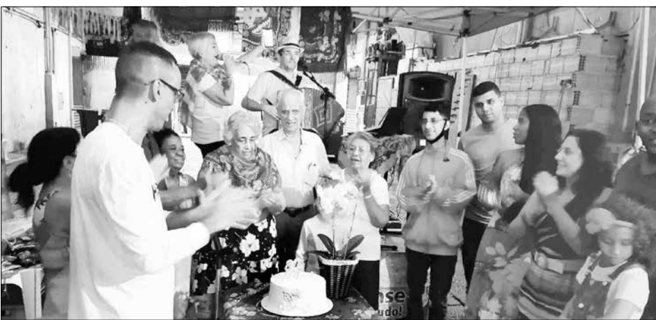
Bonita festa de aniversário de 80 anos, comemorado por esta linda família no Bar do Carlinhos