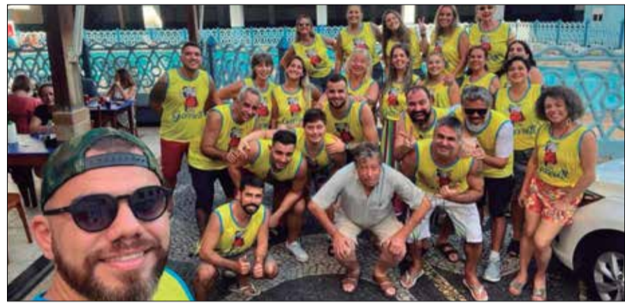
Que imagem marcante o Presidente Ernesto Boaventura reunido com a rapaziada todo R.F. Almeida Garrett

No próximo dia 22 de maio será realizado um Arraial da Quinta do Castelo especial para se comemorar os 60 anos do Garrett.