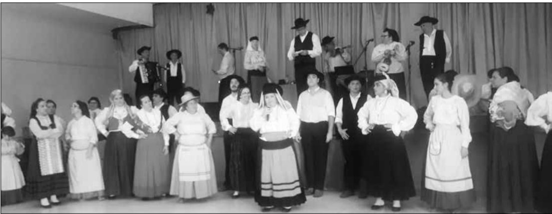
Componentes do R.F. da Casa de Viseu agradecendo a presença de todos os amigos, no Almoço Festivo em homenagem as mães