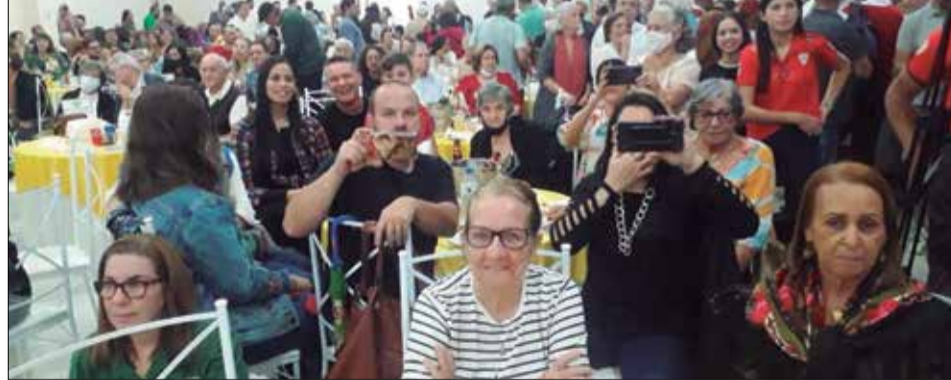
Panorâmica do público presente no Festival de Folclore