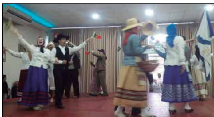
Foi mais uma apresentação brilhante do G.F. Padre Tomas Borba