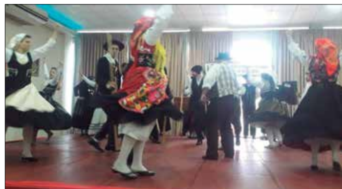
Mais uma vez o G.F. Serões das Aldeias, marcou presença com seu estilo