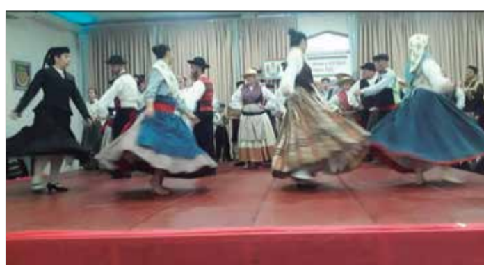
O G.F. Camponeses sempre é uma atração marcante com seu folclore