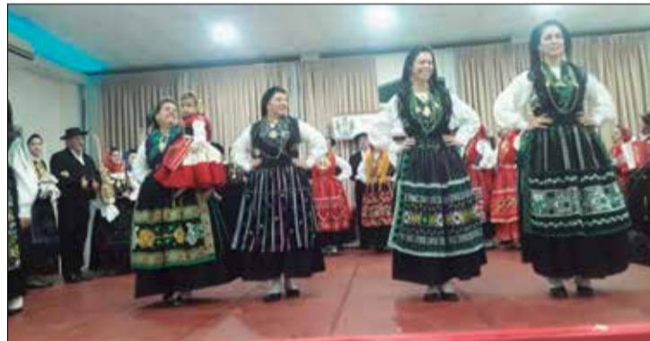
Que espetáculo de folclore o R.F. Maria da Fonte, apresentou no domingo passado