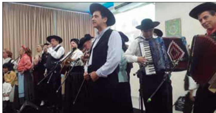
As Tocatas sempre dando show como a da Casa de Viseu