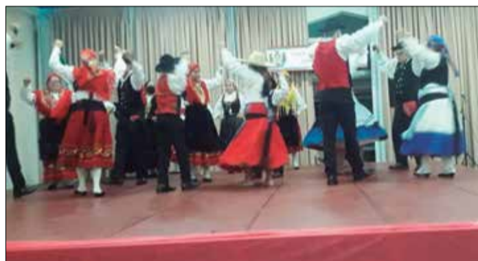
Apresentação magnífica do R.F. Armando Leça fechou o Festival com chave de Ouro