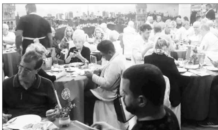
Lindo visual do Almoço das Quintas nas Beiras totalmente lotado