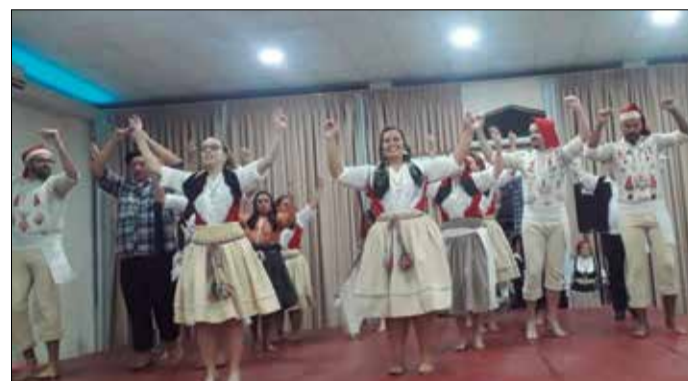
R.F. Eça de Queiros, blindou o público presente com um lindo espetáculo