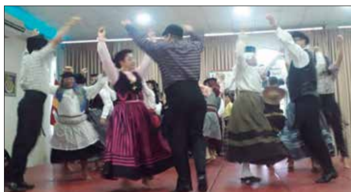
As apresentações do R.F. da Casa de Viseu sempre impecável