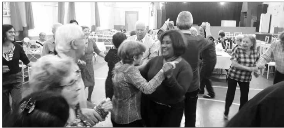
Explosão de alegria da família Portuguesa no Orfeão Português no domingo passado