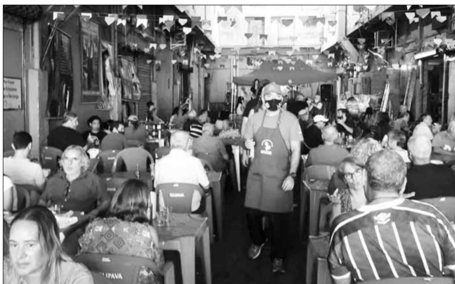
Panorâmica da Aldeia Portuguesa do Cadeg esse mês em ritmo de São João