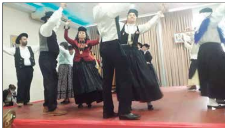
O R.F. do Arouca Barra Clube, brilhou no Festival dando show