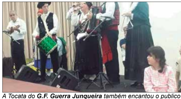
A Tocata do G.F. Guerra Junqueira também encantou o público